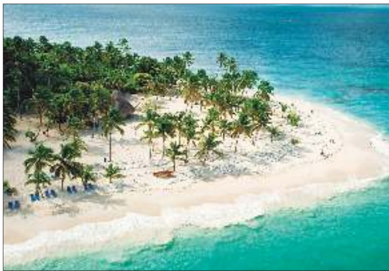
MAR. Sus balnearios son el escenario ideal para las actividades acuáticas.