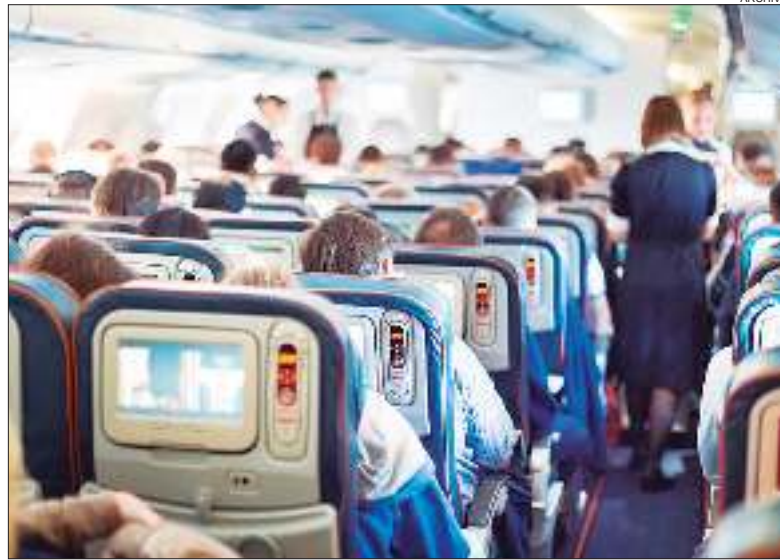
EXPEDIENTE. El fallo se dictó en "G. M. c/ Aerolíneas Argentinas SA s/ Ley de Defensa del Consumidor".

Dijo que desconocía las comunicaciones entre la mujer y la empresa Stella Viajes y aclaró que, de ha-