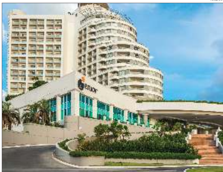
RESORT. El hotel ubicado frente a la Playa Mansa es un ícono del destino uruguayo.

Para no olvidarse de las risas, el viernes 7 el humorista Fede Cyrulnik traerá desde Argentina su pre-