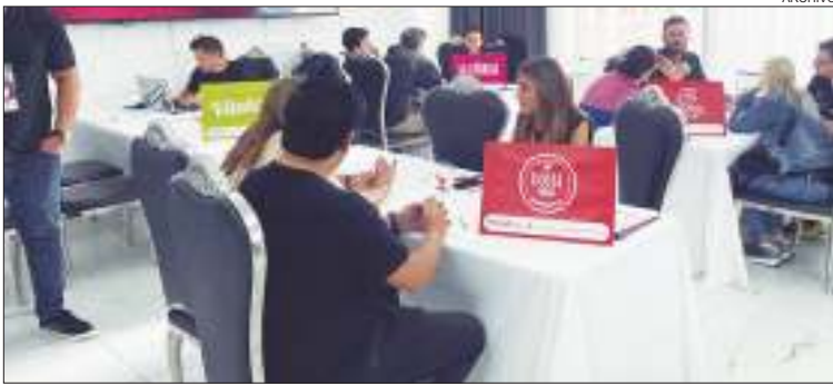
MEETING. Las reuniones con las franquicias se reservan de forma online y contemplan espacios de media hora.

Córdoba será sede de FranquiDay, una oportunidad para interesados en franquicias rentables