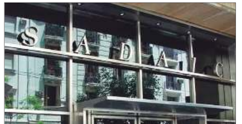
(*) Doctor en derecho y ciencias sociales. Profesor adjunto de la UNC

Analizando el decreto y, más allá de las opiniones encontradas que ha generado, como también de supuestos disvaliosos que en la práctica puedan darse (por ejemplo, del autor o titular que pudiera quedar desamparado por no conocer cómo gestionar sus derechos), lo cierto es que las nuevas tecnologías han acercado a los autores la posibilidad de la autogestión de sus derechos y el decreto es conteste con ello. La mayoría de los actos de explotación de obras se realizan en Internet y el autor puede ejercer un control directo de ello por medio de los mecanismos digitales. Nótese, por ejemplo, que las plataformas musicales podrían remitir detalles en planillas de la cantidad de reproducciones de una obra y liquidar directamente el pago de los derechos al autor que se encuentre registrado, sin intermediarios que encarezcan la gestión. Sin embargo, aquellos que opten por continuar delegando la gestión en entidades de gestión colectiva, podrán hacerlo. La nueva reglamentación da lugar a la libertad de opción, sin que ello implique renegar de todo aquello positivo que han logrado las entidades de gestión colectiva en defensa de los intereses de los autores. El tiempo dirá si hemos dado un paso adelante.