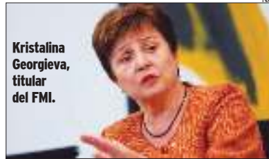
Kristalina Georgieva, titular del FMI.