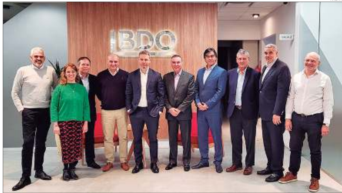
SEDE. En Argentina cuenta con 50 años de trayectoria.

La firma presentó BDO Alianza Latina, un nuevo cluster que ofrece servicios de auditoría, consultoría, impuestos, legales, outsourcing y payroll , con el objetivo de llevar soluciones y servicios de calidad