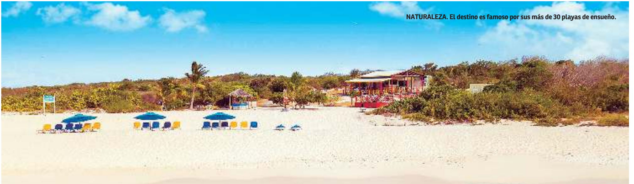
NATURALEZA. El destino es famoso por sus más de 30 playas de ensueño.