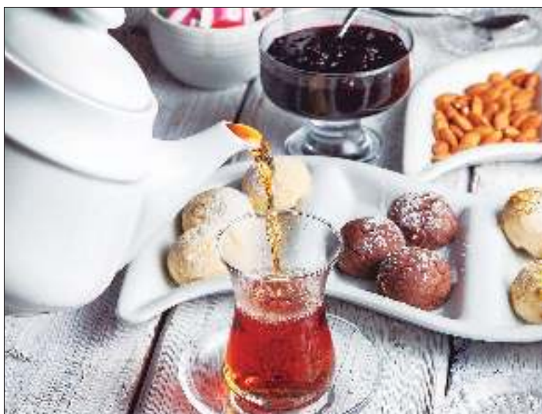
TRADICIONES. El mate argentino y el té turco son rituales sociales.

en paseos por las calles, plazas, restaurantes e incluso en viajes para disfrutar de ellos. Por otro lado, Turquía es famosa por su devoción a los pequeños felinos, especialmente Estambul, considerada la "ciudad de los gatos", donde se les puede encontrar en bazares, restaurantes, y en las calles siendo muy bien cuidados y mimados. En ambas culturas ambos son apreciados no sólo como mascotas sino también como compañeros, un amigo fiel respetado sin igual.