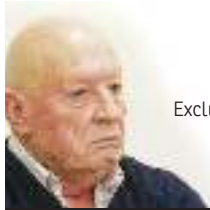
► Por Luis Esterlizi * Exclusivo para Comercio y Justicia