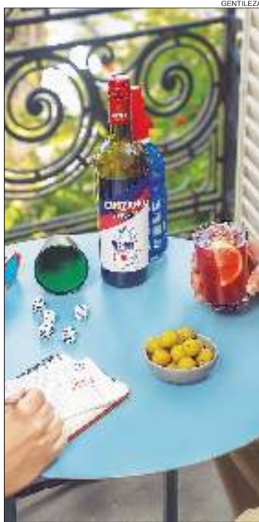
TENDENCIA. La cultura del vermut sigue creciendo en el interior del país.

La manera en que los argentinos disfrutan del vermut ha evolucionado sin perder su esencia. "El clásico Cinzano con soda, limón o