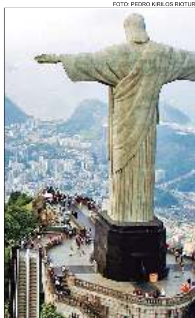
PUBLICIDAD. Se lanzó la campaña internacional Río, cidade abençoada ("ciudad bendecida").

Según el presidente de Embratur, Marcelo Freixo, el éxito de la atracción es un impulso más a la campaña de la agencia para la promoción internacional de Río