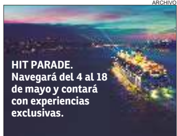
HIT PARADE. Navegará del 4 al 18 de mayo y contará con experiencias exclusivas.

Costa Cruceros presentó el Hit Parade Cruise, el nuevo crucero C/Club 2025 que incluye una propuesta aún más exclusiva disponible tanto para los miembros del programa de fidelización de la compañía como para todos los demás huéspedes.