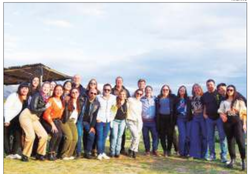
ORGANIZADORES. Grupo 384 Global y Agencia Neuro Acción.

organizado por 384 Global y Agencia Neuro Acción, dos referentes en consultoría y desarrollo de negocios.