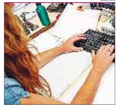
SALARIO. Las mujeres argentinas ganan, en promedio, 27,2% menos que los hombres.

Discriminación: un estudio de Adecco en 2024 reveló que 63% de los argentinos ha sido testigo de microagresiones contra mujeres en sus lugares de trabajo.