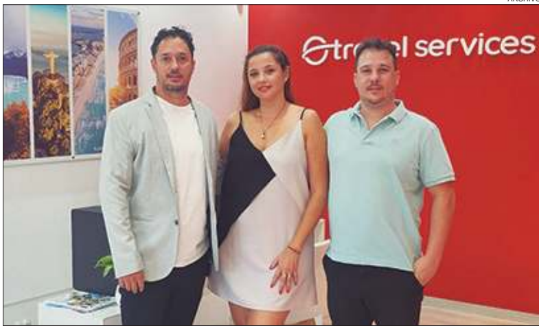
APERTURA. Los directivos de Travel Services en su nuevo local del Cerro de las Rosas.

La agencia de viajes con casa matriz en Buenos Aires y oficinas comerciales en Santiago de Chile y Montevideo, llegó a esta ciudad con un local en la zona norte y, para antes del cierre del primer cuatrimestre del año, tiene planeado sumar una segunda franquicia en la zona sur