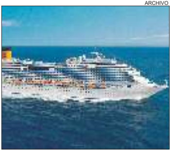
PARTIDA. Los itinerarios saldrán de los puertos de Santo Domingo y La Romana.

Costa Cruceros duplicó su oferta en el Caribe con nuevo puerto de embarque