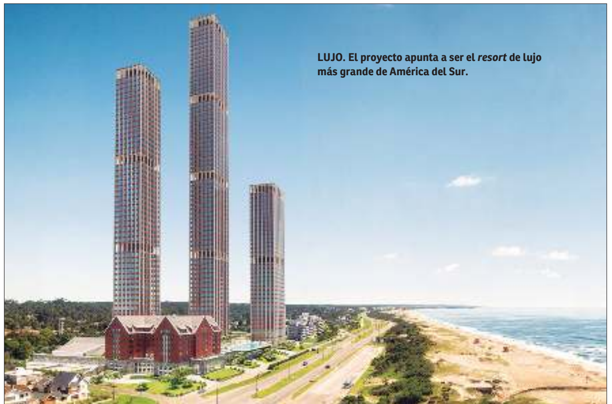
LUJO. El proyecto apunta a ser el resort de lujo más grande de América del Sur.