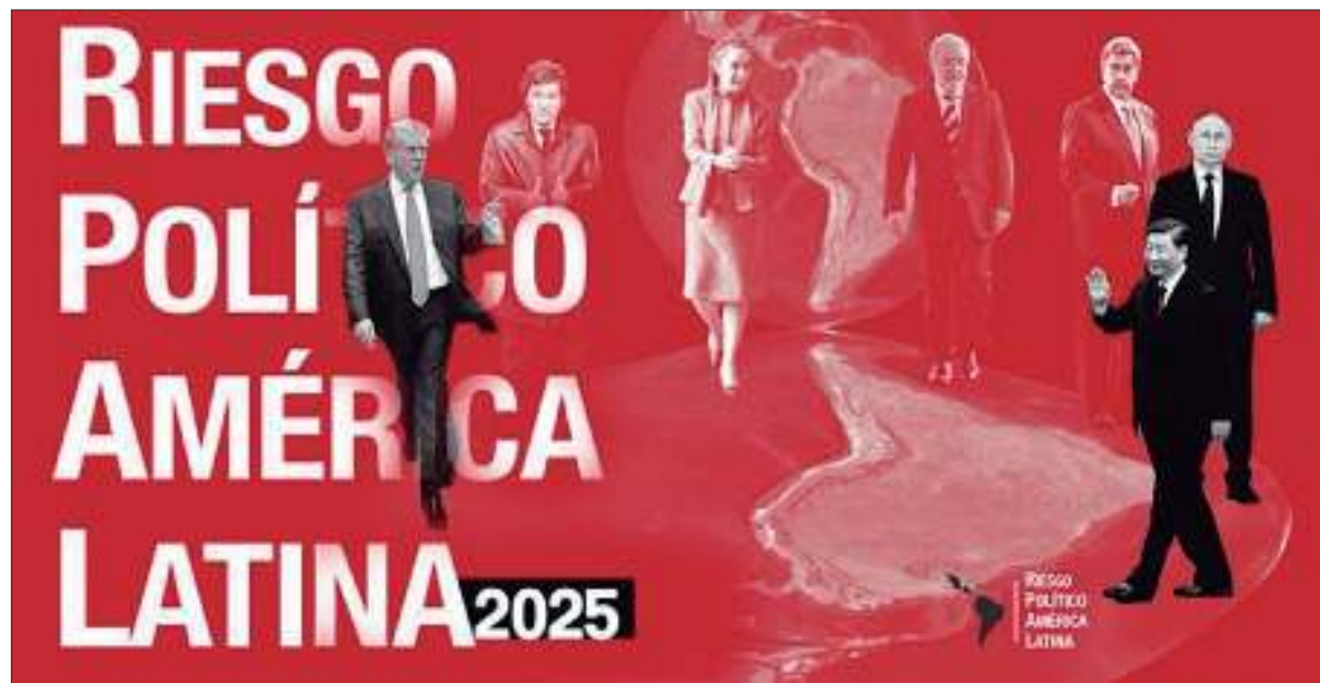
AÑO DECISIVO. Qué pasará en América Latina en medio de la incertidumbre global.

Así lo indica el Índice de Riesgo Político de América Latina 2025 que acaba de presentar el Centro