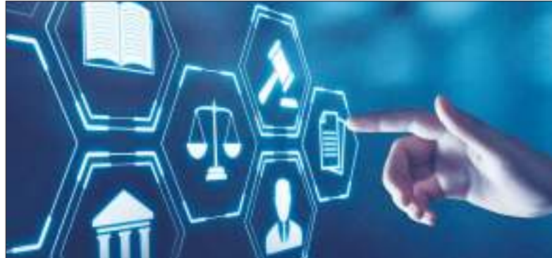
INTELIGENCIA ARTIFICIAL. Detallan cómo impactará en el trabajo jurídico este año.

Desde la gestión del conocimiento, los contratos inteligentes, hasta la automatización, siete tendencias que transformarán el ámbito jurídico este año