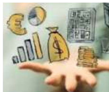
ALZA. Hay optimismo sobre el desempeño que podrían tener las principales cripto.

Con el tercer puesto entre todos los activos relevados y encabezando