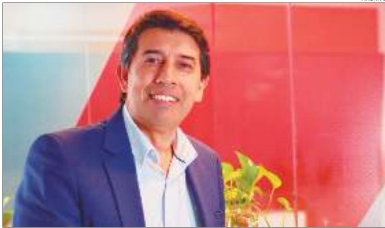
DIAZ. "Es clave entender de qué manera las tecnologías pueden aportar valor agregado".

Según un informe de Tivit Argentina, tendencias como la inteligencia artificial, la ciberseguridad, las soluciones en la nube (pública y privada), automatización y la digitalización estarán marcando la dirección del mercado actual durante 2025.