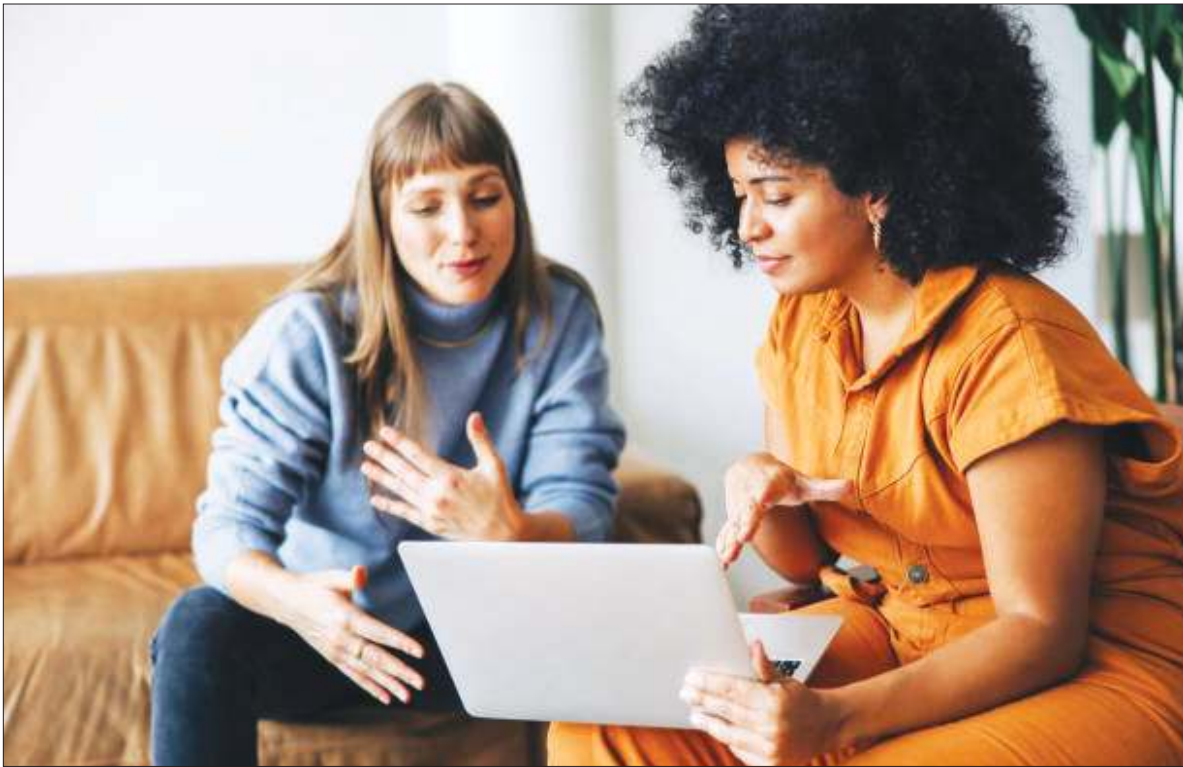
SER MUJER EN ARGENTINA HOY. Qué piensan sobre educación, médicos y relaciones.

Un estudio revela que ellas enfrentan mayores obstáculos educativos, desconfían más del sistema de salud y tienen una mirada más flexible sobre el matrimonio y la familia