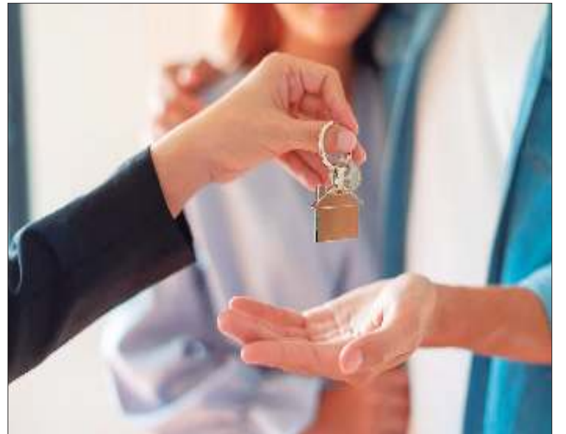
REVUELO EN EL MERCADO INMOBILIARIO. Entidades profesionales salieron al cruce de la desregulación.

"En primer lugar, consideramos que es inconstitucional porque los colegios profesionales son facultades delegadas de los Estados provinciales, por lo tanto el Gobierno nacional no se puede meter en la órbita provincial. En segundo lugar, hablamos de desregulación de una profesión que está totalmente desregulada porque el corretaje inmobiliario es para quien opte contratar un corredor inmobiliario para realizar una operación inmo-