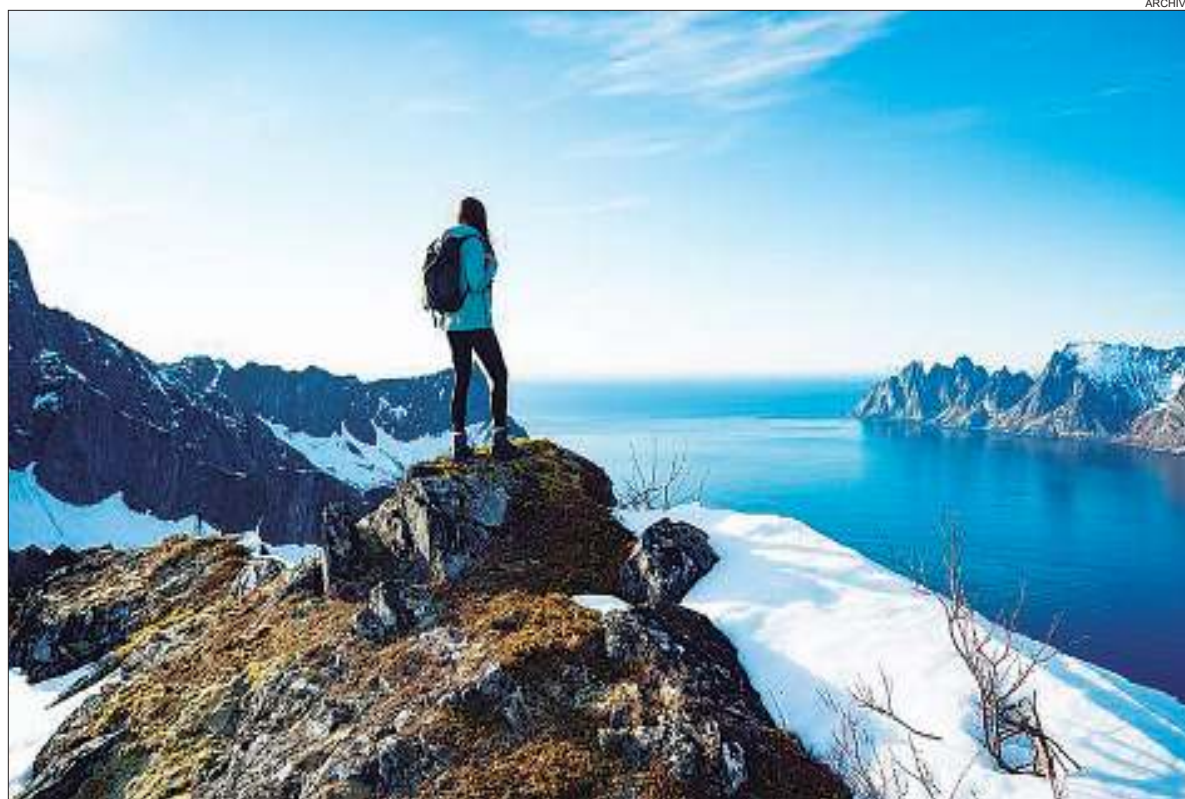
VIAJERAS. Buscan experiencias memorables y seguras.

2. Documentación: guardar en un lugar separado copias de documentos importantes ya sea de manera impresa o digital, así como también una lista de contactos de emergencia como los de la policía local y la embajada del país de origen.