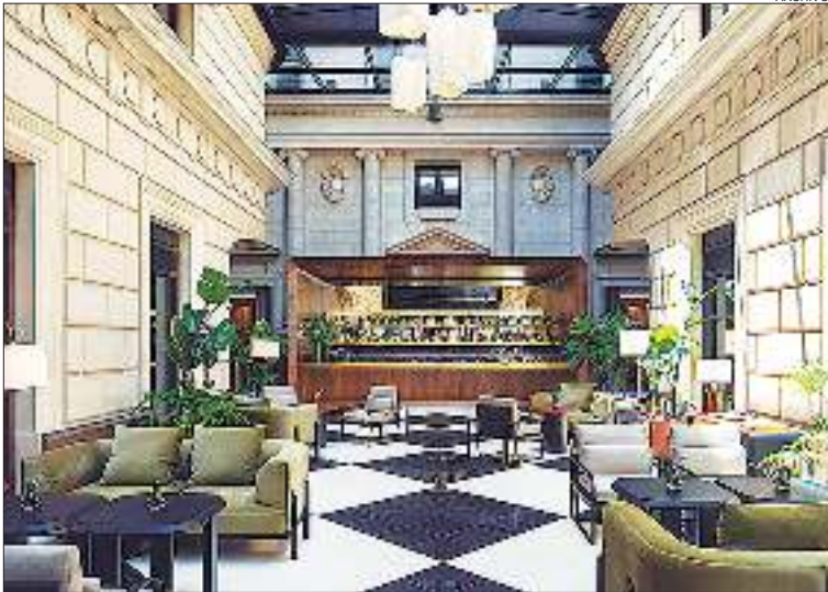
LUJO. La marca de hoteles incorpora la propiedad a su portfolio este 2025.

Casa Lucia, el hotel que combina lujo, elegancia y exclusividad en pleno barrio de Buenos Aires, se incorpora al portafolio de hoteles de la marca The Meliá Collection y de esta manera, se convierte en el primero que el grupo español Meliá Hotels International abrirá bajo su marca de lujo más selecta en Latinoamérica.