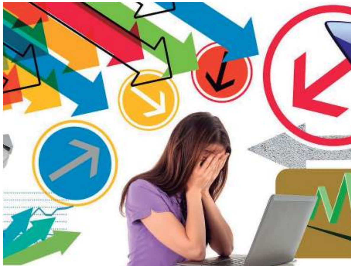
CÓRDOBA. Las mujeres profesionales trabajan cada vez más horas con contratos precarios.

La inequidad en los ingresos persiste y se agrava en el sector profesional. Mientras que la Encuesta Permanente de Hogares del Indec registró una brecha de in-