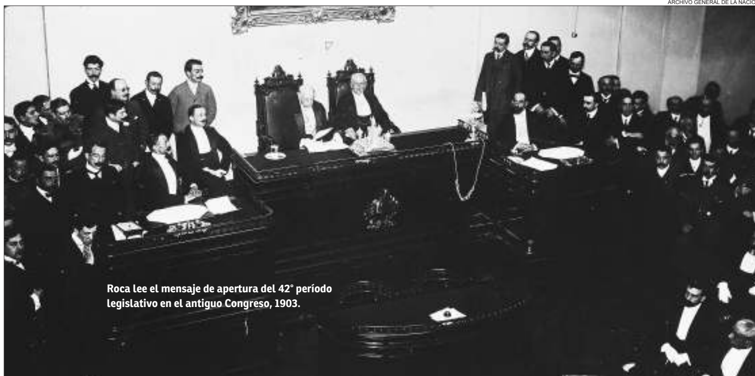
Roca lee el mensaje de apertura del 42° período legislativo en el antiguo Congreso, 1903.

Dicho autor entiende como primeras normas laborales de nuestra nación independiente una disposición dictada en la Gobernación de Martín Rodríguez sobre la tarea de los aprendices de "artes o