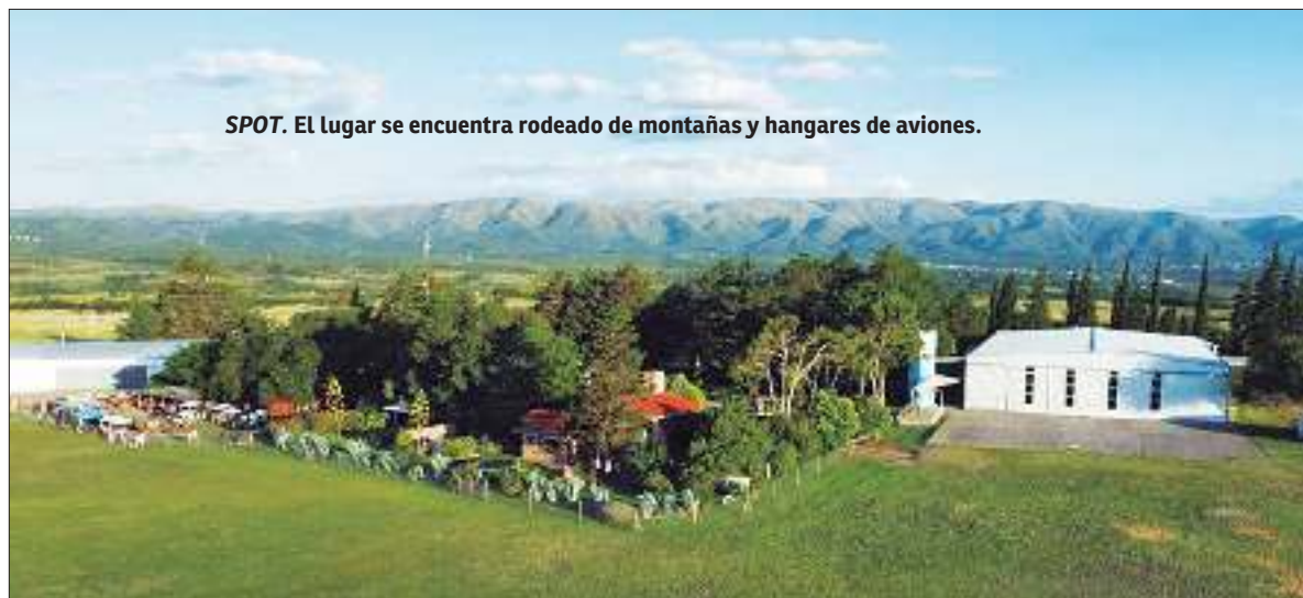
SPOT. El lugar se encuentra rodeado de montañas y hangares de aviones.

“Lo más imponente de Aeroposta es la ubicación. Se encuentra 200 metros metido dentro de un campo donde hay un camino soñado para llegar al lugar. Tiene hangares a su alrededor con aviones, por ende, mientras los DJ es-