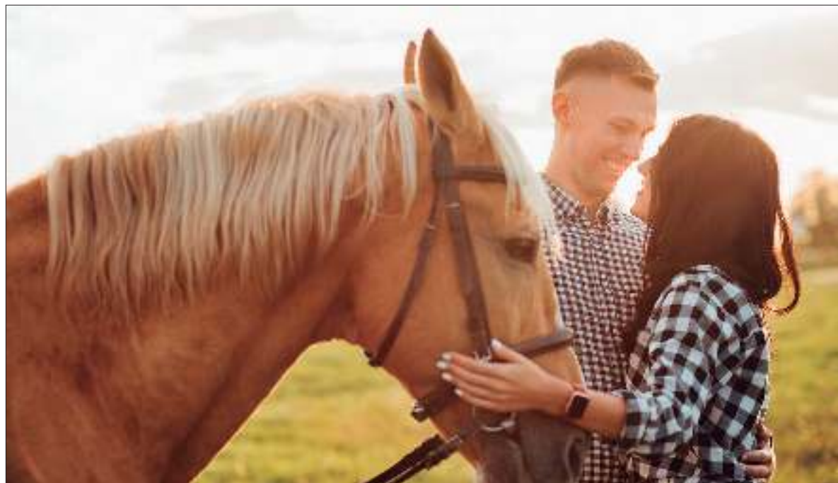
VIVENCIAS. Civitatis ofrece excursiones en más de 160 países.

Una plataforma online de visitas guiadas, excursiones y actividades en español propone una serie de opciones para celebrar el Día de los Enamorados con nuevas emociones