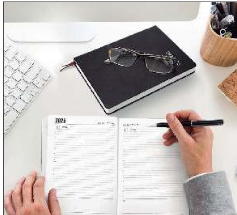
INTELIGENCIA ARTIFICIAL Y TRANSFORMACIÓN DIGITAL. Temas que lideran la agenda de RRHH este año.

Las nuevas generaciones -los nativos digitales- están fuertemente atravesadas por la tecnolo-