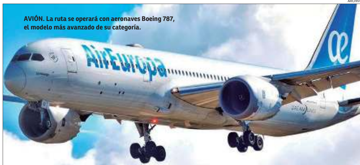
AVIÓN. La ruta se operará con aeronaves Boeing 787, el modelo más avanzado de su categoría.

A partir de junio, la aerolínea aumentará su oferta de plazas a cerca de 111.600 asientos. Las expectativas de crecimiento de esta ruta, que se cubre con la flota Dreamliner, permiten prever una ocupación de 90%