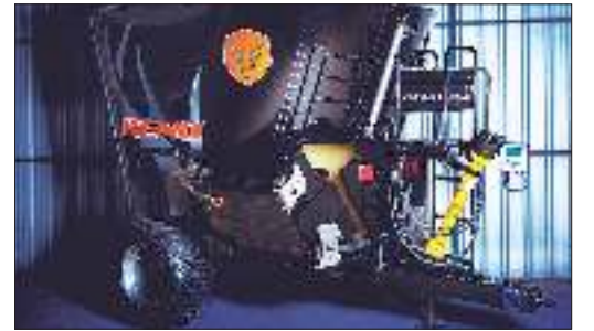
DISEÑO. El mixer cuenta con tecnología avanzada que optimiza el rendimiento.

Industrias Reno, empresa del Grupo Campo de Morteros (Córdoba), continúa apostando a la innovación y a la diferenciación con el lanzamiento de un nuevo mixer vertical, que se distingue por su funcionalidad, tecnología y calidad.