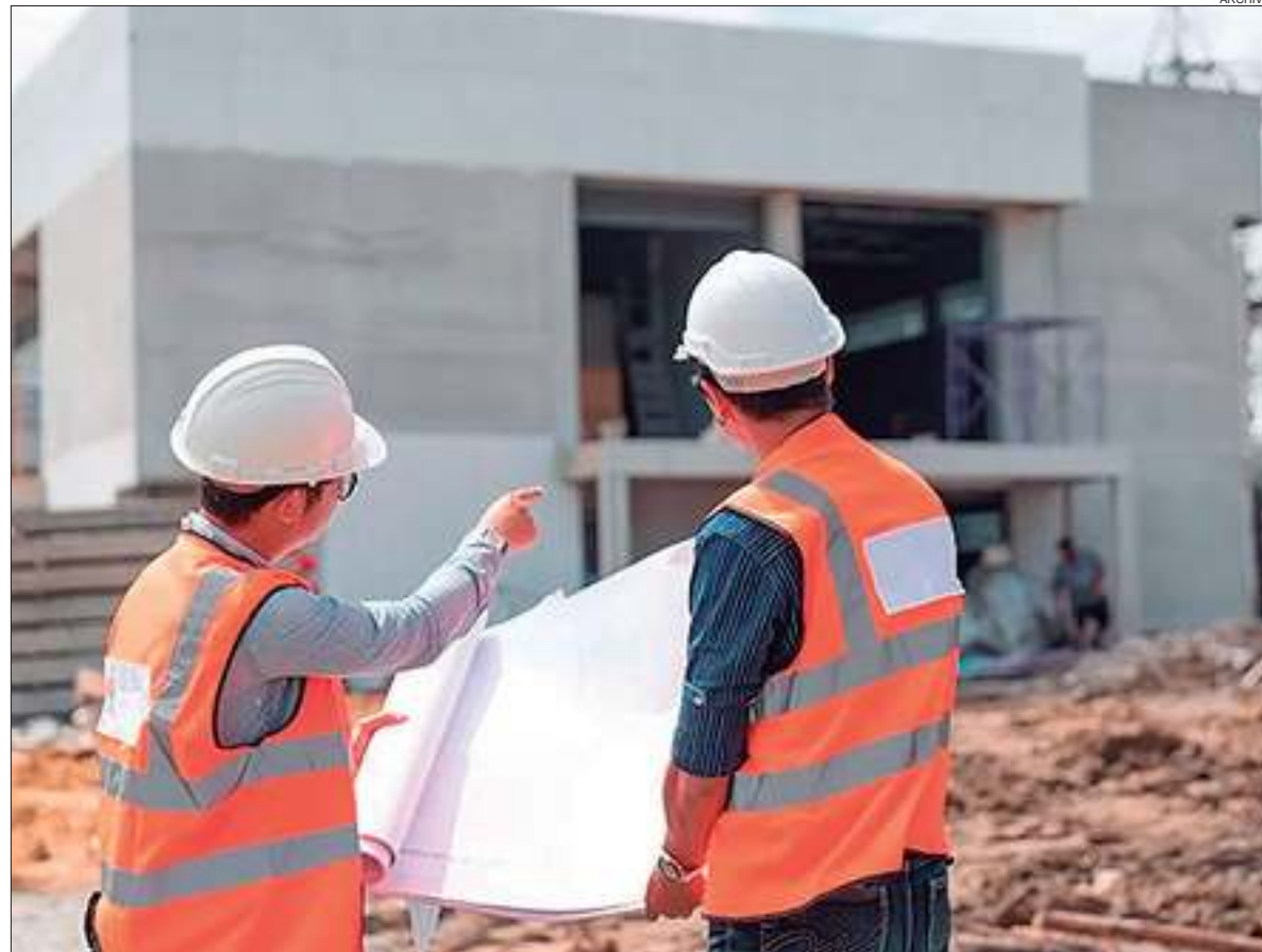
TENDENCIA. Prevén que continúen estables los precios de materiales de la construcción.

adoptando los principales actores del mercado para atraer clientes y manejar los niveles de stock?