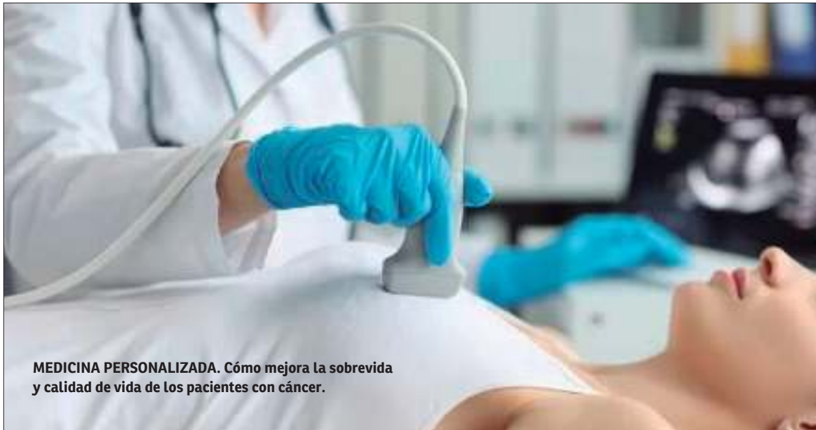
MEDICINA PERSONALIZADA. Cómo mejora la sobrevida y calidad de vida de los pacientes con cáncer.