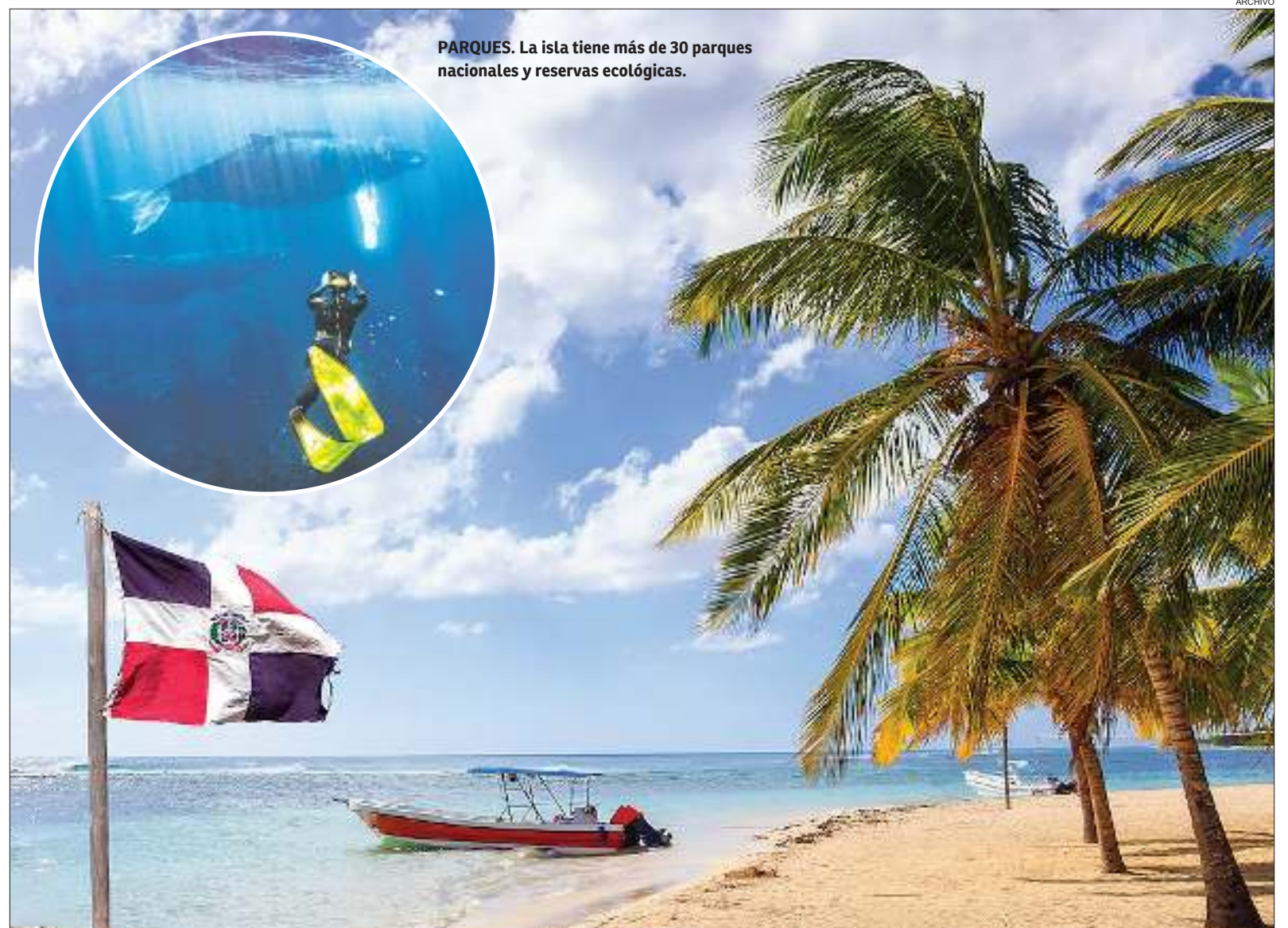
PARQUES. La isla tiene más de 30 parques nacionales y reservas ecológicas.

Se trata de un destino único para los amantes de la naturaleza, ya que ofrece una mezcla perfecta de biodiversidad, paisajes impresionantes, experiencias culturales y actividades recreativas