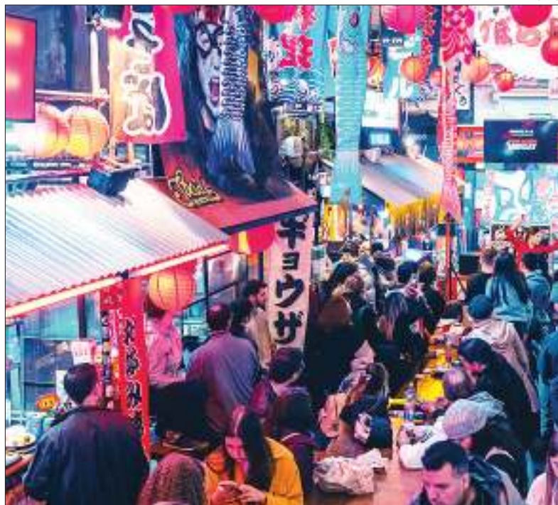
MATSURI. Es un festival japonés que celebra sus costumbres y legado cultural.

Se trata del primer gran Matsuri, que se desarrollará en Mercat Villa Crespo los próximos días 18 y 19 con entrada libre y gratuita. El evento contará con espectáculos, gastronomía, feria asiática, comida callejera y tradiciones para toda la familia