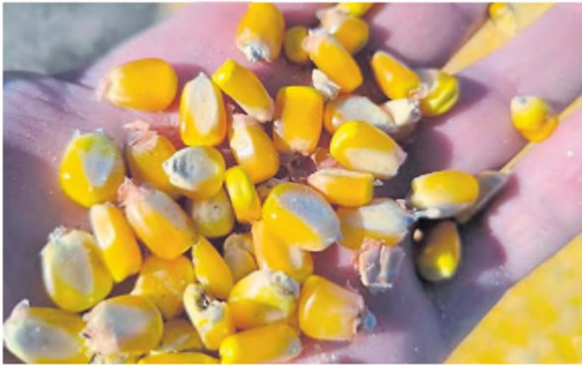
Maíz litoraleño. Siembran 55.000 plantas por hectárea, con una alta carga de fertilización nitrogenada.