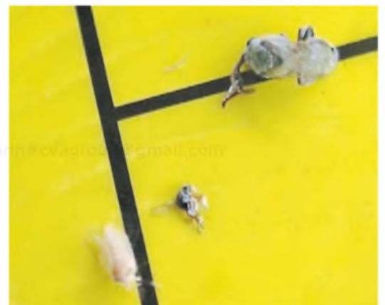
Chi charrita. Puede volar hasta 30 kilómetros de distancia.

En ese sentido, dijo que es mejor realizar los controles en las primeras horas de la mañana o al atardecer , cuando el calor no es tan fuerte, y la chicharrita sale de adentro de la planta para buscar fresco y humedad. ■