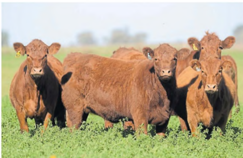
Aspectos del patrón racial. Cabeza corta, frente y morros anchos, entre otras cualidades de la raza.