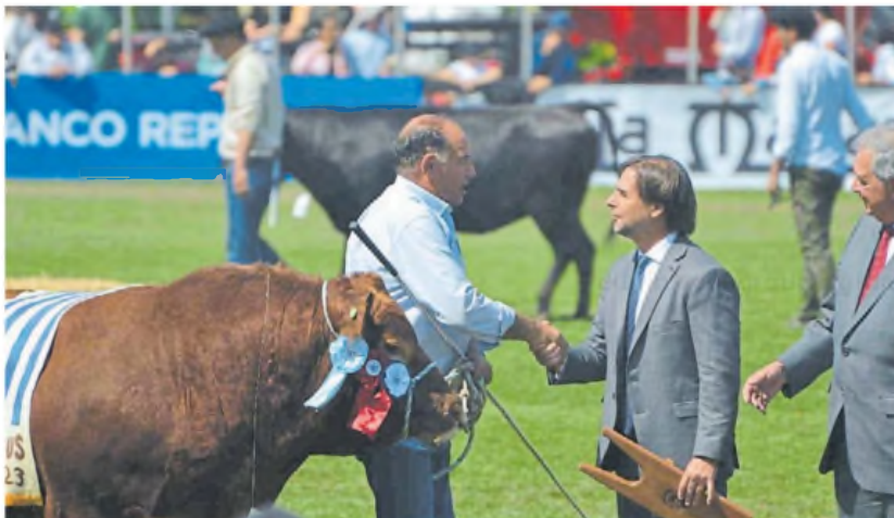
Premio. Leonardo recibe el premio en Uruguay en manos de Luis Lacalle Pou.

con nombre argentino, que compitió en el marco internacional y le ganó a razas ya impuestas a nivel mundial ayuda mucho a su difusión y nos da un importante impulso de marketing".