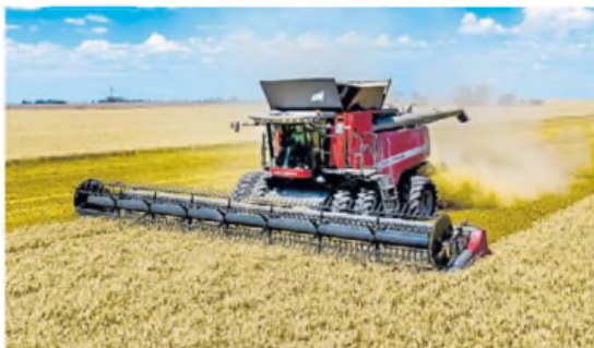
Serie Trident. Los modelos axiales se verán en la muestra.

Según apuntaron desde la marca, la cosechadora Axial de Massey Ferguson fue desarrollada pensando en la necesidad del agricultor que busca aumentar la productividad en el campo al reducir la emisión contaminante, el consumo de combustible y los costos operativos. Como resultado, el productor tiene una cosechadora mucho más confiable, más fácil de mantener y más económica para trabajar.