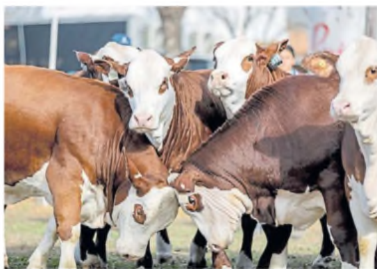
Evento. Se incorpora una nueva categoría denominada Promocionada.

La exposición ganadera, que promete ser una de las principa-