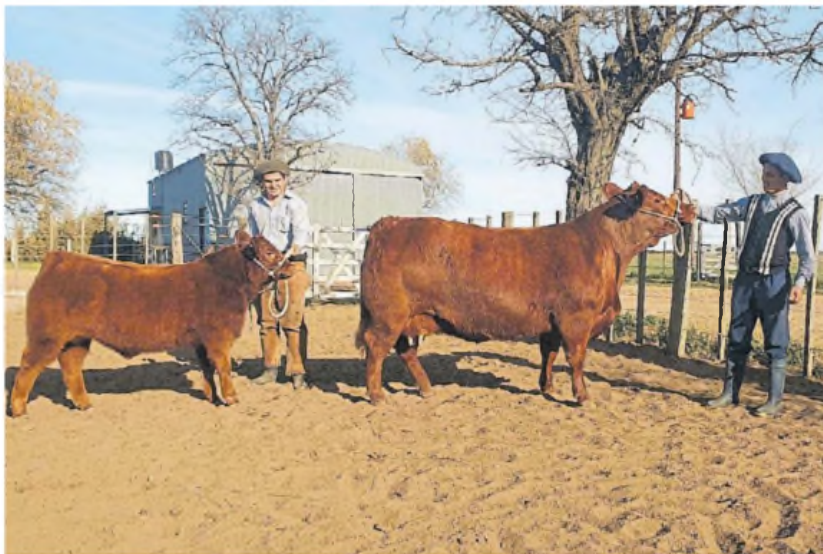
La gran ganadora. La vaca Lusan Indecisa y su ternero en su hábitat natural.

La importancia del torneo. "En mi caso, como criador de Limangus la importancia de este campeonato es hacer conocer una raza criada, hecha en Argentina en base al ganado criollo que a su vez es descendiente del traído por los españoles. Es la única raza criada en Argentina