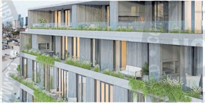
Nuñez. Casa Besares, una de las propuestas que está llevando a cabo Estudio Kohon.