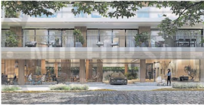
Villa Urquiza. VIA Juramento, un proyecto de la desarrolladora Rosbaco & Partners.