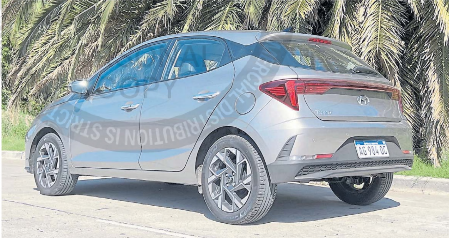
Llamativo. El particular diseño de las luces traseras es el único elemento de estilo que se sale de la normalidad en este compacto.

Distancia entre ejes 2.530 mm Peso 1.040 kg Baúl 300 Dm3 Tanque de combustible 50 litros