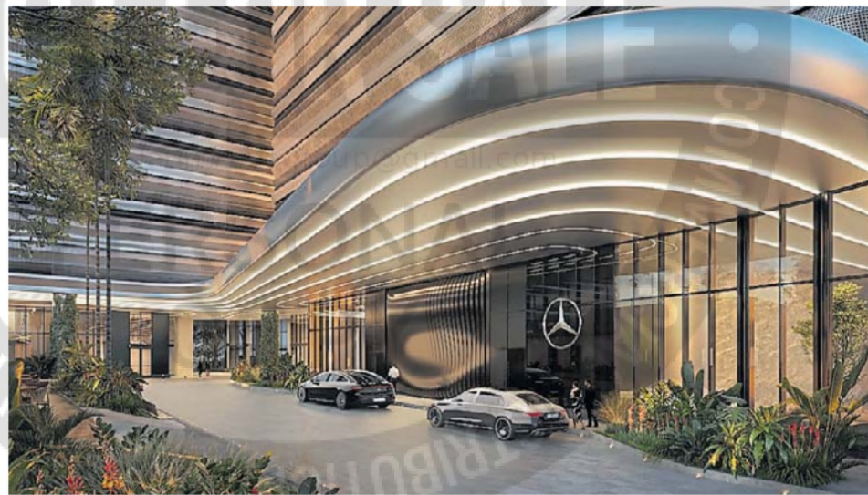
Ingreso. Fachada de una de las torres del Mercedes-Benz Places.*