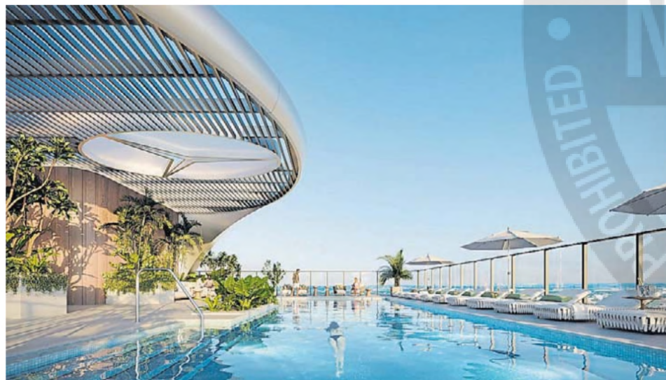
Pileta. Los residentes contarán con una de uso exclusivo en la terraza.

El proyecto además albergará estaciones de carga para vehículos eléctricos, bicicletas y scooters compartidos, servicio de valet parking y autos residenciales para los residentes. ■