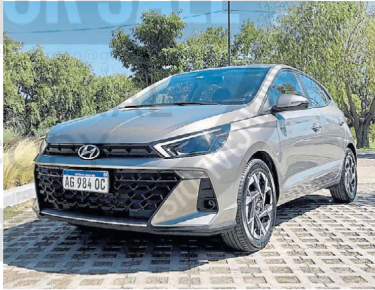
Luces diurnas. Son exclusivas de esta versión Platinum Safety.

El único elemento distinguido respecto de otros modelos es el cargador inalámbrico del teléfono, "oculto" dentro de la consola central, lo que contribuye a no "manotear" el celular en cada semáforo.