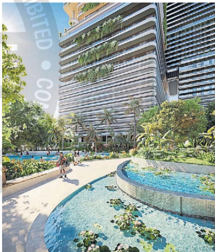
Precios. Los monoambientes arrancan en US$ 700.000.