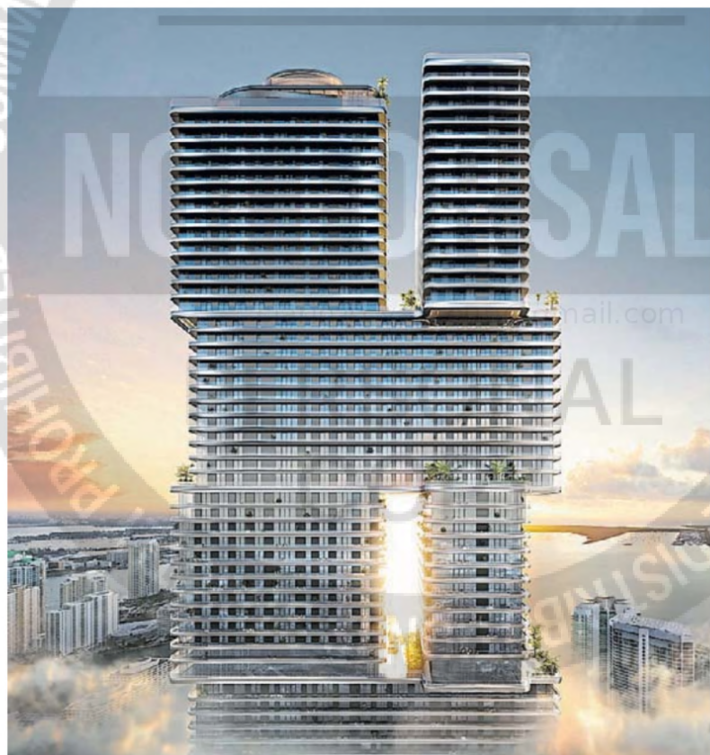
Diseño. Según sus creadores, se buscó crear algo atemporal.