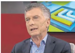
Mauricio Macri Ex presidente y titular del PRO

El destino de Patricia Bullrich también se enredó cuando era presidenta del PRO y candidata a presidente . Dejó a Cambiemos fuera del balotaje. Ese chiste, responsabilidad de Macri, le hizo perder a su coalición 18 puntos porcentuales de votos entre 2021 y 2023. El colmo fue que esa pérdida la sufrieron sin siquiera gobernar. Solo por hablar por radio. La misma sombra de esa incompatibilidad le quitó apoyos a Axel Kicillof cuando quiso ser presidente del PJ Nacional. Ahora amenaza a una candidatura a Cristina de Kirchner, que es presidenta del PJ Nacional. La explicación es simple: tener poder es ceder poder, no acumularlo .