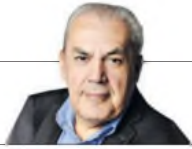
Ignacio Zuleta Periodista. Consultor político