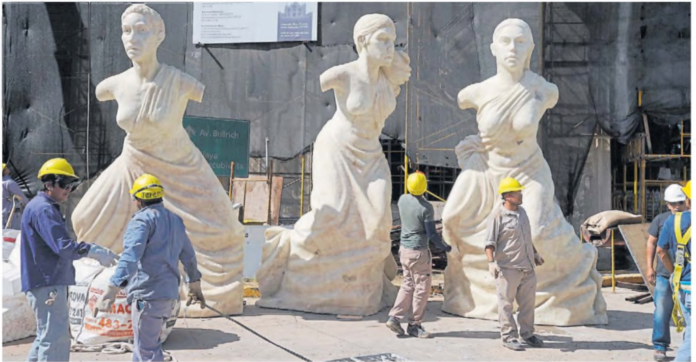
Movimiento. Aquellas obras de arte que no se pueden restaurar in situ, son trasladadas al taller de Palermo, donde les devuelven el brillo.

El taller de la dirección de Monumentos y Obras de Arte (MOA) queda en Palermo y lo están ampliando. Allí arreglan las esculturas de la vía pública.