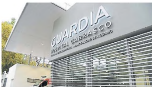
Asistencia. La joven fue trasladada al Hospital Carrasco, donde murió.

comisión de un gabinete criminalístico para la preservación y relevamiento de la escena del hecho, levantamiento de rastros, pericias fotográficas, toma de testimonios a vecinos y personas que puedan aportar datos de interés para la investigación.