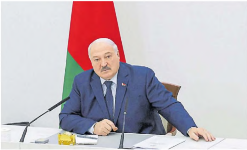
Mensaje. El autócrata de Bielorrusia, Alexander Lukashenko, tras los comicios de ayer.