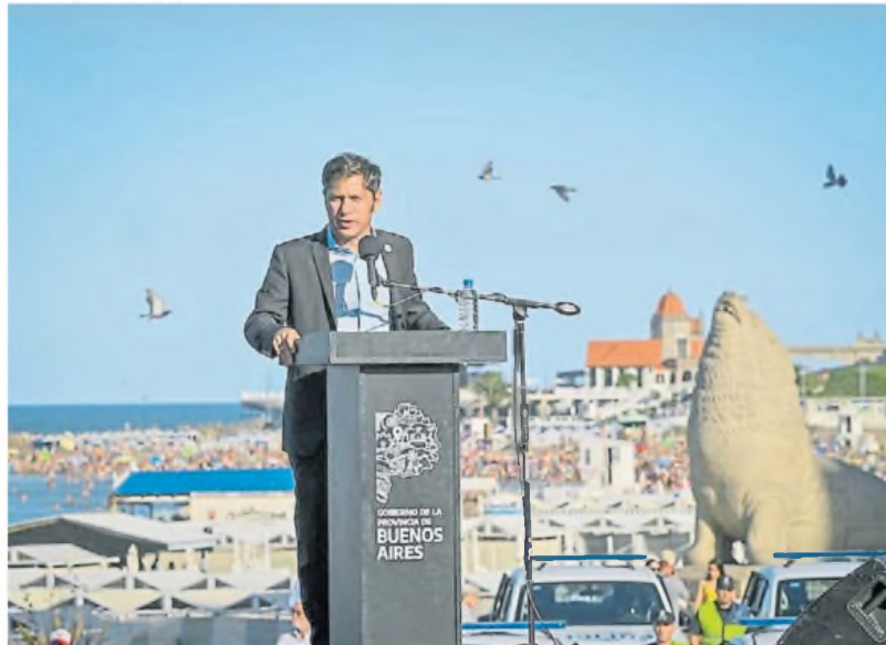
Sale al ruedo. Antes de decidir si desdobra la elección en la provincia, busca medir los apoyos.

Las tensiones entre ambos se mantienen latentes desde el acto por el Día de Lealtad del pasado 17 de octubre que Kicillof encabezó en Berisso y el mensaje posterior defendiendo en ese momento las aspiraciones de Ricardo Quintela de ir por la conducción del PJ. Pese a esas maniobras que pusieron al descubierto la crisis, en el entorno del gobernador entienden que "Cristina no tiene mucho para cuestionar porque lo que se busca