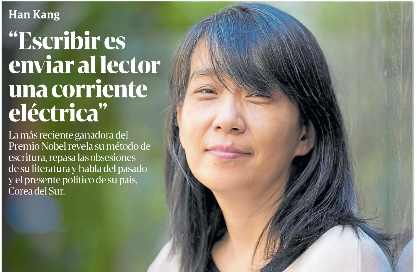
Made in Han Kang. A los 54 años, escribió once novelas (la más reciente es “Imposible decir adiós, de 2021, ya traducida), cuatro libros de cuentos, uno de poesía y dos ensayos.

La más reciente ganadora del Premio Nobel revela su método de escritura, repasa las obsesiones de su literatura y habla del pasado y el presente político de su país, Corea del Sur.