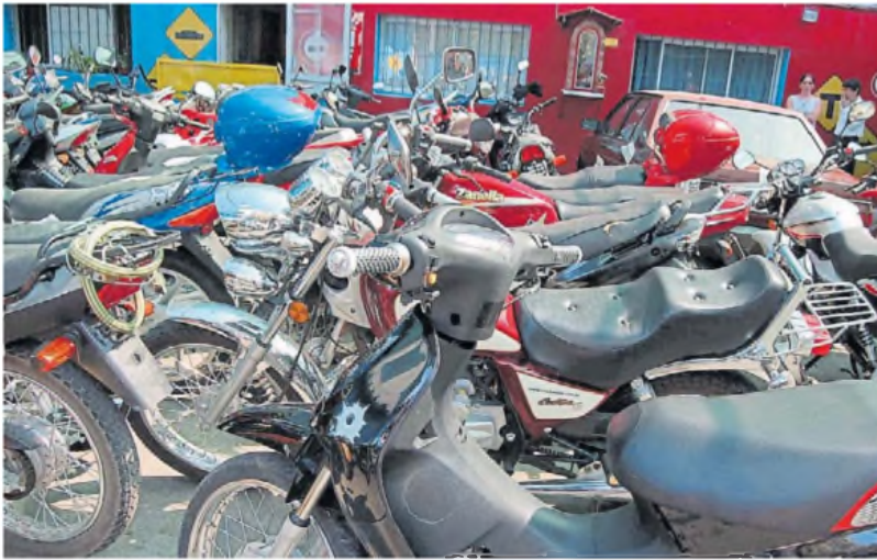
Acumulación. Hay motos secuestradas que no son retiradas porque su dueño no tiene los papeles en regla.