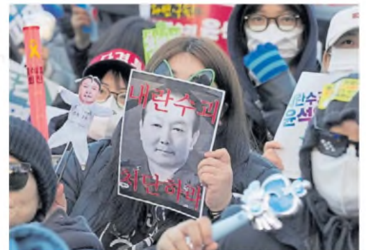
Protestas. El arresto de Yoon disparó marchas en toda Surcorea.

Peró Yoon ha rechazado la acusación de insurrección, diciendo que nunca tuvo la intención de neutralizar el Parlamento o arrestar a los líderes políticos. Las tropas estaban allí para "mantener el orden", según aseguró. ■