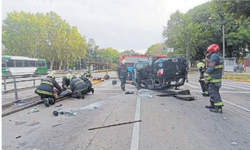
Daños. Los pasajeros salieron solos del vehículo, pero a la que manejaba la tuvieron que sacar.

Por la violencia del impacto, la mayoría sufrió politraumatismos. Por razones que se están peritando, el Chevrolet Spin en el que viajaban los nueve perdió el control,