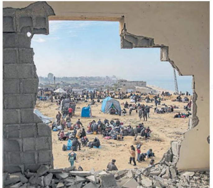
Espera. Familias palestinas aguardan que se abra el paso hacia el norte de Gaza.