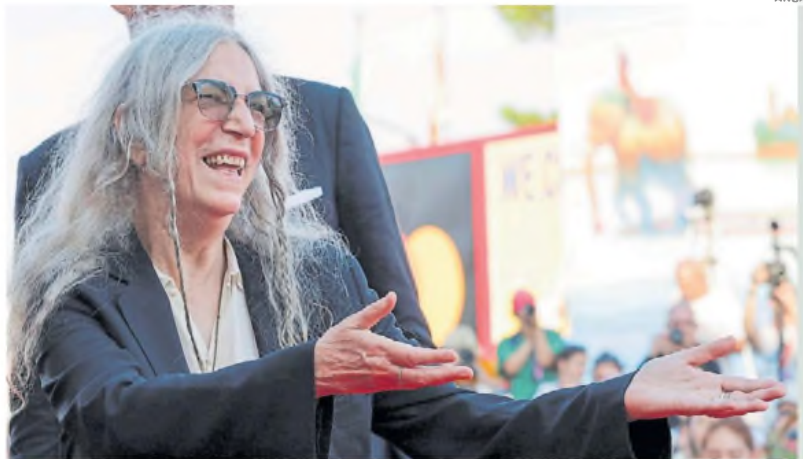
Alegria. La "Madrina del punk" en agosto, cuando asistió al estreno de "Beetlejuice Beetlejuice" en Venecia.

Para Patti Smith, una joven que dejó su hogar en la adolescencia y antes de los 20 dio a luz a un hijo