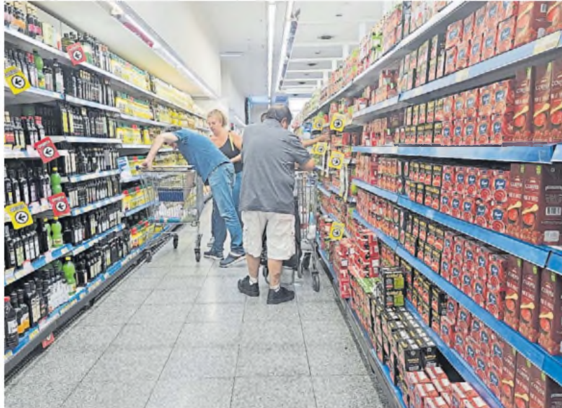
Expectativas cautas. Si bien la caída de ventas se viene acotando, aún no llega la reactivación. C. PROFÉTICO

"Diciembre arrojó una retracción del 18% interanual, confir-