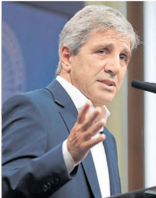
Diálogo. Siguen las conversaciones con el FMI por un nuevo acuerdo.

Las bandas son un mecanismo por el cual el Banco Central se compromete a mantener el tipo de cambio dentro de una franja amplia estableciendo un piso y un techo. Dentro de esa zona, la autoridad monetaria no interviene, mientras que si supera el techo o perfora el piso, el Central tiene manos libres para hacer volver al precio del dólar al interior de las bandas. "Se habla de las bandas de flotación, es un paso intermedio a la