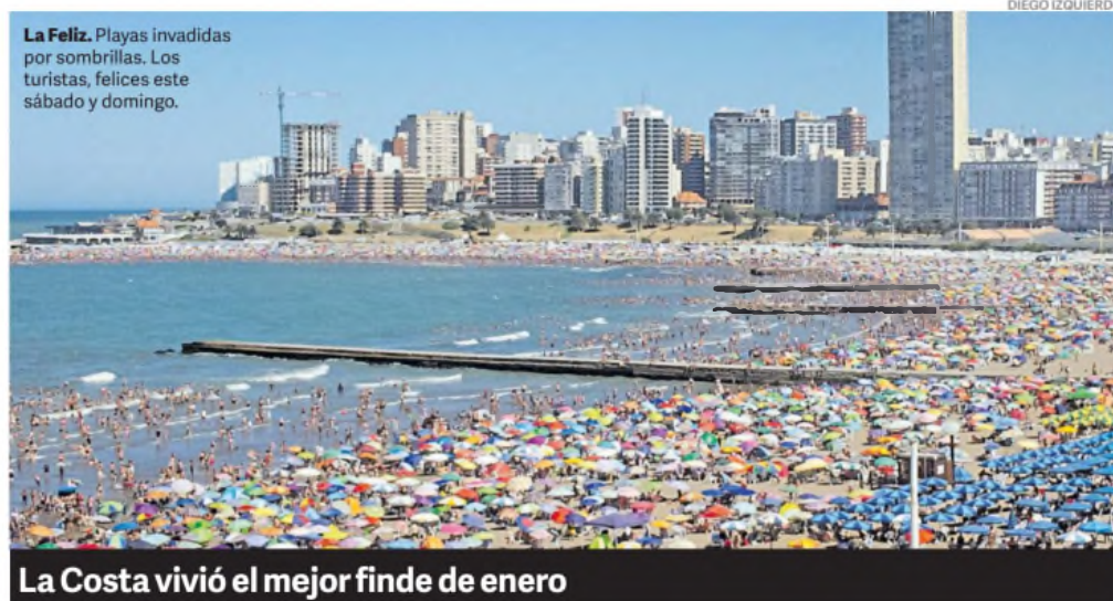
La Feliz. Playas invadidas por sombrillas. Los turistas, felices este sábado y domingo.

Jorge Macri Sacudió al Presidente y pidió que el PRO vaya solo en la Ciudad