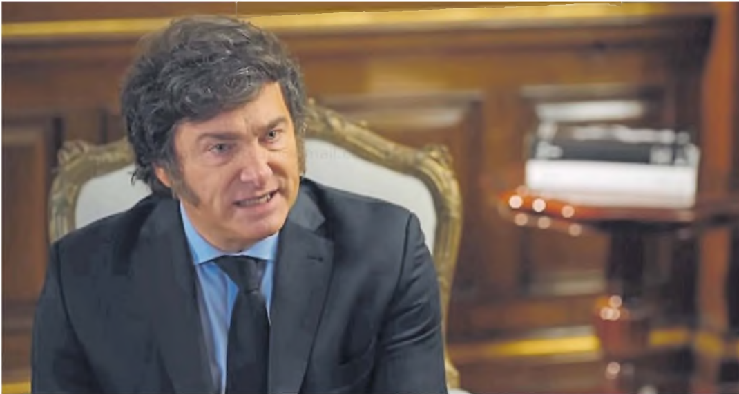
Recargado. Tras las críticas que cosechó, Milei hizo un largo posteo desafiante: "No nos van a torcer la mano. Vamos a seguir acelerando".