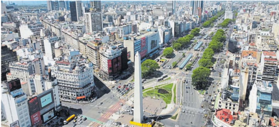
Repunte. En el sector inmobiliario esperan que las ventas se expandan este año de la mano de los préstamos hipotecarios.