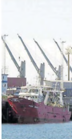
Barcos. Hay 1.000 con permiso.

Por cierto, la captura marítima explica alrededor del 98% de la producción pesquera nacional. En 2024 exportaron por US$ 1.981 millones, 13,1% más pese a que los precios se derrumbaron. La pesca tiene una participación en el complejo exportador de 4,2%. Las tres es-