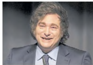
Javier Milei Presidente de la Nación

Macri retoma la actividad esta semana y reunirá a la mesa del PRO para definir una posición sobre el acuerdo electoral con LLA.