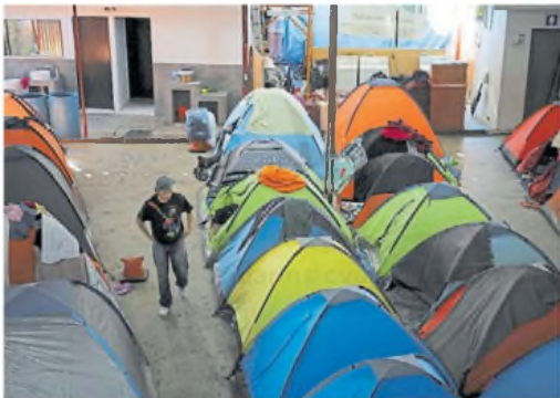
Preparativos. México desplegó carpas para los deportados.

EE.UU. ya envió indocumentados a Guatemala y Brasil. México dijo que los recibirá. Gestiones de Honduras.