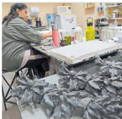
Trabajo. En la Ciudad hay 2.400 monumentos.

En la Ciudad de Buenos Aires hay relevados 2.400 monumentos, entre estatuas, bustos, placas, mástiles, fuentes y monolitos. Fuentes monumentales, como las “mellisitas” que están ubicadas en el cru-