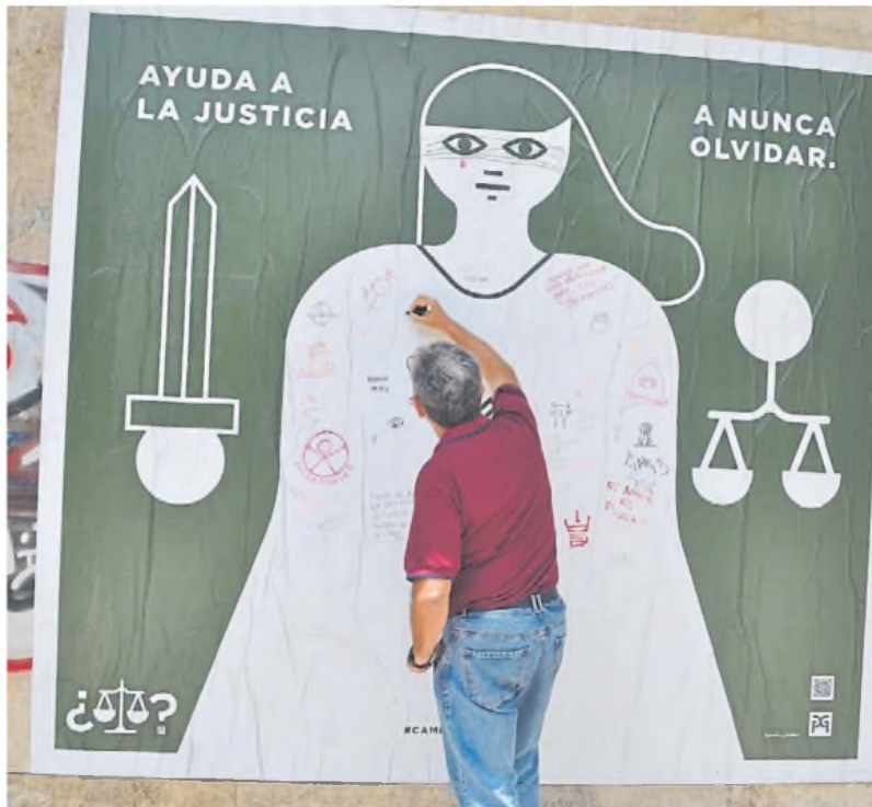
Múltiples chances. La campaña incluyó afiches callejeros y también la posibilidad de votar online.

Al encontrarse frente a una injusticia, el 77% de los encuestados contestó que llama a alguien para que interceda; el 17,9%, busca