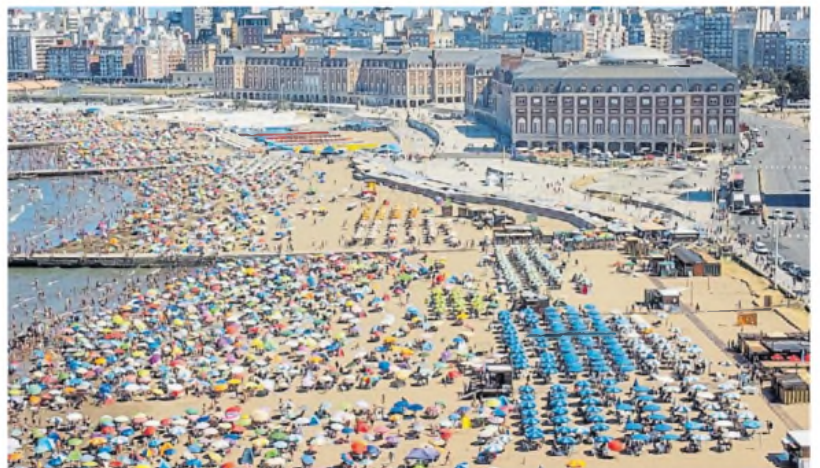
Postal. Durante el último fin de semana de enero Mar del Plata tuvo buen tiempo para la playa.

Según el Ente Municipal de Turismo marplatense, en la primera quincena de 2025 la ciudad había recibido a unos 650.000 turistas. Esta cifra significa un 3,5% menos que en 2024, aunque durante este año la Costa argentina tiene mayor competencia de Brasil. ■