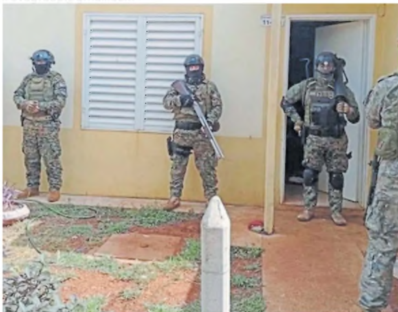
Operativo. Intervinieron agentes especiales para lograr rescatar a la mujer secuestrada por su ex pareja.

Con la información aportada por la familia, los investigadores pudieron establecer que el sospechoso tenía una perimetral que había dis-