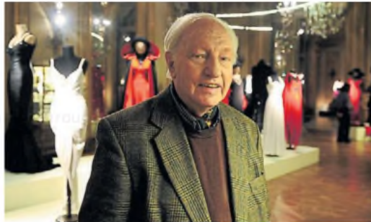
Institución. Tenía 93 años y trabajaba en películas desde los 21.

Desde entonces, trabajó en más de cien producciones cinematográficas, incluyendo clásicos como La calle del pecado , Los muchachos de antes no usaban gomina , La son-