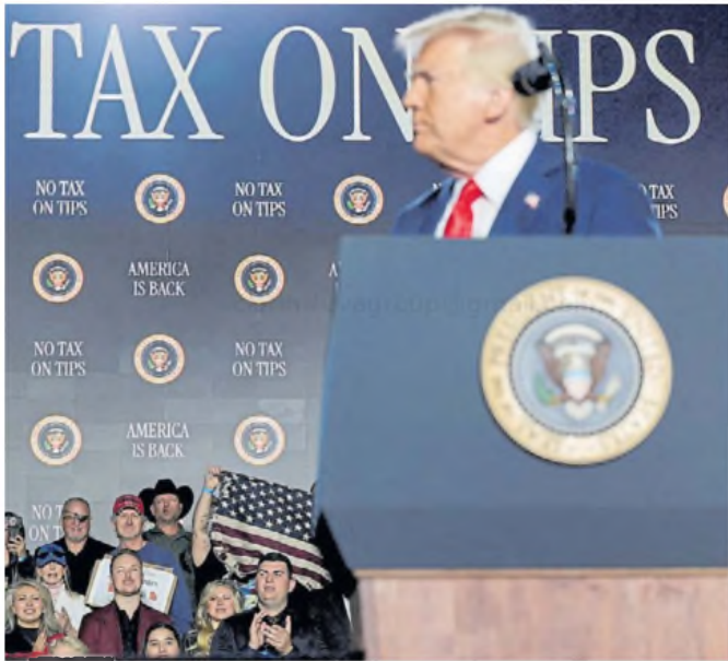
Oferta. La propuesta de Trump sobre los palestinos fue rechazada por los aliados árabes.