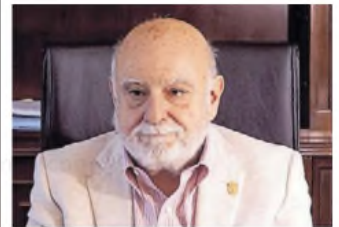
Rodolfo Barra Ex Procurador

El diputado forzó al Gobierno a trasladar al Congreso la discusión por el temario de sesiones extraordinarias.