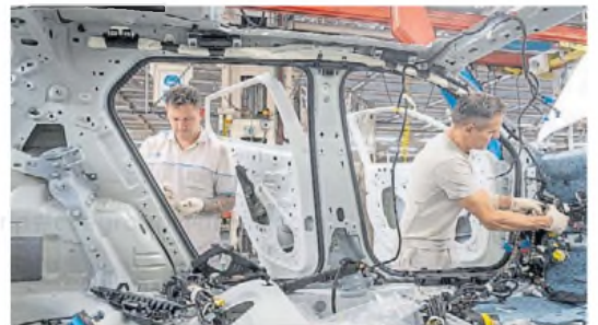
Rebote. Las automotrices volvieron a crecer en diciembre.

Con una expansión de 1,5% interanual, la producción de maqui-