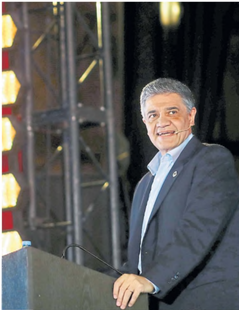
Definiciones. Jorge Macri dijo que en la Ciudad el respeto a la diversidad es una "conquista social".

"Es una injusticia brutal", fustigó a Milei quien vinculó a los gays con el abuso infantil. Sobre las legislativas, consideró que no es momento de hacer alianza con LLA.