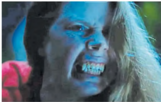
Boquita. Amy Adams y una interpretación jugada como Madre, a secas.

Esta mujer anónima resuelve, por decisión propia -nadie se lo sugiere ni pide-, pausar su carrera artística para vivir, descubrir la existencia y experiencia como madre