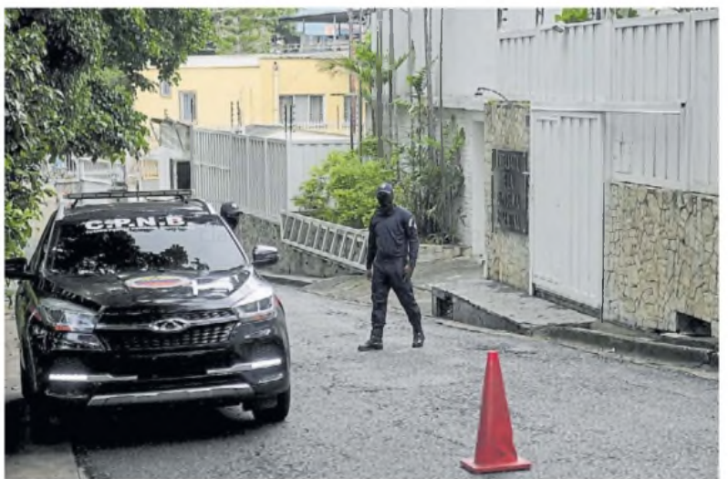
Vigilancia. El frente del edificio de la embajada Argentina en Venezuela con policías del régimen.