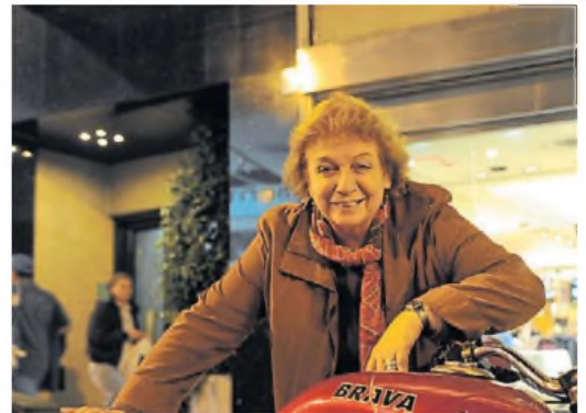
Querida. Dejó huella en “Esperando la carroza” y “La historia oficial”.

La AAA recordó que tuvo una destacada participación en nuestro cine nacional, en películas como La historia oficial , Camila , No toquen a la nena , Señora de nadie , El caso María Soledad , Hermanas , Tiempo de revancha , Yo, la peor de todas , Flop , La parte del león , O Yo nena , yo princesa .