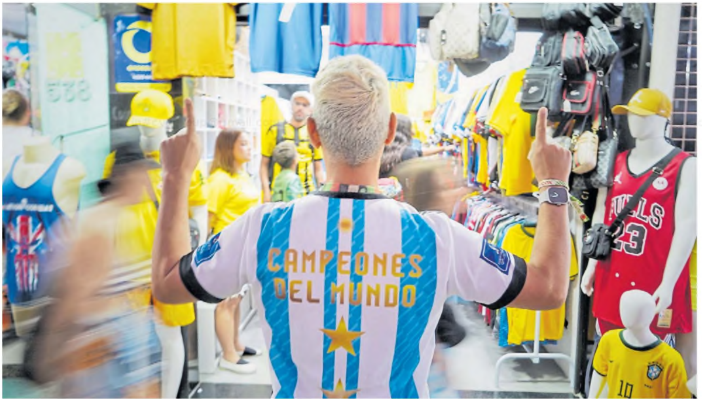
Dinero. Los turistas gastan un 37% más respecto al mismo período de 2024. Vestimenta y calzado son rubros con precios convenientes para los argentinos.