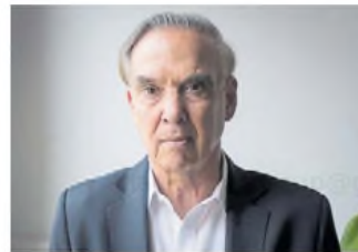
Miguel Pichetto Diputado nacional por Encuentro Federal

Sin un entendimiento con el PRO, Milei tiene dificultades para que su fuerza pueda crecer en las próximas elecciones.