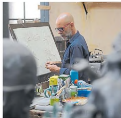
Detalles. En el MOA trabajan artesanos y orfebres.

ce de Córdoba y 9 de Julio; pequeñas, como la de Plaza Maipú, frente al Palacio San Martín; históricas, como la de la Plaza Congreso.