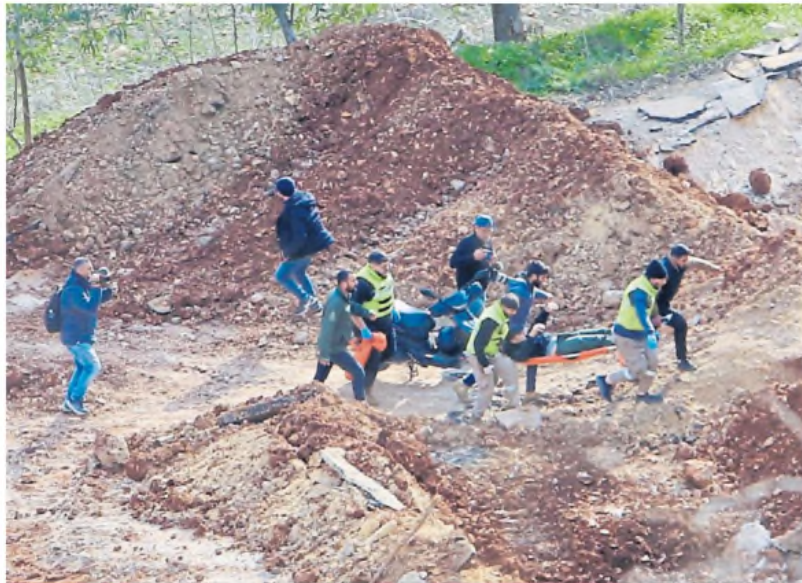
Choque. Un grupo de libaneses transportan camillas con heridos tras un nuevo ataque en la zona.

El presidente libanés, Joseph Aoun, instó a la población a mantener la "sangre fría" y confiar en