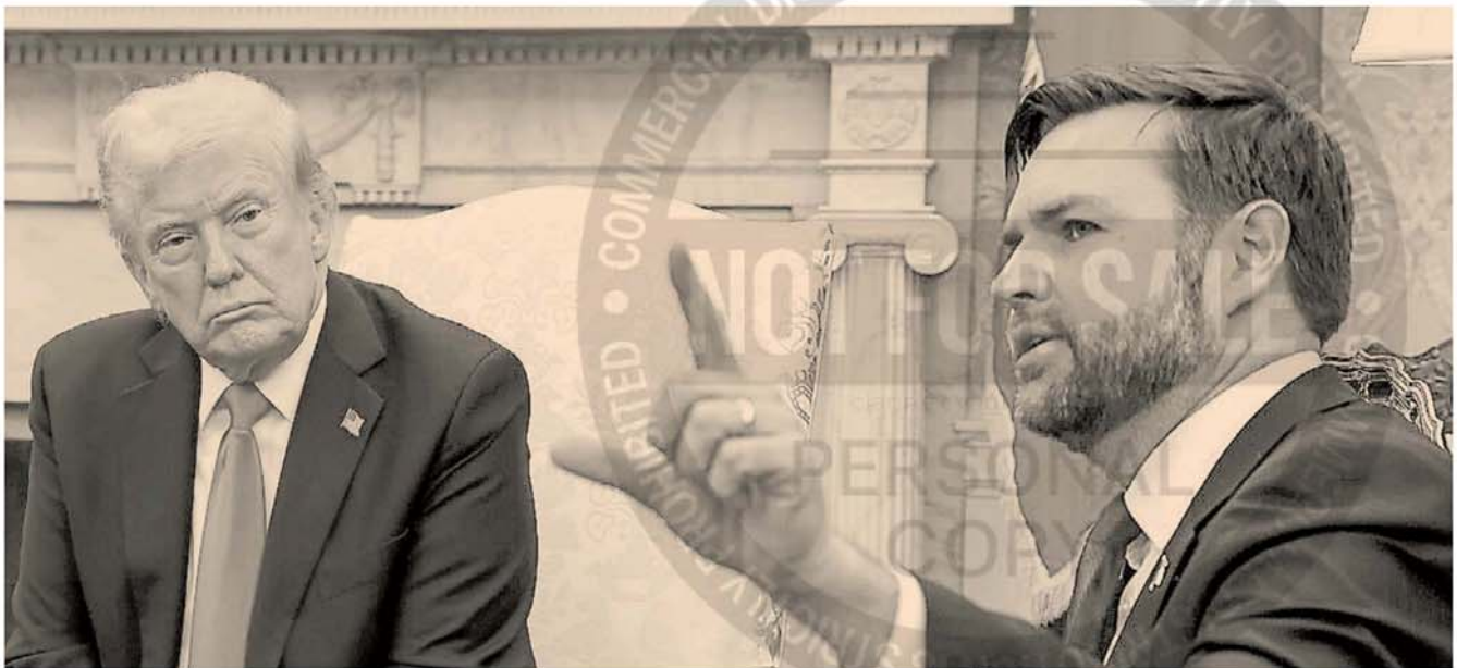
Un peligro. JD Vance, aún peor que su presidente, Donald Trump. Es un fanático, un hombre convencido. Y los políticos convencidos son los más peligrosos que hay.

Su consigna es "Make America Great Again", MAGA, hacer que Estados Unidos vuelva a ser grande. La consigna europea hoy es MEGA, "Make Europe Great Again". Militarmente. No nos queda más remedio. Aunque el precio sea una calidad de vida más chiquita. ■