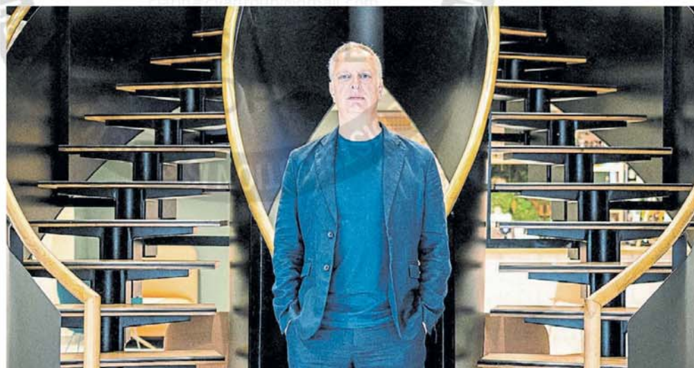
Amenaza. “El peligro real para las democracias liberales es actualmente el populismo soberanista”, sostiene Scurati.