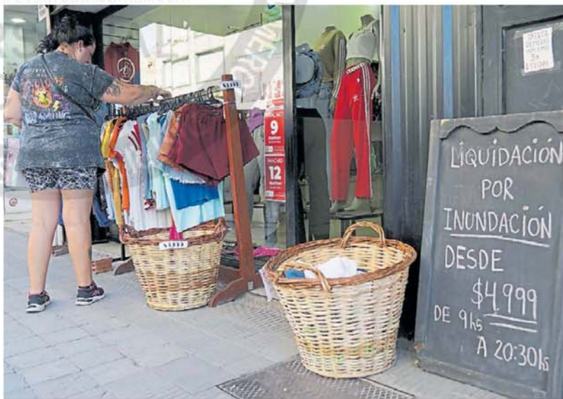
Feria en la calle Alsina. Mercadería "al costo y menos", marcan.

menos en pie necesitan rearmar. "Secando", dicen los percheros de Maíz, cerca de la municipalidad, "Ropa Inundada", ofrece un local al frente de la Galería Florida. Abundan los carteles de descuento de "50% efectivo, 35% transferencia".