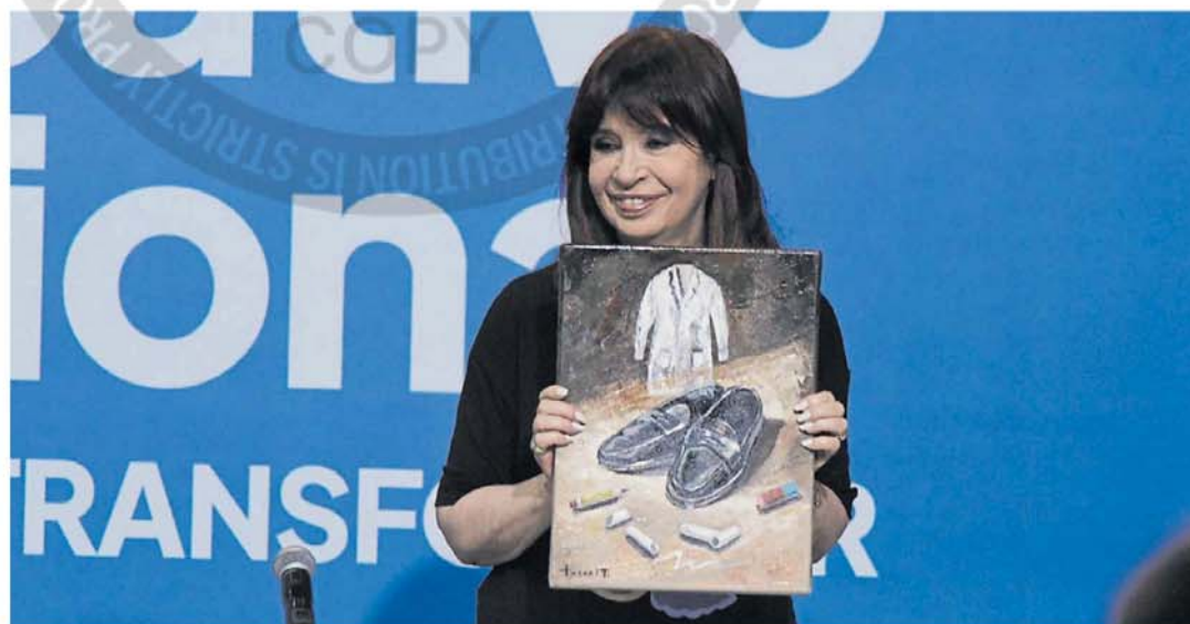
Risas. Cristina Kirchner muestra un cuadro ayer en la charla que dio en la Facultad de Ciencias Sociales de la UBA.

Dijo que "le dieron un cheque en blanco" al Presidente y criticó a Donald Trump y Marco Rubio por la sanción que le impusieron por corrupción.