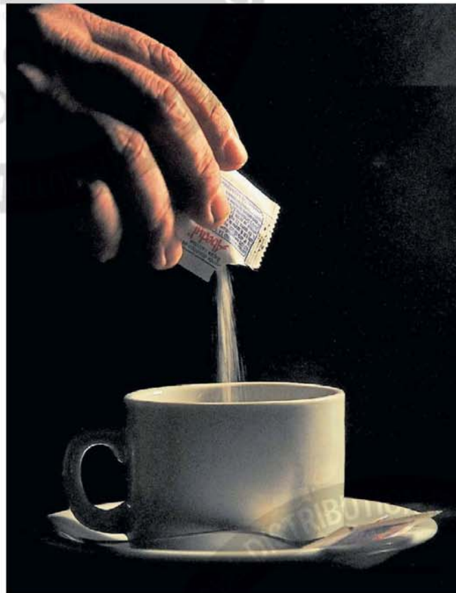
Se utilizan hace más de un siglo. Todos los edulcorantes son seguros, según estudios.

Por eso, la aprobación de un aditivo alimentario está basada no sólo en los estudios que demuestran su seguridad, sino también en las evaluaciones que determinan que no producen ningún efecto adverso .