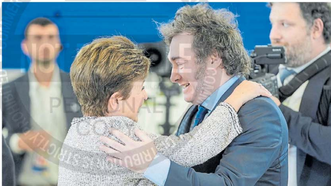
Desafío. Javier Milei y Kristalina Georgieva buscan poner un punto y aparte a la relación histórica entre la Argentina y el FMI.