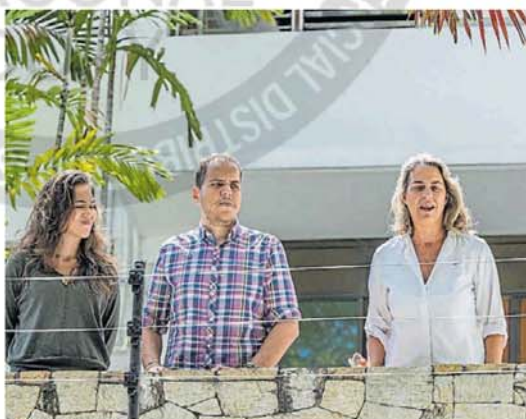
Atrapados. Tres de los opositores asilados en la Embajada argentina.

El chavismo suele utilizar con insistencia la narrativa de supues-