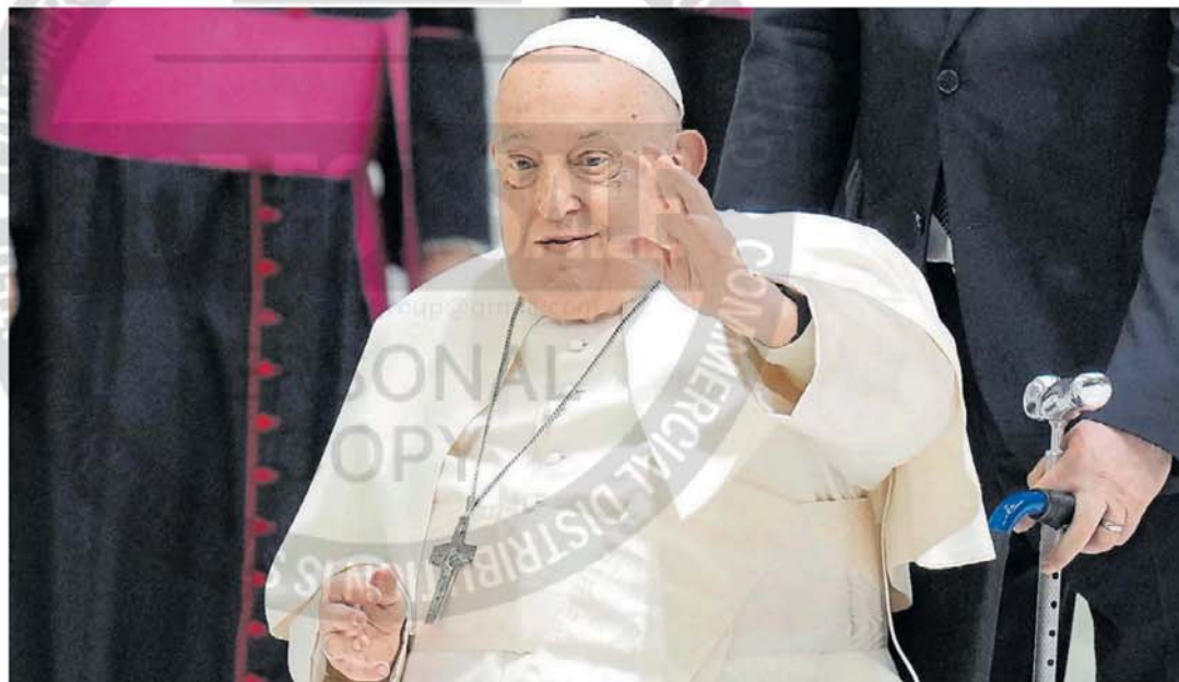
Recuperado. Pese a lo difícil del cuadro, el Papa en ningún momento perdió el conocimiento, y estaba alerta y cooperativo, se indicó.