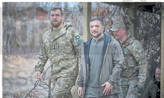
En acción. El presidente Zelenski en una visita a un área del frente.