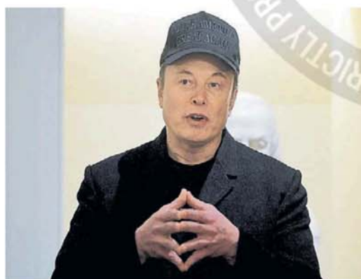
Problemas. El polémico asesor de Trump, el billonario Elon Musk.

Era una institución venerada, a la que un editorial del Wall Street