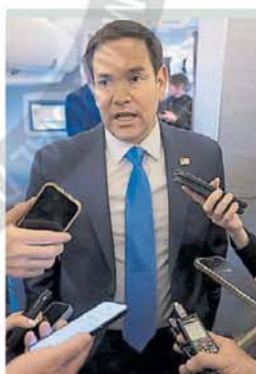
Canciller de Trump. Marco Rubio

presentó una enmienda para que Washington vote en contra de los préstamos para Argentina en el BID y en el Banco Mundial . El argumento fueron los incumplimientos de Argentina en el plano internacional, otra crítica a la gestión de Cristina Kirchner.