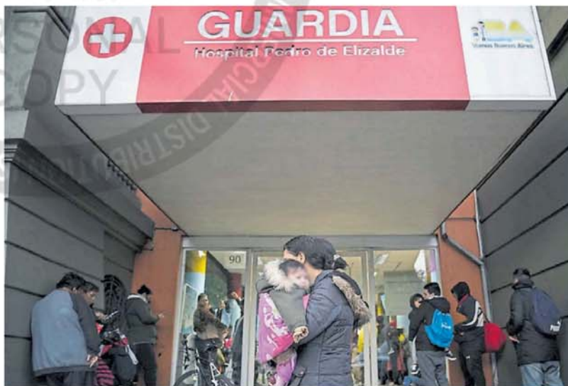
Protección. El Virus Sincicial Respiratorio causa un tercio de las muertes de bebés en el primer año de vida.

Su impacto es alto: es responsable de un tercio de las muertes en el primer año de vida y el 97% de esos casos ocurren en países de bajos y medianos ingresos. El documento suma: entre uno y cuatro de cada 100 lactantes sanos tiene riesgo de terminar internado por el VSR en sus primeros dos años. El riesgo es mayor para los prematuros (4,3%) y para los bebés con cardiopatías o