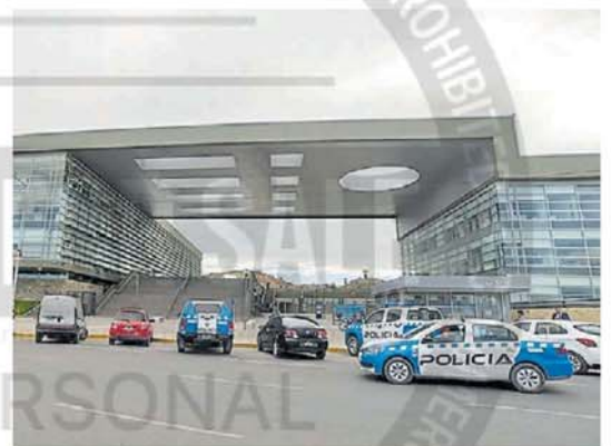
Tribunales. La Justicia lo condenó por intento de femicidio.