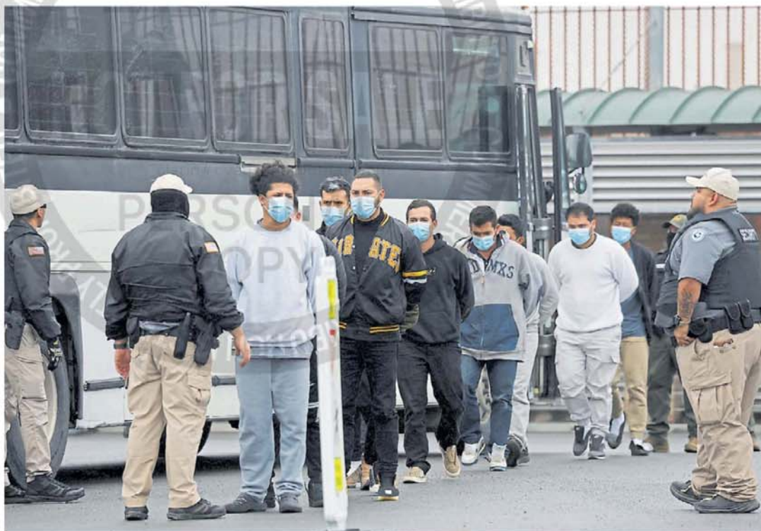
Deportados. Un grupo de migrantes supuestamente sin papeles, aparecen con esposas en una zona de Texas, camino a ser deportados.