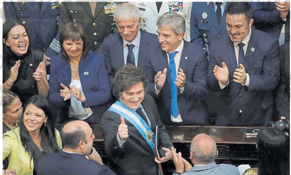
Caída. La inversión recuperó en el cuarto trimestre, pero en el año cerró con una caída anual de 17,4%.

Para que se entienda mejor, números de la Oficina de Presupuesto del Congreso, un organismo técnico integrado por especialistas independiente, informan que en 2024 los gastos de capital, o sea, la plata que el Gobier-