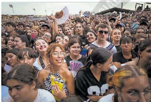
Amenaza de lluvia y calor. Apretados, ayer, los fans en el Lollapalooza.

La convocatoria, sin embargo, fue más lenta y recién hacia las 18-19 horas había una buena cantidad de espectadores, atraídos por el show de Wos y especialmente por la dupla pop de Tate McRae y Shawn Mendes en el escenario principal, y el toque metálico de