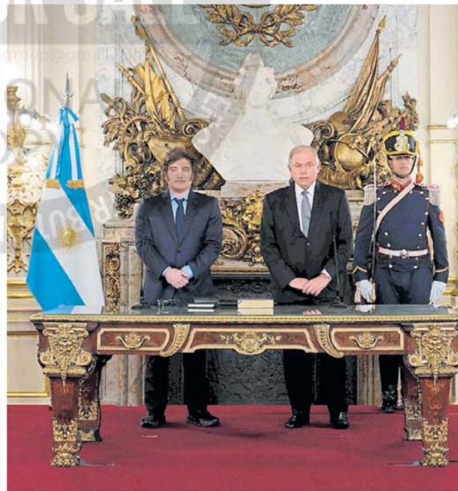
Casa Rosada. El Presidente Javier Milei y el canciller Gerardo Werthein.

Milei asoció aquel encuentro del lunes con la noticia que llegó desde Estados Unidos el viernes a la noche, en las puertas del fin de semana. Cree que los planetas comienzan a alinearse para un triunfo sobre Cristina Kirchner y Axel Kilicoff en el prin-