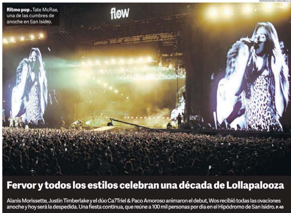
Ritmo pop. Tate McRae, una de las cumbres de anoche en San Isidro.

Según la Justicia, el ex senador -que sigue detenido en Paraguay- organizó una estructura de firmas sin existencia real, desde hace una década cuando era funcionario en Entre Ríos. Compraba departamentos y autos de alta gama. Un fiscal pidió la detención de siete colaboradores y testaferros de Kueider. P.14