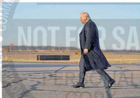
Desafíos. El presidente norteamericano Donald Trump y los sondeos.