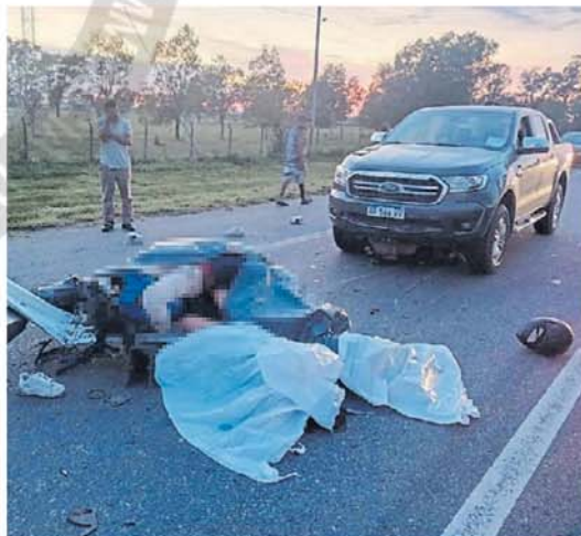
Horror. La camioneta Ford Ranger arrolló a una de las víctimas.

las autoridades, se trata de un hombre y tres mujeres que murieron antes de que llegaran los médicos a realizar las tareas de auxilio.