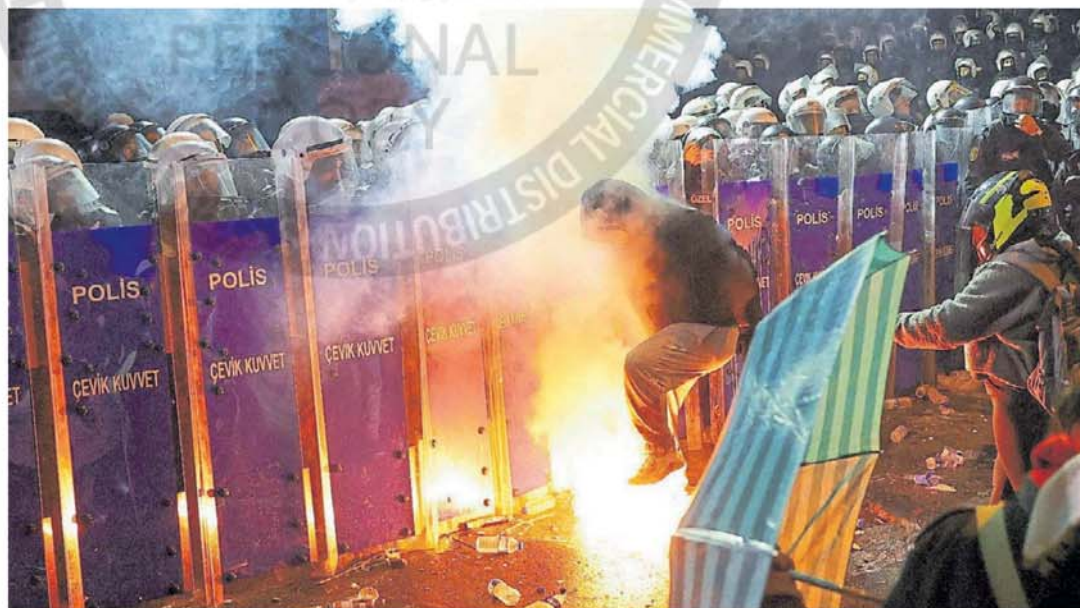
Repudio. Hay violentas manifestaciones incluso en provincias que son bastiones del oficialismo por la polémica acción contra el alcalde.