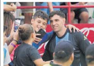
Sintonía. Dibu, en el alma de la gente.

Alanis Morissette, Justin Timberlake y el dúo Ca7Triel & Paco Amoroso animaron el debut, vos recibí todas las ovaciones anoche y hoy será la despedida. Una fiesta continua, que reúne a 100 mil personas por día en el Hipódromo de San Isidro. P.40