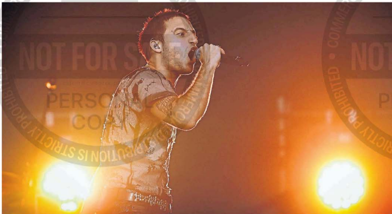
Potencia. Wos hizo saltar a su público una y otra vez, anoche, en uno de los escenarios montados en el Hipódromo de San Isidro.

Ante una multitud, cantó temas de toda su discografía. El público disfrutó una maratón de shows de varios estilos, desde electrónica hasta heavy metal.