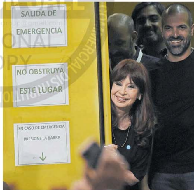
Ex presidente. Desde hace años las agencias de EE.UU. la investigan por la plata negra.

El propio Lázaro Báez también utilizó en-