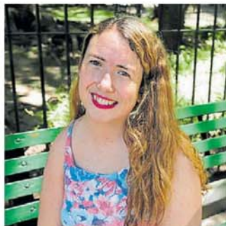
En 2021. Antes de ser madre, con Clarín.

una discapacidad" y que las personas con discapacidad "no necesitamos cura, sino aceptación y oportunidades".