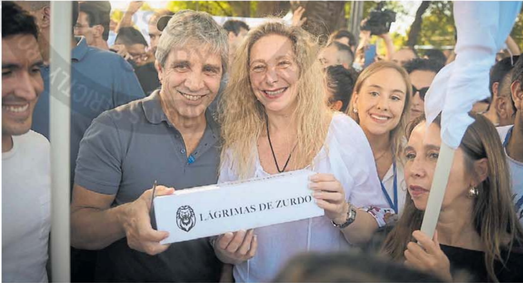
En la calle. Luis Caputo y Karina Milei, el fin de semana pasado, durante una campaña de afiliación en la Ciudad de Buenos Aires.