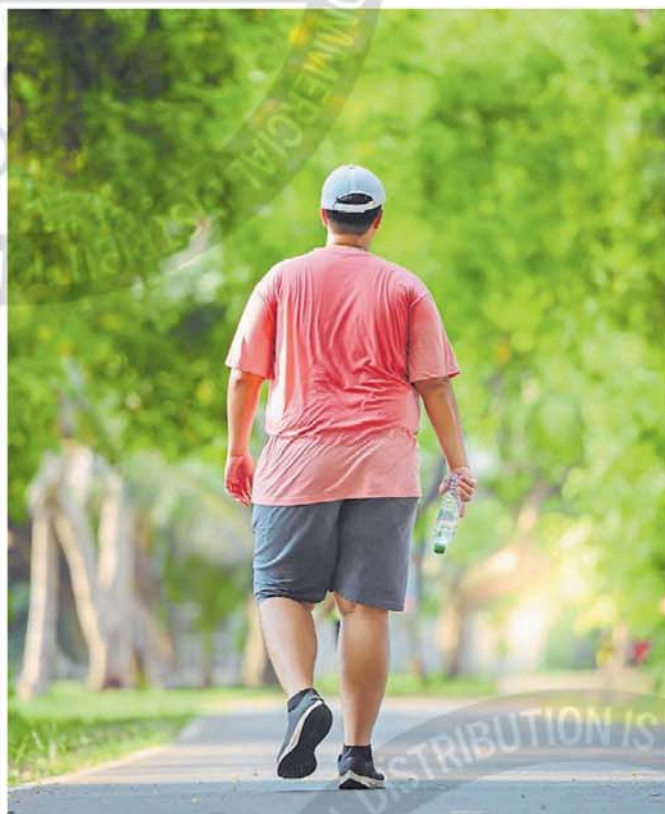
Problema global. Se estima que unas mil millones de personas viven con obesidad.

La obesidad clínica, a diferencia de la preclínica, no requiere la presencia de otra en-