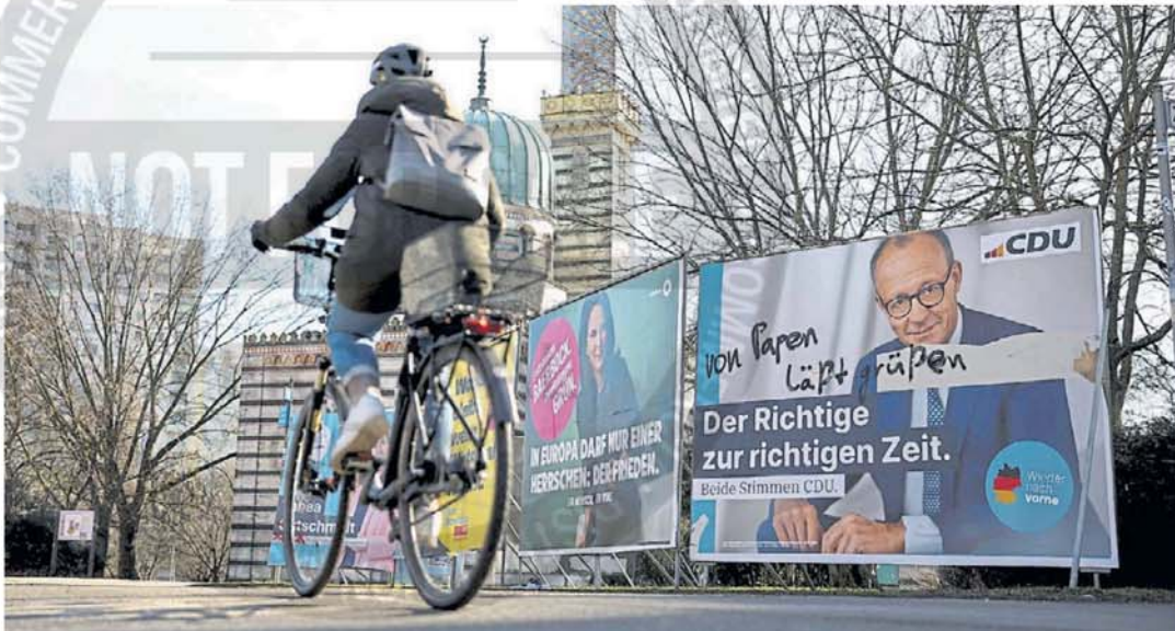
Carteles. Imágenes de algunos de los candidatos a jefe de gobierno de Alemania, en una calle de Potsdam, antes de unos comicios clave.