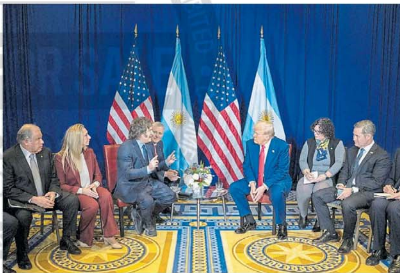
Comitivas. Milei fue al encuentro con Trump acompañado por Werthein, su hermana y Luis Caputo.

bado en la Casa Blanca, le arrancó la promesa a Trump de que será recibido allí pronto, lo que significa un gesto aún mayor. Milei ve a Estados Unidos como el socio más importante de Argentina y tiene enorme sintonía con el de Trump. Incluso