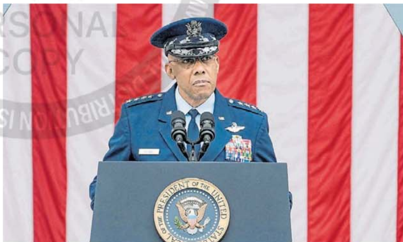
Despedido. El general Charles Brown, el segundo hombre negro en encabezar el Estado Mayor Conjunto.

Hegseth no dijo por qué estaba despidiendo a los abogados. Pero en su audiencia de confirmación en el Senado el mes pasado, criticó de modo críptico a los letrados mi-