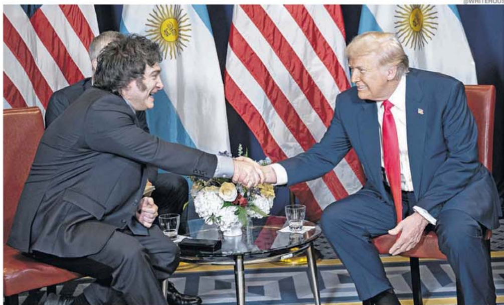
Sintonía. Milei se reunió por tercera vez en los últimos meses con Trump. Este viene de alamar a Europa por sus elogios a Putin.