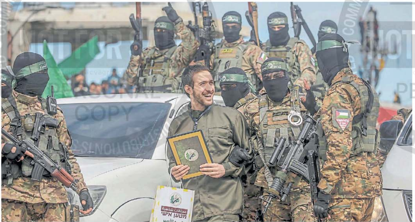
Escena. Los terroristas de Hamas, con capuchas y armas, entregan a uno de los israelíes que mantenían cautivos en Gaza. Fue la séptima liberación de rehenes en esta tregua.