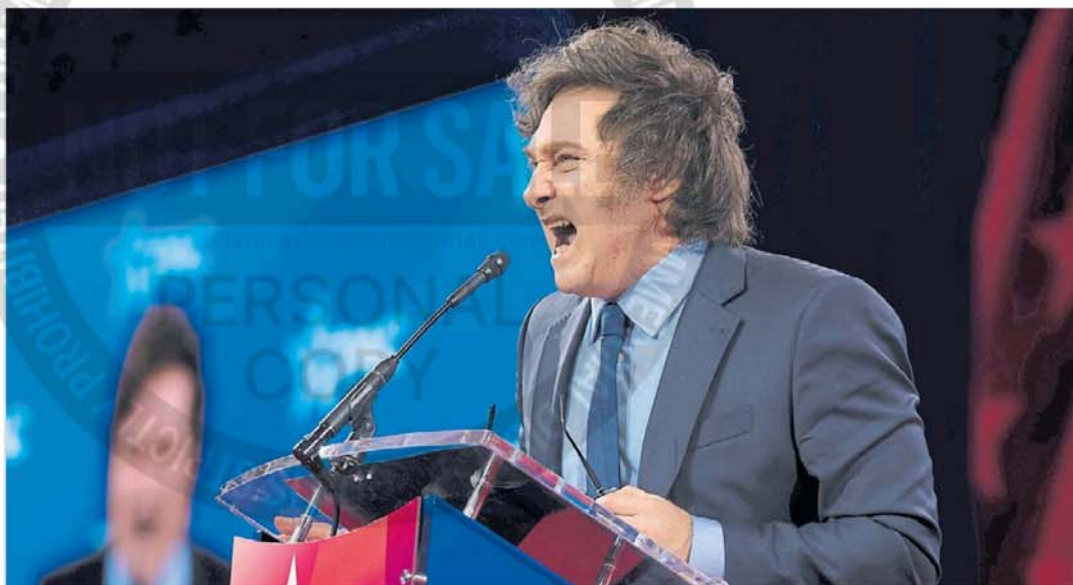
Discurso. Milei se comparó con Trump y aseguró: "Estamos dando una batalla crucial para el futuro de la Humanidad".