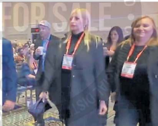
Pareja. Yuyito con Milei, durante el discurso ante la CPAC.

Es la primera vez que Yuyito se suma a un viaje de Milei a Estados Unidos. Viajó para acompañar al presidente en su discurso y también ante la posibilidad de conocer en persona a Trump. Luego que Milei se bajara del escenario y abandonara la sala, la conductora devolvió las gentilezas públicas a su novio con una historia de Ig. ■