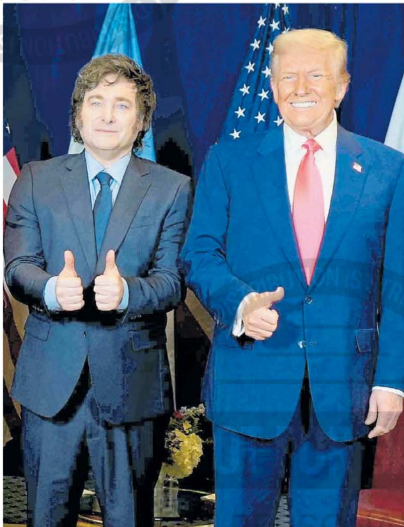
Aliados y en sintonía. Milei y Trump, ayer, cuando se mostraron juntos en la cumbre conservadora.

No tuvieron demasiado tiempo, menos de 15 minutos. La reunión comenzó instantes después de que Trump descendiera del estrado donde había dado su discurso, a las 4:58, según tuiteó el portavoz Manuel Adorni. Y a las 5:12 Trump ya estaba en la camioneta oficial rum-