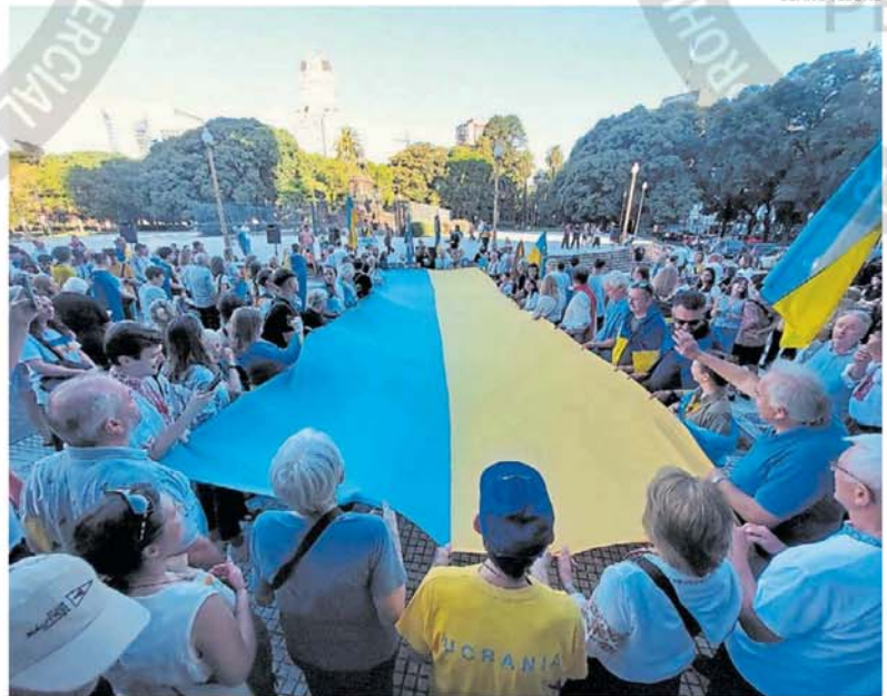
Acto. La comunidad ucraniana en Buenos Aires, ayer en Plaza San Martín por el aniversario de la guerra.

-Seguimos luchando, los invasores rusos no lograron capturar Kiev. En 2023 y 2024 Ucrania logró romper el bloqueo marítimo ruso en el Mar Negro y aseguró el