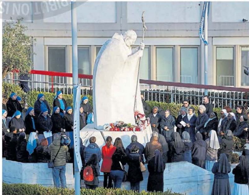
Oraciones. La gente reza frente a la clínica Gemelli donde se encuentra hospitalizado el Papa Francisco.

Los médicos señalan un estado grave y reiteraron que no está fuera de peligro. Preocupa el riesgo de una infección generalizada. Sin embargo, responde al tratamiento.