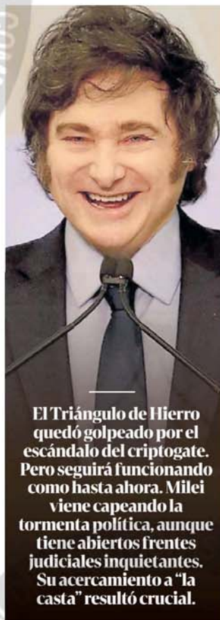
Javier Milei. Presidente de la Nación.

El Gobierno supo recurrir a otras jugadas de distracción. El Presidente reflejó las bondades de su política económica subrayando la nueva baja inflacionaria de enero. Dato viejo. También, como nunca, embistió contra Cristina Fernández por sus causas de corrupción. La ex presidenta toreó pese a su maltrecha autoridad moral. Los libertarios siguen pensando que la polarización con la dama podría beneficiarlos en términos elec-