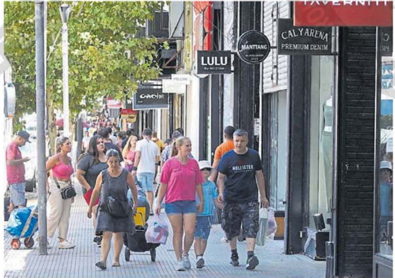
En foco. Avellaneda, sin puestos callejeros. Habían denunciado que no se podía caminar. RODRÍGUEZ ADAMI

Sin embargo, la mayoría de los vendedores entrevistados por Cla-