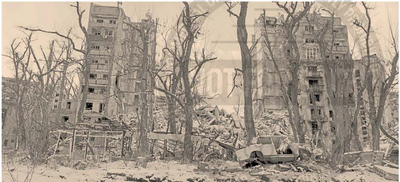
Resistencia. Se cumplen tres años de la brutal invasión rusa, ordenada por Putin. Y aunque, insólitamente, Trump ahora lo avala, el pueblo y los soldados ucranianos van a resistir.

He recorrido Ucrania dos veces desde el comienzo de la invasión de 2022 y sé que a lo que más aspiran los ucranianos, la enorme mayoría de ellos, es formar parte de la UE para así salir de una vez y por todas de la siniestra órbita rusa. Bueno, "de por todas" dependerá de una cosa más. De que Europa ponga tropas en suelo ucraniano para disuadir a los rusos de lanzarse a otra aventura imperial más. A ver. A ver si iniciamos la tarea de enderezar este mundo al revés ofreciéndoles membresía del club europeo y enviándoles soldados, si los quieren. Sin miedo, carajo. ■