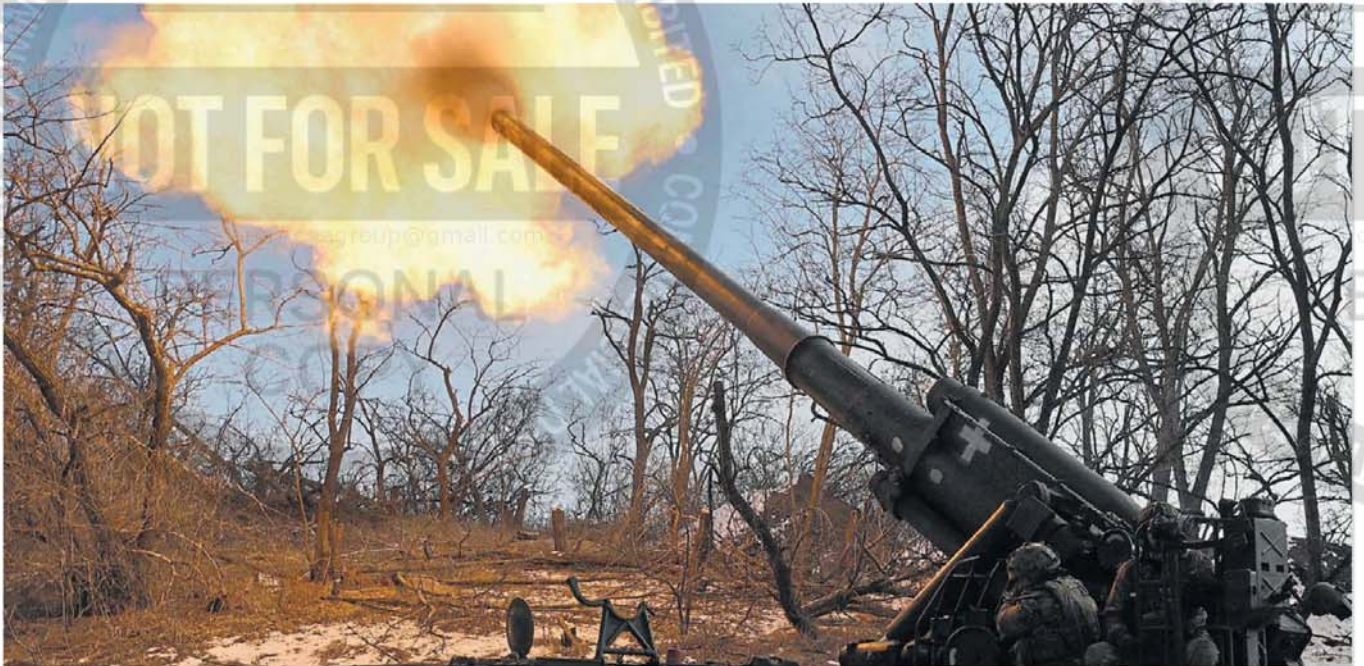
Guerra. Una base de artillería de la 43 Brigada de Ucrania con todo su equipo dispara contra posiciones de los invasores rusos en el frente de guerra en la región de Donetsk.