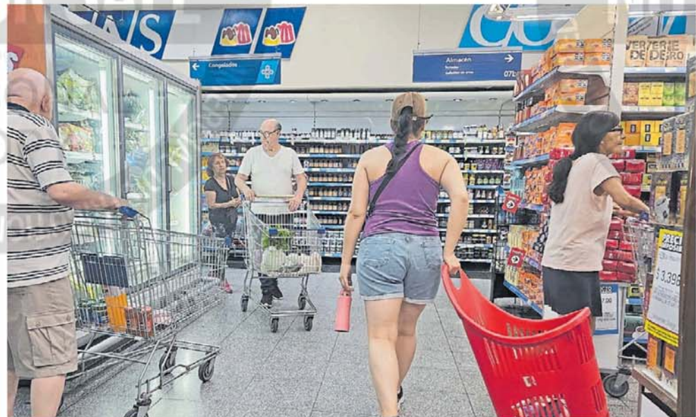
Desafío. Resultará clave en los próximos meses mantener los índices de precios a raya después del escándalo cripto.

Existen otras herramientas para describir los resultados de la competencia entre precios y salarios, pero aquí ya tenemos varios que contradicen el argumento oficial donde los sueldos vencen siempre a la inflación. Hay entre ellos un caso en el que