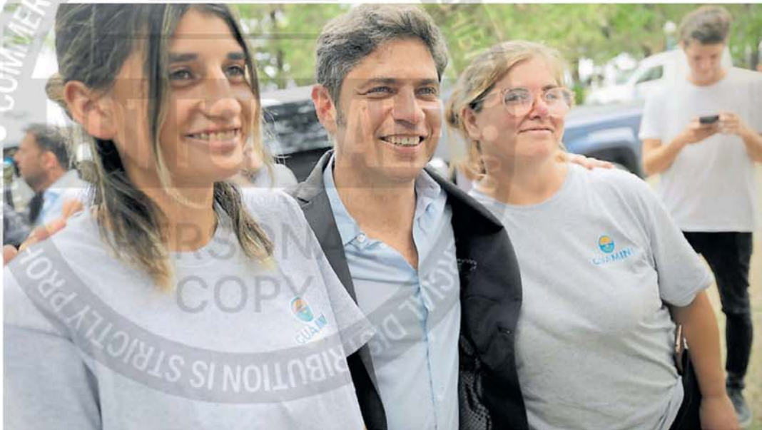
Autonomía. Axel Kicillof, en un encuentro con militantes. El gobernador busca un espacio propio pensando en las legislativas y el 2027.