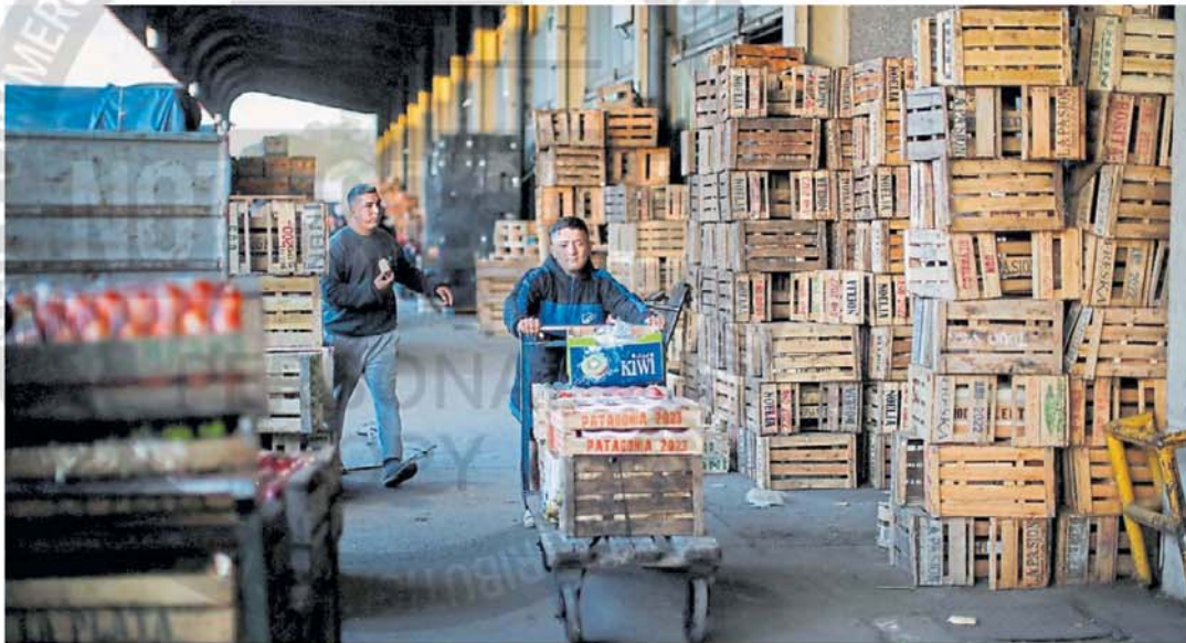
Modelos. Hace unos años había más formalidad en el mercado de empleo y la pobreza subía. Hoy esta última cae y la precarización crece.

La reducción de la inflación es un factor clave para explicar el “choque” entre la pobreza y empleo. Cómo juegan los roles de la precarización y la AUH.