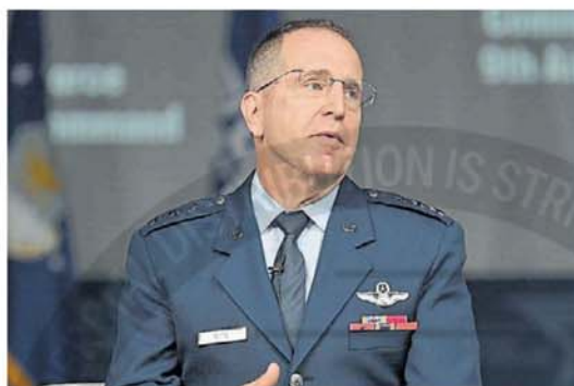
Relevo. El general Dan Caine, un oficial de la Fuerza Aérea retirado.

Fue un cambio significativo para Trump con respecto a 2020, cuando nominó a Brown como jefe de personal de la Fuerza Aérea. En ese momento, el presidente des-