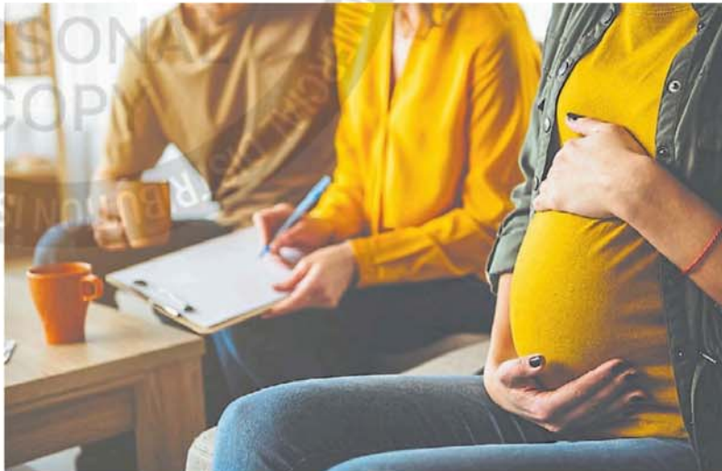
Sin regular. Hay proyectos de ley sobre subrogación de vientre en el Congreso pero ninguno fue tratado.