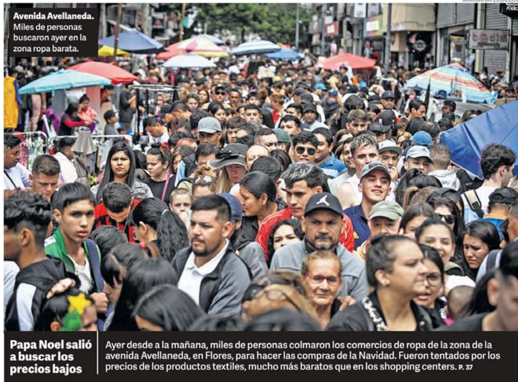
Avenida Avellaneda. Miles de personas buscaron ayer en la zona ropa barata.