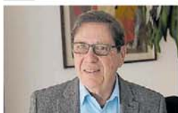
Miguel Kiguel Economista - Econviews

"Podemos esperar que entre 2025 y 2026 entre plata fresca adicional por entre US$ 10.000 a US$ 12.000 millones. Tener más reservas y un programa con el FMI ayuda a salir del cepo y generar más confianza, pero eso no quiere decir que apenas llegue el dinero la Argentina levante sus controles