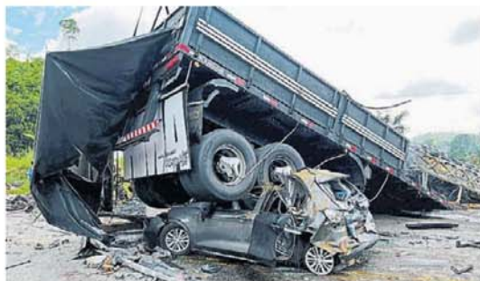
El camión. Debajo el automóvil, cuyos tres ocupantes están graves.

A fines de noviembre, otro grave accidente de ómnibus en el estado de Alagoas (noreste) dejó 17 muertos al precipitarse por un barranco, mientras circulaba por una remota carretera de montaña. ■