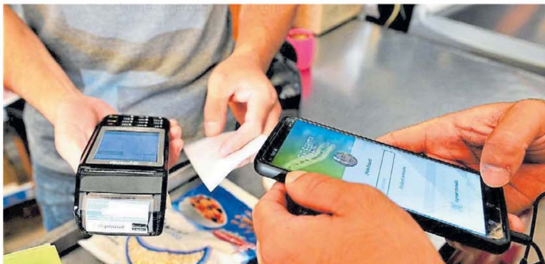
Inversiones. Las principales empresas, cada vez más volcadas en las nuevas tecnologías y procurando mayor seguridad de las billeteras virtuales.

Según un trabajo elaborado por la Universidad Tecnológica Nacional, las aplicaciones mejor rankeadas son las de Mercado Pago, Modo y Naranja X.