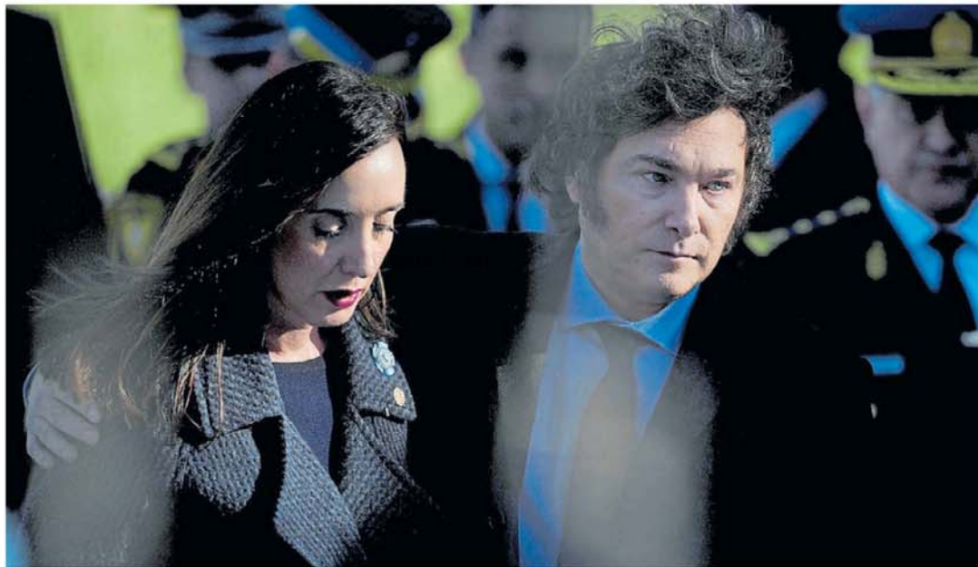
Otros tiempos. Victoria Villarruel y Javier Milei abrazados cuando la relación no pasaba por el actual momento de tensión.