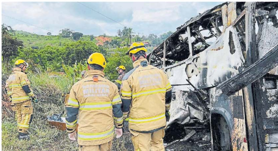
Desastre. Los restos quemados del autobús es inspeccionado por los bomberos que dirigieron la tarea de recuperación de los cuerpos.