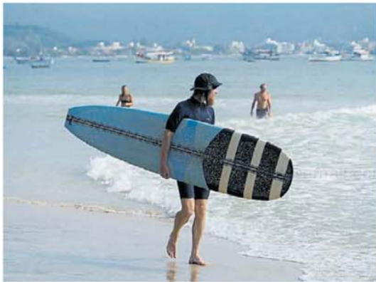
Surf. Hacia el sur, Florianópolis ofrece playas con olas. ANDRÉS D'ELIA

años, la balanza se está inclinando para los vuelos. Hoy clase media puede acceder tranquilamente a un aéreo, pero ya quedan muy muy pocos a buen precio. La gente compró en septiembre", explica a Clarín Javier Gordillo, promotor argentino de la agencia viajes de Florianópolis Cbersail Brasil.