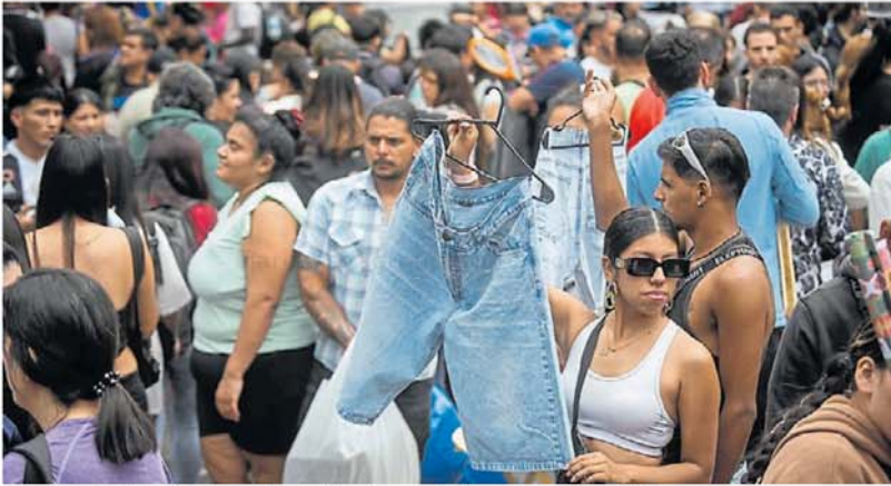
Mar de gente. Una vista de avenida Avellaneda y alrededores, ayer por la mañana.