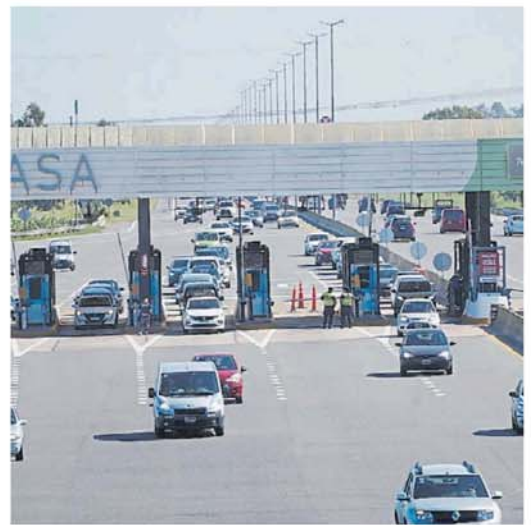
Filas. Se espera la circulación de miles de autos para las Fiestas.

La resolución 1319/2024 del Ministerio de Infraestructura se co-