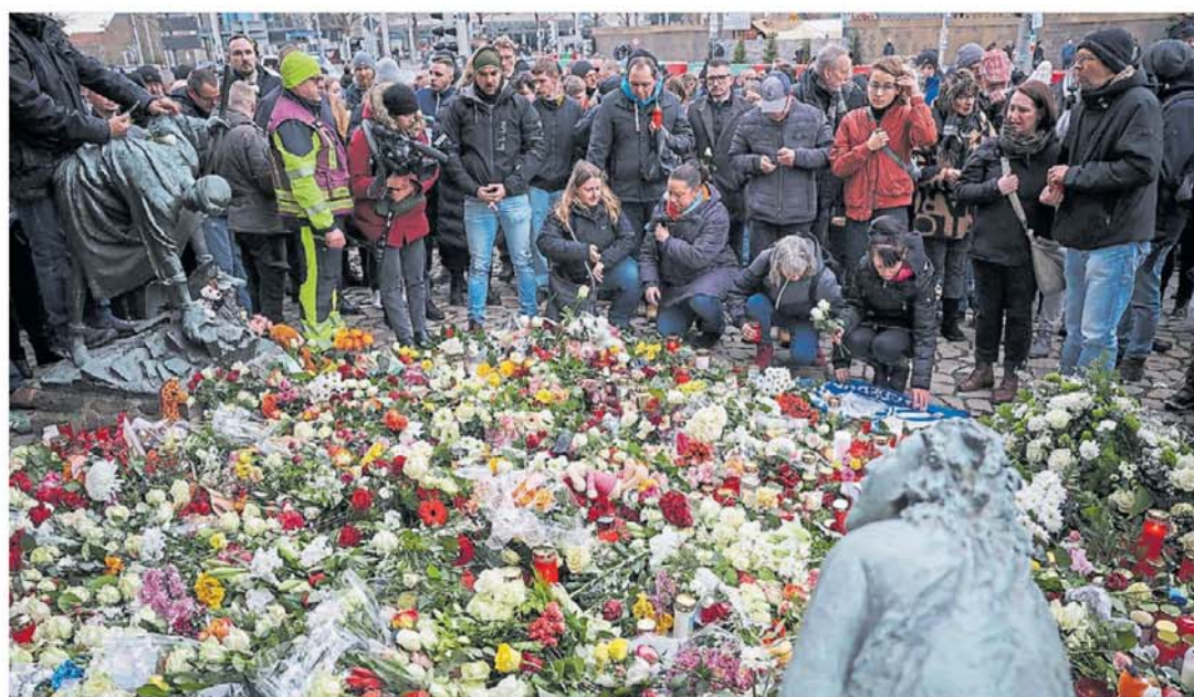
Duelo. La gente de Magdeburgo llevó flores para honrar a las víctimas del brutal ataque del viernes en el mercado navideño atestado de público.

Es un psiquiatra saudita que lanzó su camioneta a toda velocidad en un mercadito de Navidad atestado de familias. Vivía en el país desde 2006. Entre los heridos, 40 están en grave estado.