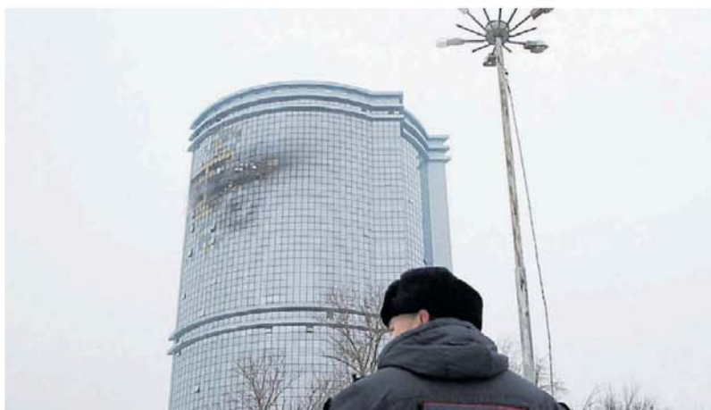
Daños. La imagen muestra parte de la estructura del edificio quemada por el impacto de los misiles.

Según imágenes replicadas en redes sociales, el ataque hizo recordar el atentado del 11 de septiembre en Estados Unidos. Esta vez con drones, a diferencia de aviones, las grabaciones muestran cómo los vehículos aéreos no tripulados impactan en la parte alta de algunas