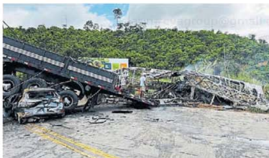
Escena. El bus aun humeando, el camión retorcido y el automóvil. RTR