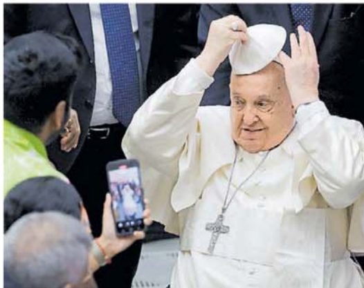
El Papa en un encuentro con los empleados del Vaticano.

El viernes el Papa recibió en el Vaticano al presidente palestino Mahmud Abbas durante media hora. Una nota del Vaticano dijo que primero con el Papa y después con su secretario de Estado, Pietro Parolin, se afrontó la "gravísima situación humanitaria en Gaza". El au-