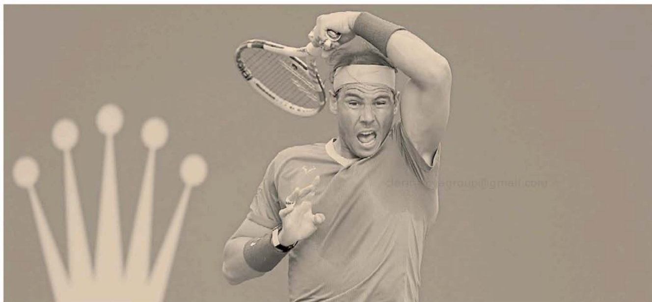
Contradicciones. Rafael Nadal, un gigante del tenis que acaba de retirarse de las competencias, es "embajador" del represivo régimen saudita.

Ni Messi, ni Ronaldo, ni Nadal están desnutridos, exactamente. No tienen excusas. Tengo la escena final de mi libro. Nuestros héroes, junto a Gianni Infantino, se revuelcan en el lodo negro de los petrodólares ante la displicente mirada del príncipe Mohamed Bin Salman.