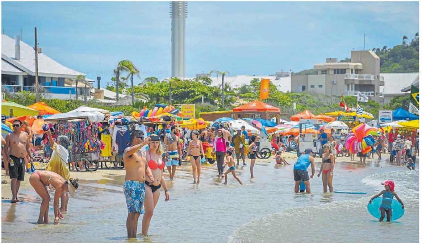
Playa Lagoinha. Al norte de la isla de Florianópolis, y con un mar casi sin olas, es una de las preferidas de los turistas argentinos.