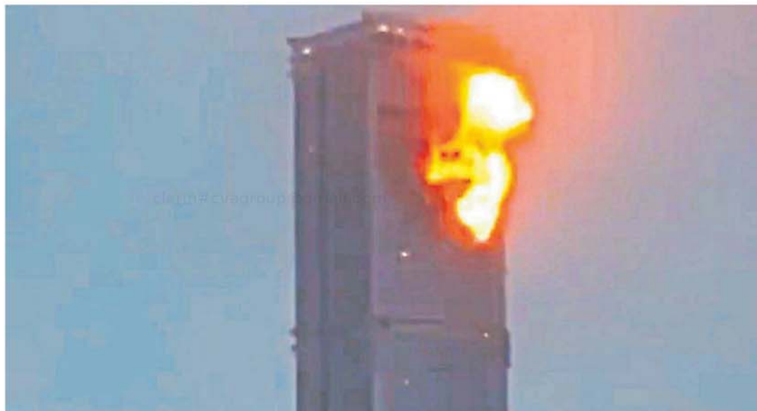
Como en el 11-S. El momento que los drones ucranianos impactan contra el enorme edificio de la ciudad de Kazán, un audaz operación de Kiev.