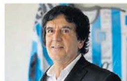
Carlos Melconian Economista - Macroview

dólares de Argentina, por lo que el país va a tener por muchísimos años la necesidad de estar en un programa con el organismo hasta que pueda haber un repago real". "Entre las variables claves están