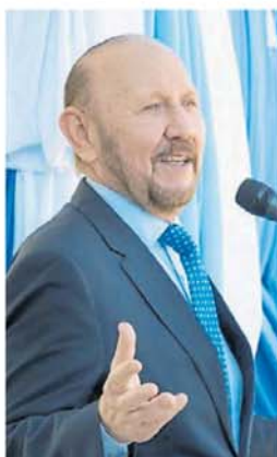
Insfrán. 29 años en el poder.

En un fallo histórico y a partir de un amparo de la Confederación del Frente Amplio Formoseño, la Corte Suprema de Justicia calificó de inconstitucional el artículo 132 de la Constitución de la provincia de Formosa. Se trata del artículo que fue modificado a pedido de Insfrán en su primer mandato de fines de los '90. "El gobernador y el vicego-