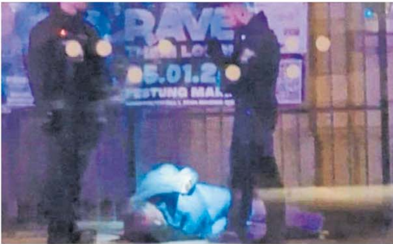
Arresto. El psiquiatra saudita en el momento que se produce su detención tras el ataque al mercado.