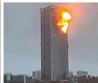
Impacto. El ataque en Kazán.