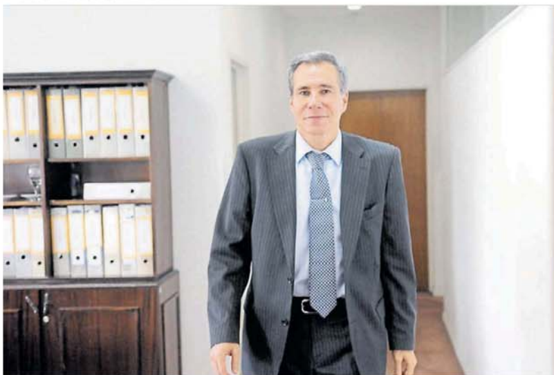
Ex fiscal de la AMIA. Alberto Nisman apareció muerto con un tiro en la cabeza el 18 de enero de 2015.

Una fuente del servicio de inteligencia advirtió, por lo pronto, que la actual SIDE "no cometerá el error" de la ex interventora K del organismo, Cristina Caamaño, quien en 2020 mandó una lista de espías a la Justicia sin testar y permitió a través de un medio K la filtración de los nombres de unos 2 mil espías y analistas de la SIDE.