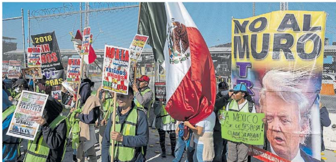
Repudio. Una manifestación en la frontera en la mexicana Tijuana, durante el día de los inmigrantes y en reclamo de que cese la persecución.