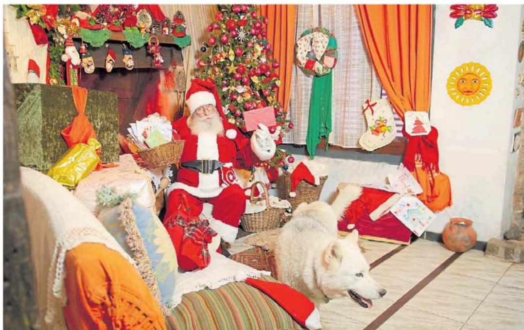
Magia navideña. Papá Noel es central en la infancia. "Es un andamiaje para la fantasía y mientras funcione no hay que negarla", dicen especialistas.