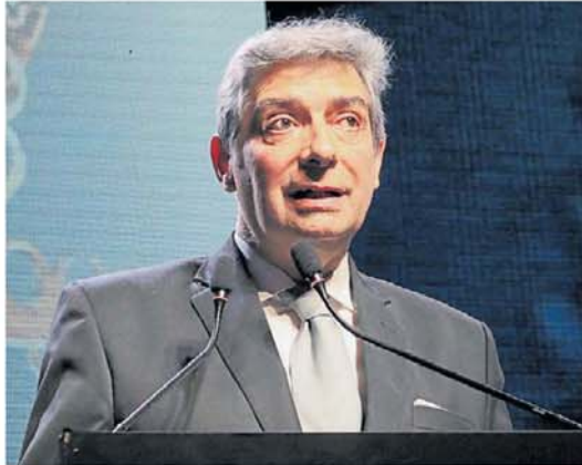
Presidente de la Corte. Se descubrió otra maniobra contra Rosatti.

Ya hay una causa judicial en los tribunales de Comodoro Py que busca esclarecer qué hay detrás de esa extraña situación que se da en el marco de una nueva pelea interna entre los miembros de la Corte y el intento del gobierno de nombrar