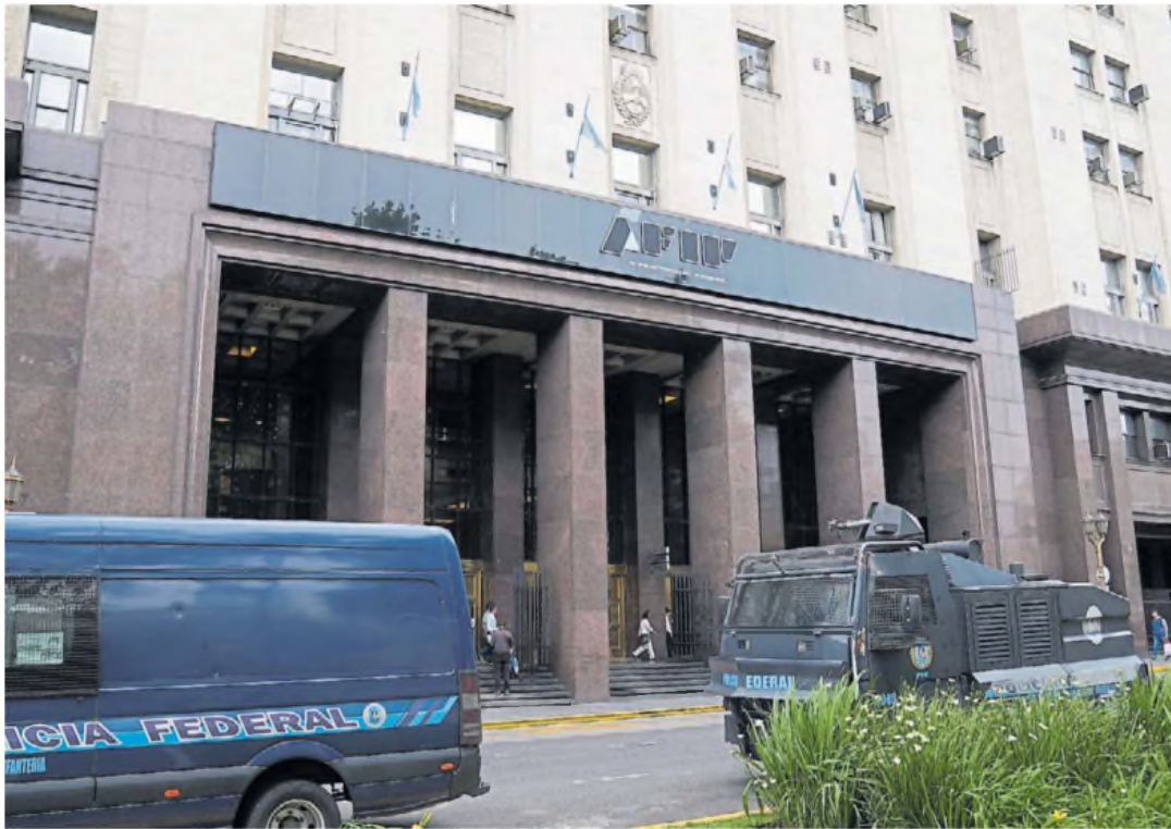
Escándalo. La AFIP, rebautizada como ARCA. Había una lista de "intocables", personajes K que quedaban a salvo del acceso a información clave.