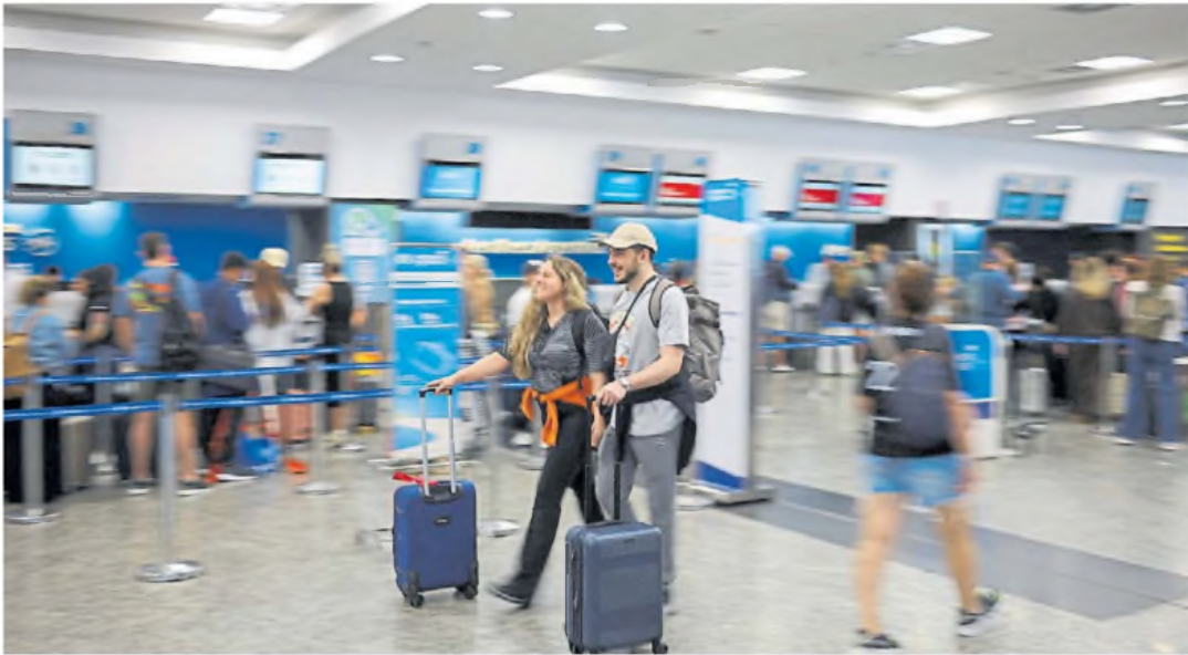
Sigue vigente. Alberto Fernández lo había prorrogado por diez años y ayer Javier Milei y sus ministros le dieron otros dos años más.