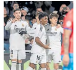
Un trámite. Para Real Madrid.

"Estamos satisfechos, es obvio que tenemos más calidad