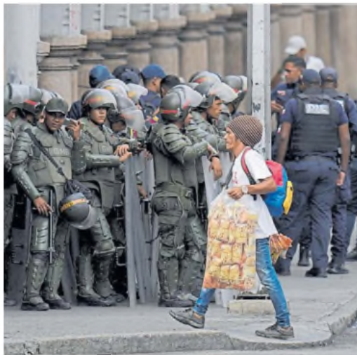
Férreo control. Uniformados se despliegan en calles de Caracas.

Muy pocos venezolanos se identifican con su verdadero nombre por temor a la represión que aplica el régimen chavista si declaran ante la prensa o las redes sociales, especialmente después de las elec-