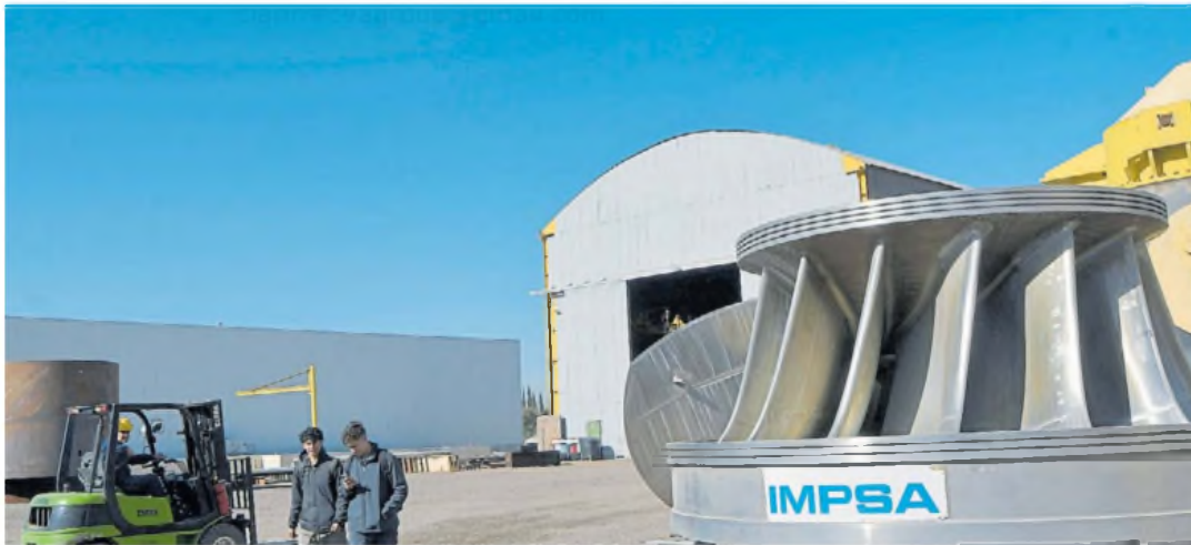
De punta. Impesa es líder en tecnología pero acumuló una deuda de US$ 570 millones. Alberto Fernández la estatizó.

La firma de capitales nacionales exporta a 50 países de mercados emergentes clave en América Latina, África, Asia y Medio Oriente.