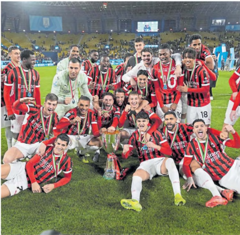
Campeones. Los jugadores del Milan festejan con la Copa. Su nuevo técnico dirigió dos partidos.