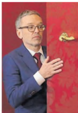
Ingreso. El ultra Herbert Kickl.

Kickl es un corredor aficionado de triatlón y maratones, de 56 años,