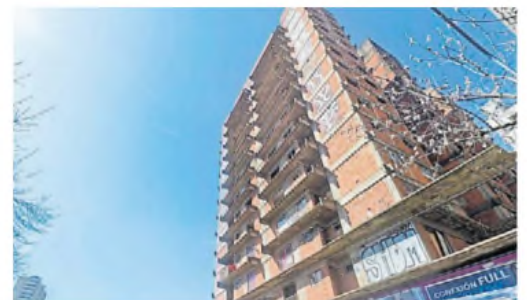
Belgrano. La torre de 14 pisos sin terminar, en Olazábal y Superi.

Una inspección de la empresa Edenor determinó que las conexiones del edificio son precarias y hechas de manera irregular, por lo que, por precaución, cortó el suministro eléctrico. Los técnicos observaron que las familias tenían grupos electrogénicos dentro de los departamentos, un riesgo por la emanación de los equipos de monóxido de carbono. ■