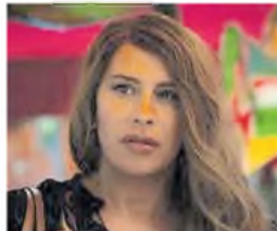
Emilia Pérez. Karla Sofía Gascón.

En cuanto a Emilia Pérez , es un musical bastante fuera de lo común. Algunos a quienes no les gusta la denominación opereta o burlesque. Trata sobre Manitas, el jefe de un cartel mexicano (la actriz trans española Karla Sofía Gascón) que se transforma en mujer tras someterse a una cirugía. Para que la ayude, contacta a una abogada, Rita (Zoe Saldaña). Manitas estaba casado con Jessi (Selena Gomez).