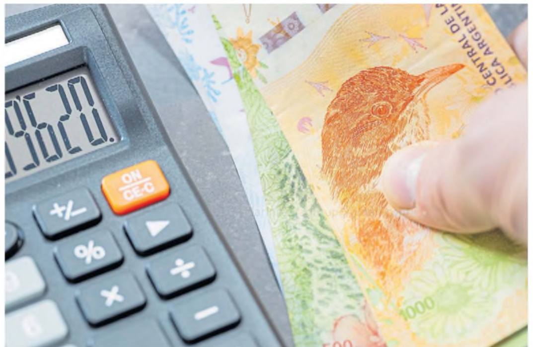
Simplificación. El Gobierno prioriza la recaudación para conservar el superávit y a la vez dice que buscará simplificar los impuestos.