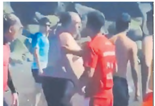
Secuencia. Los videos que grabaron los turistas mostraron cómo fue la discusión y posterior pelea entre el hombre y los guardavidas.