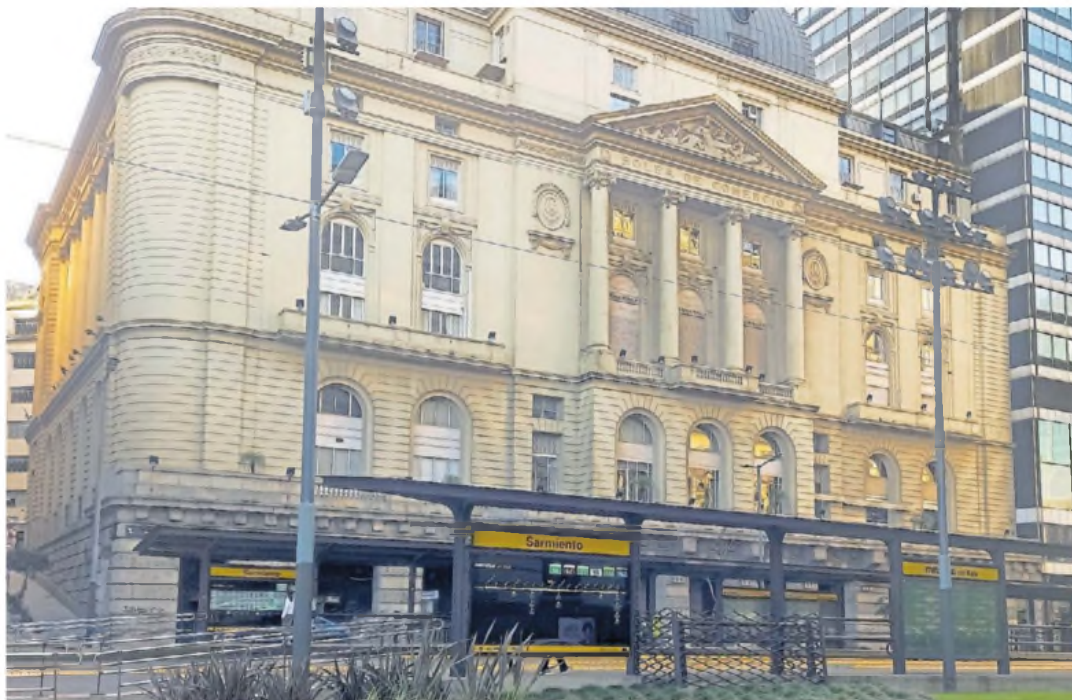
Bolsa de Comercio. El Merval arrancó el año en sintonía con la suba de las acciones a nivel local y en Estados Unidos.