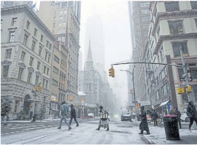
Polar. Las temperaturas gélidas se sintieron con fuerza también en Nueva York.