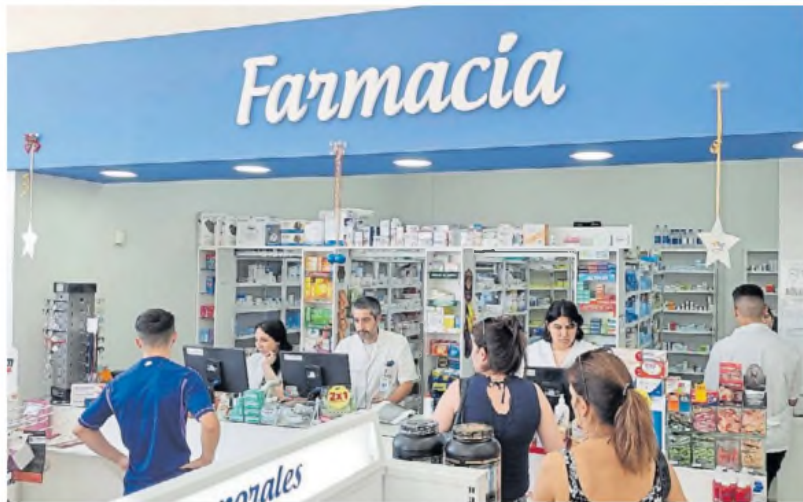
Habilitados. Todos los profesionales de la salud están autorizados para preparar recetas electrónicas.

el consultorio. Tipeando en la computadora, tablet o con el celular, el médico confecciona la indicación del medicamento. El Registro Nacional de Plataformas Digitales Sanitarias tiene habilitadas unas 110 opciones y el médico debe elegir una. Algunas plataformas son gratuitas, otras son exclusivas para ciertos nichos -como los miembros de un colegio profesional o para los profesionales empleados de obra social- y también hay pagas, que, en general, ofrecen