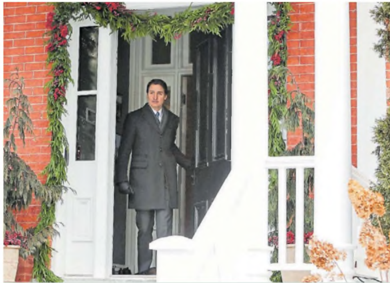
Despedida. El renunciante Trudeau, ayer, en Ottawa. Debe esperar a que su partido nomine a su sucesor.

El mandatario electo también ha anunciado aranceles del 25% a to-