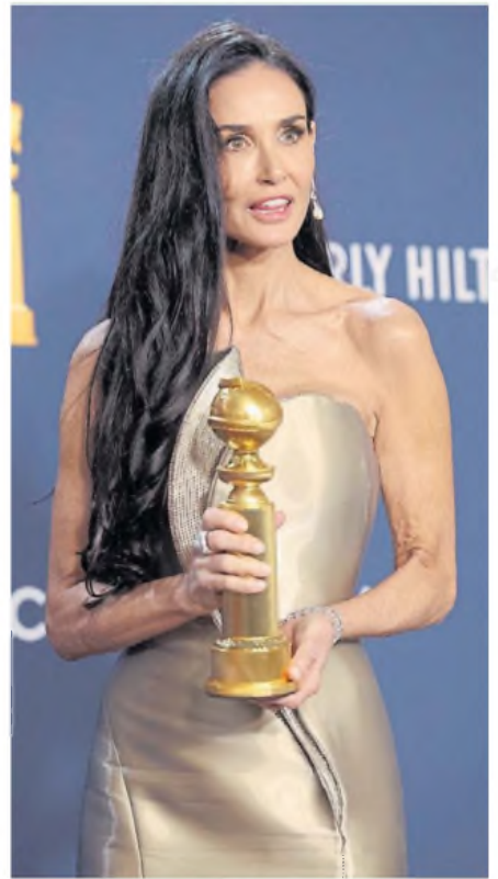
Ganadores. Zoe Saldaña, mejor actriz de reparto por "Emilia Pérez"; Adrien Brody, mejor actor en drama; y Demi Moore, mejor actriz de comedia o musical por "La sustancia".