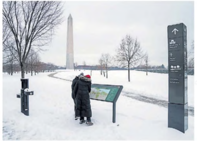
Frío. Los turistas tuvieron problemas para pasear por sitios emblemáticos de Washington