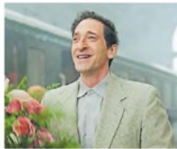
El brutalista. Adrien Brody.

No la pasan bien al comienzo, pero él consigue un contrato con un misterioso y adinerado cliente que cambiará sus vidas.