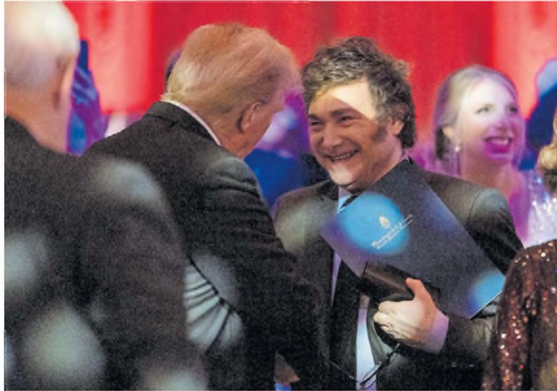
Afinidad. Javier Milei saluda a Donald Trump, cuando viajó a EE.UU. tras el triunfo electoral del republicano.

Tras varias internas en el área de Logística, que decantaron en la salida de varios funcionarios, finalmente se logró licitar de manera