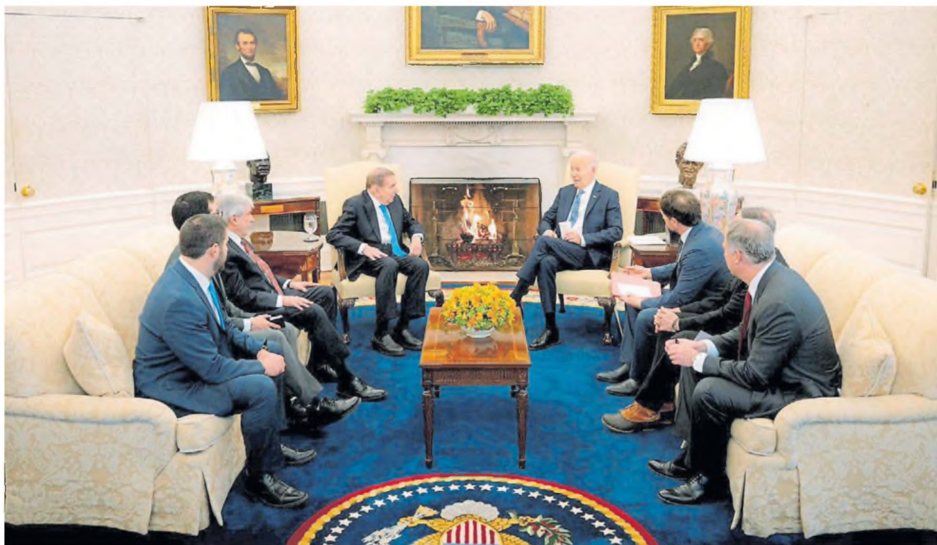
Encuentro. El presidente Joe Biden y el líder opositor venezolano, Edmundo González Urrutia, ayer, en un momento de su diálogo en la Oficina Oval de la Casa Blanca

Pese a la nieve, Urrutia se dirigió ayer a decenas de simpatizantes concentrados ante la sede de la OEA, a los que animó a no rendir-