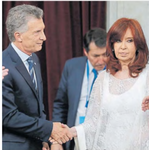
Sin casualidades. La denuncia apunta a la confrontación con los K.

El último director de la AFIP, luego convertida en ARCA por