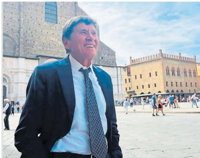
Dieta. Tiene un mandamiento inquebrantable para mantenerse sano: "No abandonar jamás los espagueti".

En el comienzo de su vida, la música nació de los zapatos que arreglaba su padre. En el tallerito de calzado familiar, el hombre golpeaba el cuero, soldaba y cantaba, y al pequeño Gianni se le grababan las melodías entre suelas y olor a pegamento. Su historia de ascenso social, fama descomunal y porrazos fue escrita en media docena de libros. Mucho antes de fundar la Nazionale Italiana Cantanti, una Selección de intérpretes que todavía