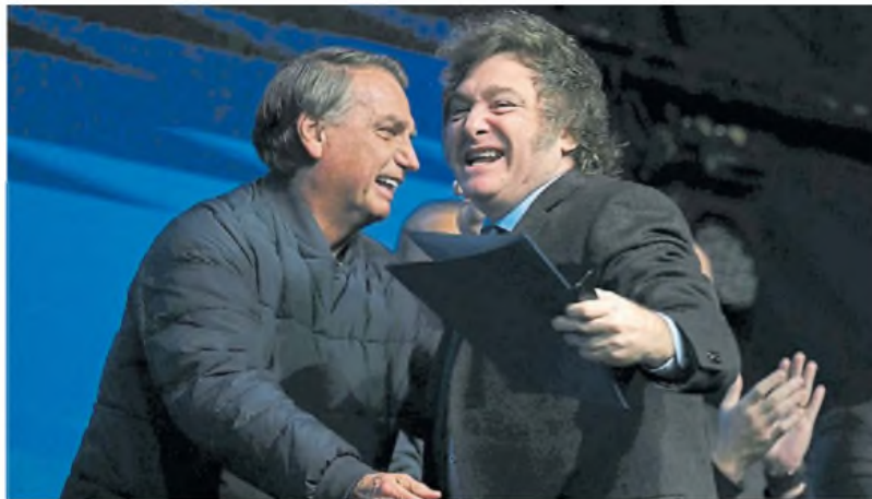
Bolsonaro y Milei. Dos nombres clave de la nueva cruzada moral que obtuvo el poder en Brasil y Argentina.

En el primer capítulo, Goldstein repasa ciertas características típicas del liderazgo presente de la derecha radical, dentro del cual el mesianismo, el narcisismo, la megalomanía y el resentimiento juegan un rol central, al punto de ser, sobre todo este último, tal como dice el autor “el motor existencial de varios de los líderes de la derecha radical”. El diagnóstico como “cruzada moral” que divide puros e impuros, será en este aspecto, crucial en la construcción de la narrativa promovida por sus ideólogos e influencers, tales como Agustín Laje o Axel Kaiser, dos que Goldstein analiza como modelos que propalan es-