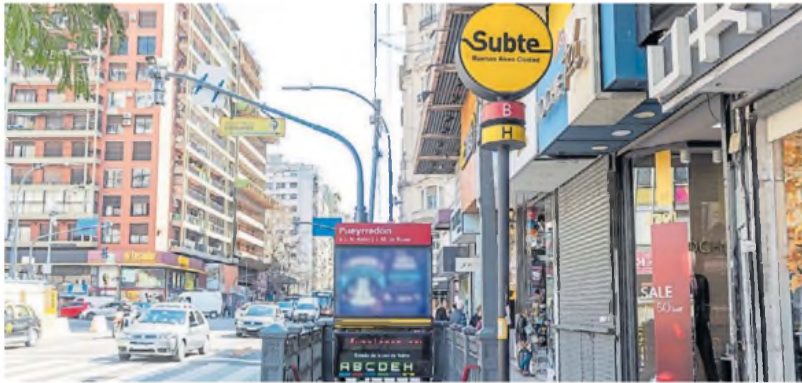
En el corazón de Once. Una de las entradas a la estación Pueyrredón de la línea B, una de las más usadas.