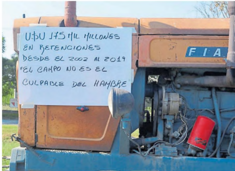
En guardia. A la preocupación por los márgenes "finitos" se agrega la falta de humedad en soja, maíz y sorgo.

"El sector productivo agropecuario apoya decididamente las políticas de cambios estructurales en materia macroeconómica, las promesas de cambios impositivos y las reformas positivas que ha prometido y que en parte está llevando adelante Javier Milei", indicó Gabriel de Raedemaeker, exvicepresidente de Confederaciones Rurales Argentinas (CRA). La cuestión es que han aparecido ciertos "cisnes negros" en escena, como la situación climática, la caída abrupta de precios de commodities -en particular el de la soja que bajó más de 73 dólares por tonelada en los últimos ocho