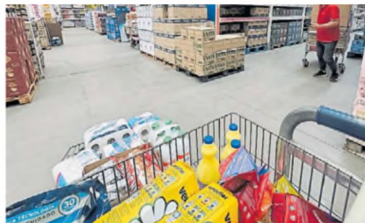
Afirmación. El 49% del precio de los productos son impuestos.

La Cámara Argentina de Distribuidores y Autoservicios Mayoristas (Cadam) advirtió que el debate sobre si el dólar está barato en la Argentina debe “cambiar de enfoque”. En un comunicado titulado “¿Dólar barato o impuestos caros