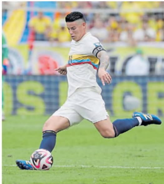
James Rodríguez. Tiene 33 años y brilló en la última Copa América.

Lo cierto es que James Rodríguez se convirtió en jugador libre tras rescindir su contrato con Rayo Vallecano. Además, el futbolista renunciará a percibir el salario por lo