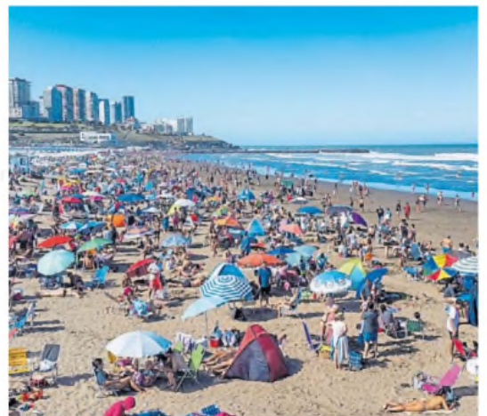
Día soñado. Turistas y vecinos se volcaron a las playas.