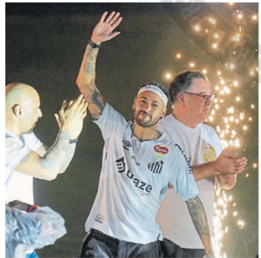
Emocionado. Neymar llegó en helicóptero a su presentación.

ria para Al Hilal, aunque le permitió a Neymar convertirse en el dueño de un peculiar récord: ser el jugador más caro por partido disputado. Al Hilal pagó, sin contar el contrato, 12,8 millones por cada vez que saltó a la cancha. ¿Por qué jugó tan poco? En su primera temporada sufrió la rotura del ligamento cruzado anterior y meniscos de la rodilla izquierda el 17 de octubre de 2023 durante un partido entre Brasil y Uruguay que lo sacó de circulación un año y cuatro días. Volvió el 21 de octubre de 2024 y jugó 13 minutos contra Al Ain de Emiratos Árabes y su última función fue el 4 de noviembre de 2024: fueron 30 minutos ante Esteghlal FC de Irán hasta que sufrió un desgarró en el tendón de la corva. "Ya no puede jugar en el nivel al cual estamos acostumbrados. Lamentablemente, las cosas se complican para él", afirmó el DT del Al Hilal, el portugués Jorge Jesús, sobre Neymar, que en 2017 pasó del Barcelona al PSG en 222 millones de euros que configuraron la transferencia récord del fútbol mundial.