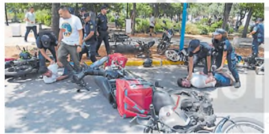
Reacción. La Policía respondió: detenidos y motos rotas. G. MEDINA