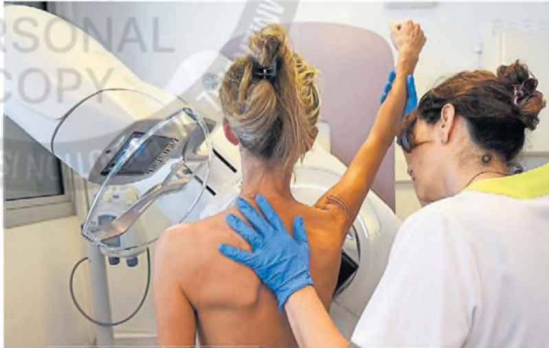
Clave. Mamografía, un chequeo imprescindible para la detección temprana de cáncer de mama.

"En algunas provincias con un nivel socioeconómico menor, la incidencia y la mortalidad de ciertos tumores es mayor que en otros lugares, como Buenos Aires y otras