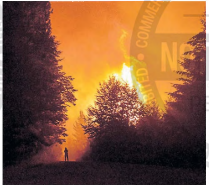
El Bolsón. Se indicó que las llamas arrasaron con una escuela y una sala de salud.