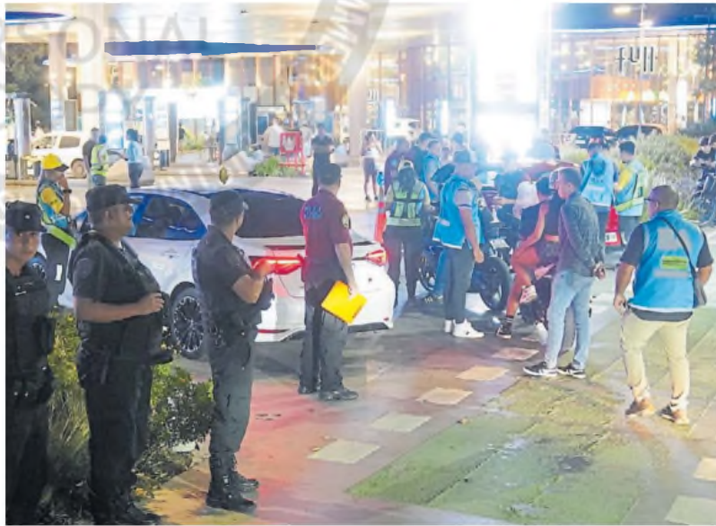
Punto de encuentro. La estación de servicio de Avenida Figueroa Alcorta y Echeverría. EMMANUEL FERNÁNDEZ

"Es un complejo de viviendas de 152 propiedades, donde viven 550