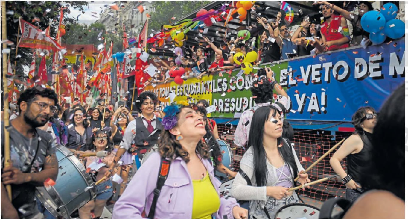
Disparador. Para las organizaciones LGTBQ, el discurso de Milei en Davos resultó "fuertemente discriminatorio" y provoca la movilización de esta tarde.