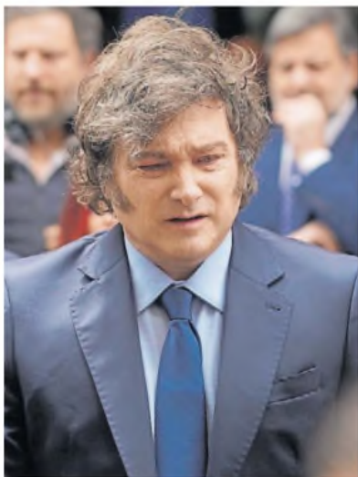
Por las redes. Milei apuntó a la Provincia.

Si se extendieron los parques industriales y, en algo, mejoró la cobrabilidad de tasas. Cuando asumió Fernández sólo el 25% de la gente pagaba el ABL. Hoy en la Comuna resaltan que lo hace casi el 65%. ■