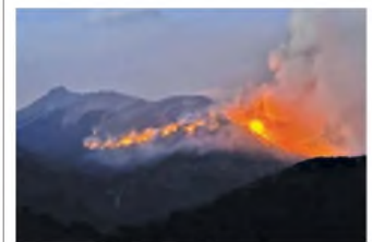
Bajo fuego. Abarca 1.600 hectáreas.

Intentó comprar seis departamentos en Paraguay. Aunque llevó el dinero en efectivo -y quedó consignado en los registros- finalmente se lo devolvieron, ya que la operación no se concretó. La secretaria sigue detenida en Asunción junto al ex senador. P. 13