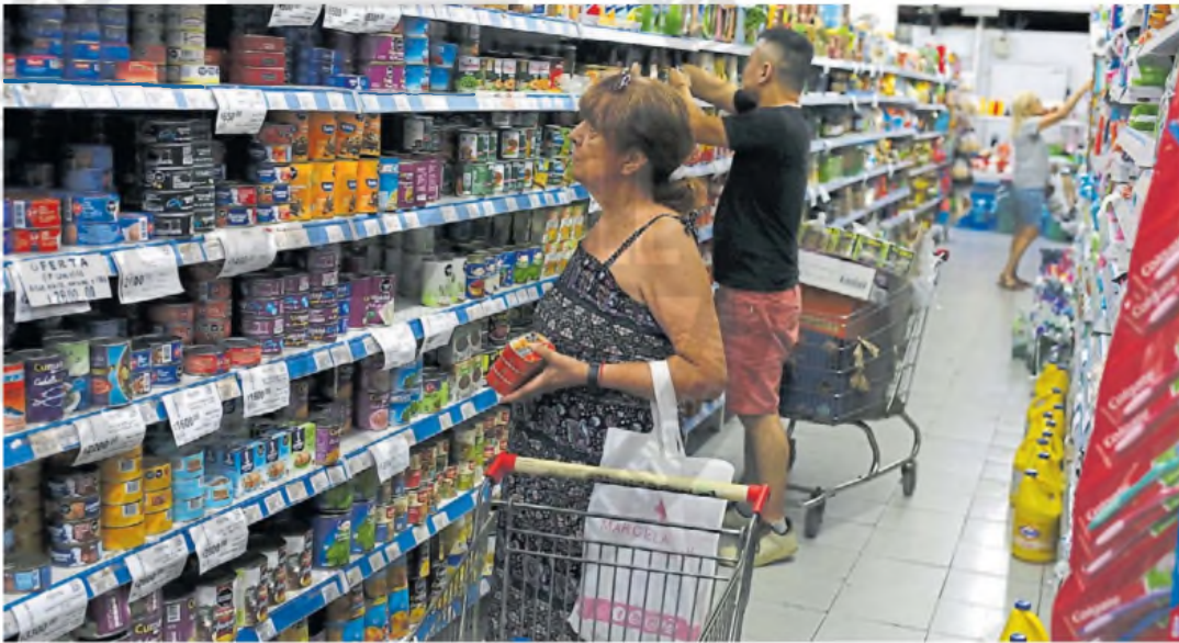
Góndolas. El arranque del año parecía preocupante, pero con el correr de los días las remarcciones se atenuaron por completo.