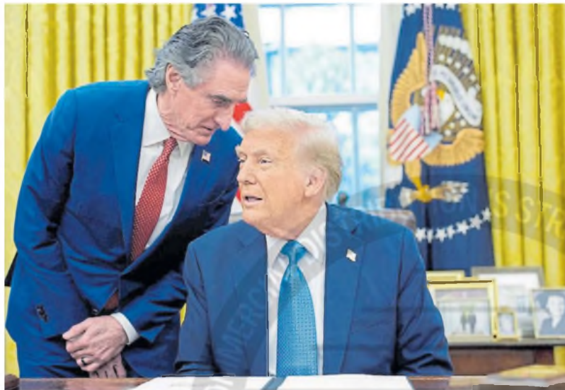
Equipo. El ministro de Interior, Doug Burgum con Donald Trump en el anuncio de los aranceles.

En el caso de EE.UU., Donald Trump, defiende la medida contra México y Canadá para frenar el tráfico ilegal de fentanilo, una peligrosa droga sintética. Los expertos sostienen que es un pretexto. Lo que busca Trump, que no simpatiza con el libre mercado, con aranceles también contra China y Europa, es presionar para que las empresas en el exterior produzcan en EE.UU. en la suposición dudosa de que eso ampliaría la riqueza del país. Lo cierto es que son medidas inflacionarias, lo que explica que la FED haya mantenido las tasas sin cambios pese a la presión de Trump y que posiblemente las aumente en sus próximas reuniones. ■