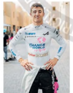
Australiano. Jack Doohan.

Consciente de lo que se habla de su futuro en Alpine tras la contratación de Franco Colapinto como reserva, el austriaco Jack Doohan, que debutará en marzo en su tierra, avisó: "Espero tener muchos años de éxito. Estoy muy emocionado por empezar".