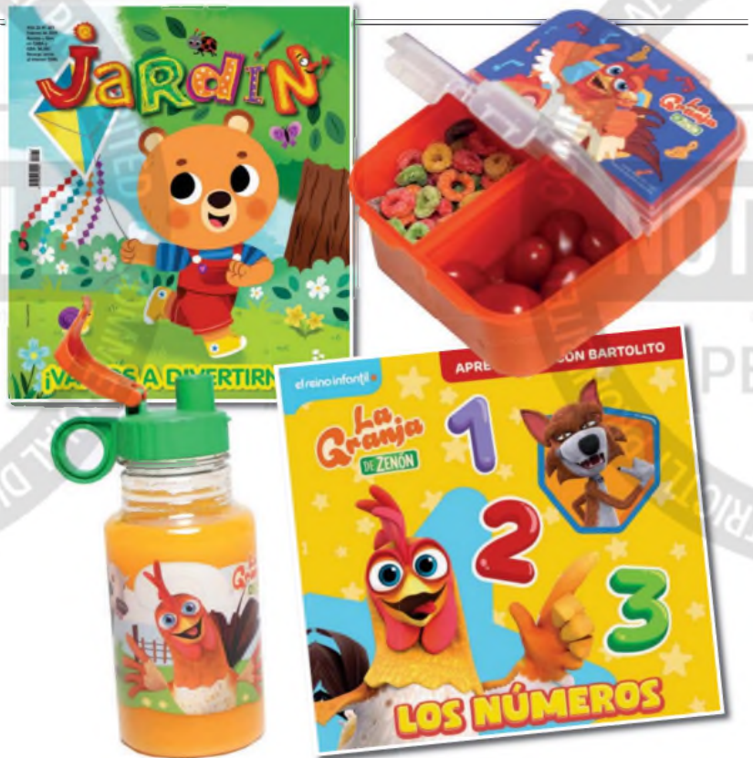
Vuelta al cole. Este mes, la revista regala un recipiente hermético con divisiones. Y en marzo, una botellita.

La edición de febrero de Jardín de Genios , con "Los números", el primer libro de la colección Aprendemos con Bartolito , más el práctico recipiente plástico hermético para la vianda, ya está en los kioscos a $6.500.