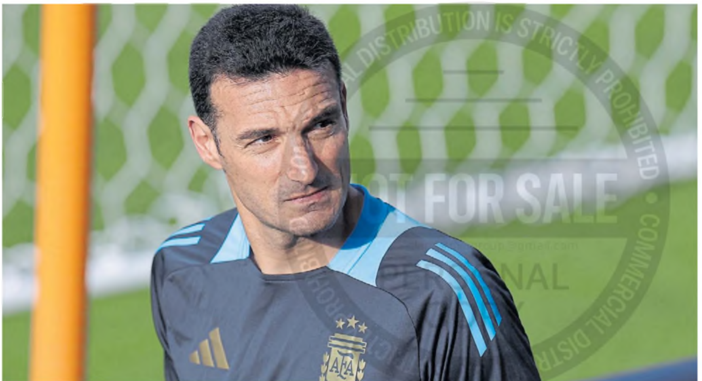
A corazón abierto. Durante la entrevista con Dsports, Lionel Scaloni dejó en claro lo que significa para él dirigir a la Selección Argentina. También habló de Messi y de otros temas.

"Si queremos pensar en el Mundial, es el momento de darles oportu-