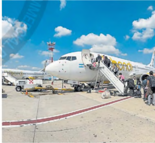
Bajo fuego. La low cost Flybondi, sancionada por la Provincia.

"La empresa incurrió y continúa incurriendo en reiteradas infracciones, como las suspensiones o reprogramaciones de sus vuelos, la dificultad o imposibilidad de comunicarse con la aerolínea para obtener respuestas y la inviabilidad para optar por reprogramaciones o por los reintegros de los tickets o de los gastos generados debido a las cancelaciones (como gastos de transporte al aeropuerto, pérdida de hoteles, excursiones y paquetes turísticos, entre otros)", se informó oficialmente.