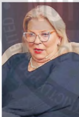
Líder de la CC. Elisa Carrió.

"Che Milei... ¿Cómo era ese verso que recitabas cuando querés explicar qué es el 'libertarismo'? Se ve