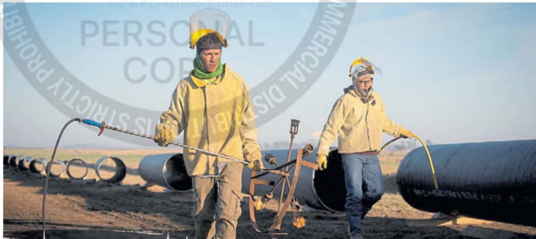
Empleos que cuesta cubrir. La capacitación de los trabajadores del petróleo, en el foco de las empresas petroleras.

que significó un aumento de 2,2 puntos porcentuales frente al 2023. La deuda pública bruta llegó a nueve billones de reales (unos 1,53 billones de dólares).