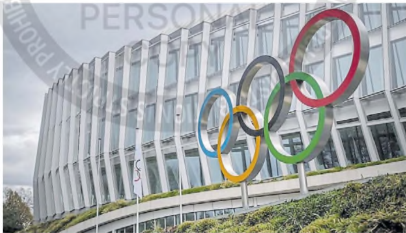
La sede. Los cinco anillos olímpicos, frente a la sede central del Comité Olímpico Internacional, en Lausana.

Los siete candidatos a presidente del COI expusieron ante sus miembros. La elección será el 20 de marzo.