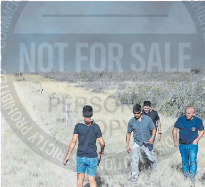
Puerto Madryn. Informaron que el fuego se propagó hasta las cercanías de la ciudad.