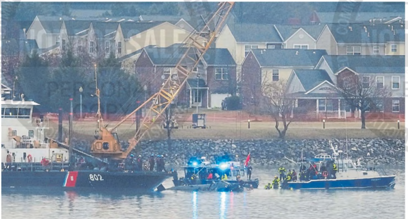
Compleja tarea. Gruas y buzos especializados en el Potomac, en medio de una durísima helada y por la noche, durante el rescate de los cuerpos de las víctimas del desastre aéreo.