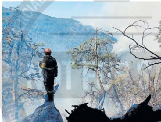
Desastre. Un brigadista, en una de las zonas alcanzadas por las llamas.

informaron que a primera hora de ayer comenzó la evacuación de los turistas y los vecinos que se encontraban en el Polideportivo de El Bolsón . Anoche, informaron que ya habrían rescatado a 700 personas, entre turistas y mochileros . Una de las principales preocupaciones allí era el fuego en el