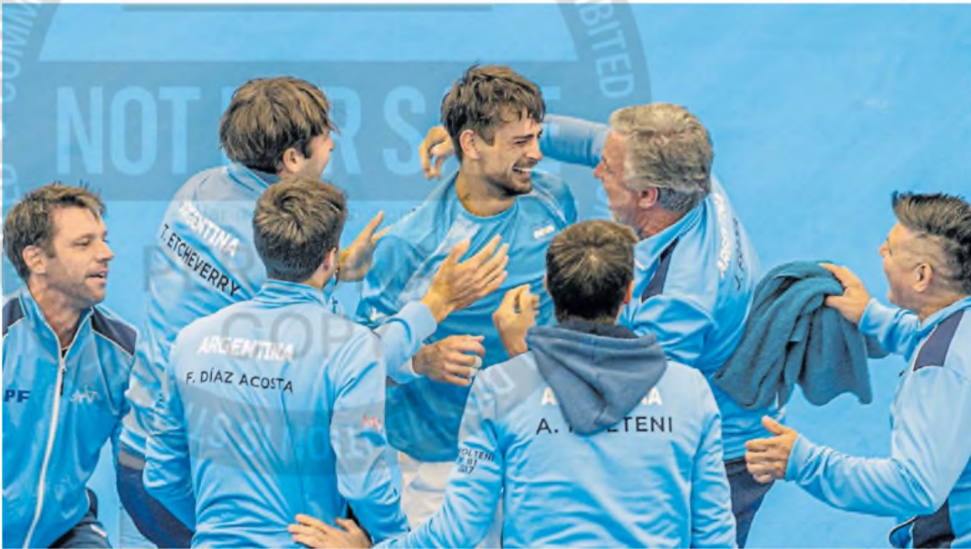
Fiesta celeste y blanca. El equipo argentino de la Copa Davis celebró a lo grande en Noruega luego de demasiado sufrimiento.