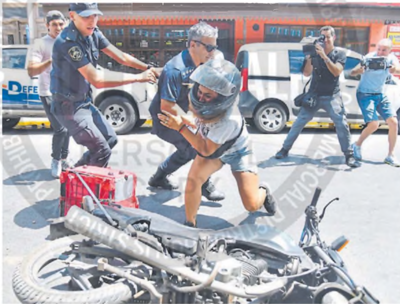
Detenida. Una joven, con casco, es interceptada por la Policía en medio de los incidentes graves de ayer.