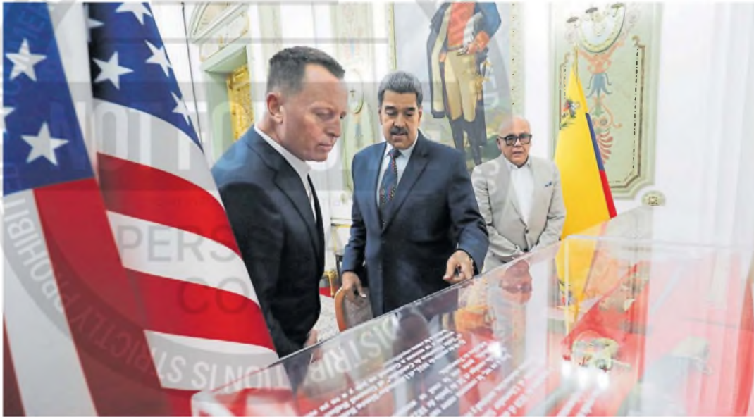
Reunión. El dictador chavista recibe en su despacho al enviado especial de Trump, Richard Grenell. Atras, observa el presidente del Parlamento.