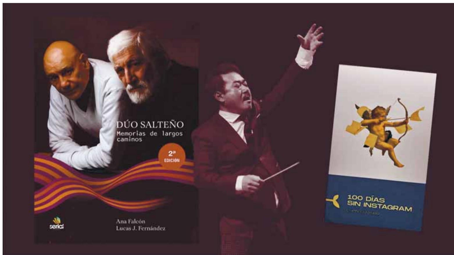
Sobre un Dúo imborrable, un concierto de apertura y un libro crítico con las redes.

Nos acompañan procesos culturales que nos hacen fuertes, las convicciones estéticas siempre abiertas, el homenaje constante a flor de labios, la esperanza de un resto del año rico en inspiraciones.