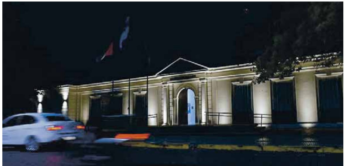
Después de un sprint de proyectos aprobados, el Concejo entra en receso hasta febrero. A la vuelta, arranca Ficha Limpia y la licitación por las 100 cuadras de pavimento.