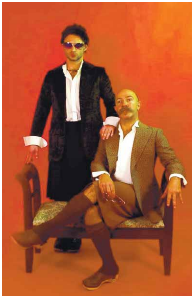
Los Modernos se presentan hoy en el Teatro del Libertador.