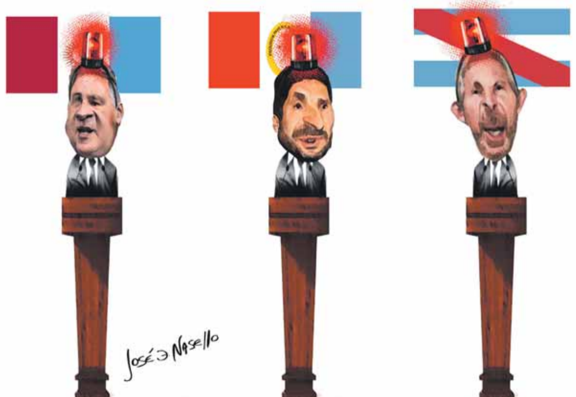
Los gobernadores Martín Llaryora, Maximiliano Pullaro y Rogelio Frigerio.