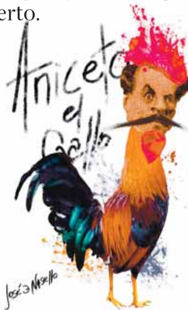
Ya en su época se hacía hincapié en la identidad entre Ascasubi y Aniceto.

"A los catorce años partió, como tambor,