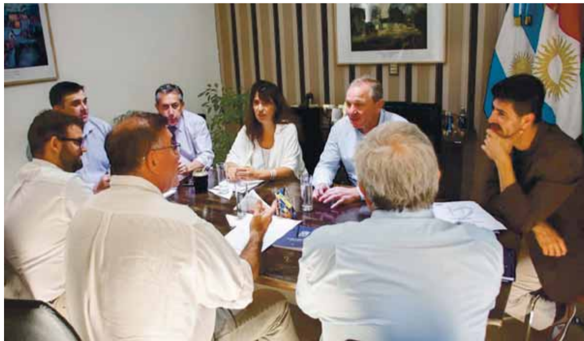
El Gobierno se adelanta al debate por la licitación de las 100 cuadras de pavimento: aunque tiene los votos, la oposición podría utilizar el tema para hablar del “impuestazo”.

En el Palacio de Mójica repitieron lo que De Rivas marcó como