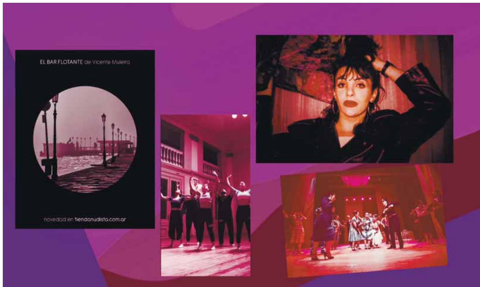
Un nuevo poemario, una luchadora trans, canto y danza, danza y tango.

Poemas, escenas, películas, danzas, dibujos y cantos son parte de lo que florece bajo el afán del jueves esta sucesiva tarde que reina en la ciudad.