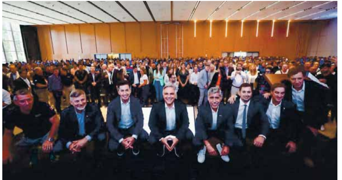
La Guardia Local de Llaryora sigue sumando adhesiones de intendentes dispuestos a sacar de su propio bolsillo para invertir en el programa: algunos se resisten al costo económico.

Con una decena de nuevas adhesiones, el programa insignia de la era Llaryora en seguridad ya llegó a 100 localidades. El Gobierno sigue trabajando para convencer a los municipios medianos que faltan, algunos gobernados por el radicalismo. La gran inversión y los resultados, dudas para los intendentes.