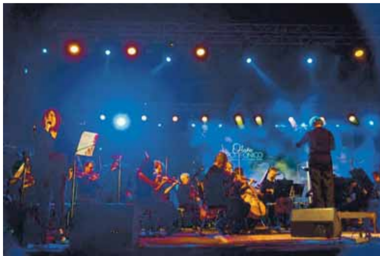
Inició la sexta edición del festival insignia de Río Cuarto. Hasta el domingo próximo se podrá disfrutar de seis días con más de 40 conciertos programados.

ñamiento de autoridades provinciales en este evento y ya hay varios anotados, como ocurrió durante toda la temporada festivalera. Además de algunos funcionarios primera línea que puedan acompañar, en la Municipalidad aguardaban por confirmaciones respecto a la presencia del gobernador Martín Llaroya: con un escenario más calmo que hace unos días, podría sumarse a la celebración del Otoño Polifónico durante el fin de semana.