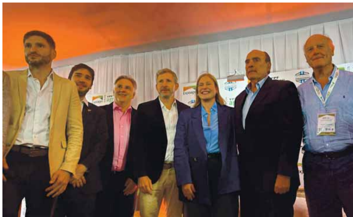
En la Expoagro, Llaryora compartió cuadro con sus pares de Entre Ríos, Santa Fé y Chubut junto al jefe del Gabinete nacional, Guillermo Francos.

No solo eso, sino que la suba del impuesto al inmobiliario rural se sumó a la lista de razones por las que Provincia debía revisar su programa de acción con el campo. Se habló de “traición” desde la Sociedad Rural de Río Cuarto, por ejemplo. Tras esto, el mandatario