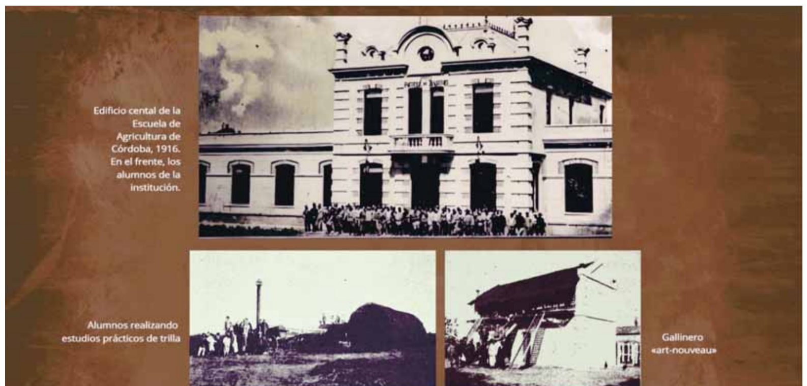
Fotos de 1911 y 1916 de la Escuela Práctica de Agricultura de Córdoba.

En un documento de 1917 se podía leer el encuadre institucional y pedagógico de las Escuelas de Agricultura, en tanto parte de un proyecto nacional dependiente del Ministerio de Agricultura. Se indicaba que “Las escuelas especiales de agricultura son instituciones intermedias entre las escuelas prácticas de agricultura y la enseñanza superior agrícola a cargo de las facultades de agronomía de las universidades de Buenos Aires y La Plata. En ellas se realiza la enseñanza práctica y teórica de todos los conocimientos que atañen a una explotación combinada de la agricultura y la ganadería, de acuerdo con lo que debe ser una granja modelo, y se presta una atención especial a los estudios prácticos de laboratorio.” Se informaba que “La Escuela de Agricultura y Ganadería de Córdoba forma peritos en agricultura y zootecnia”, y se explicaba la orientación del sistema: “El objeto de estas escuelas es formar agricultores competentes y capaces de dirigir y explotar directamente establecimientos agrícolas y ganaderos, así como