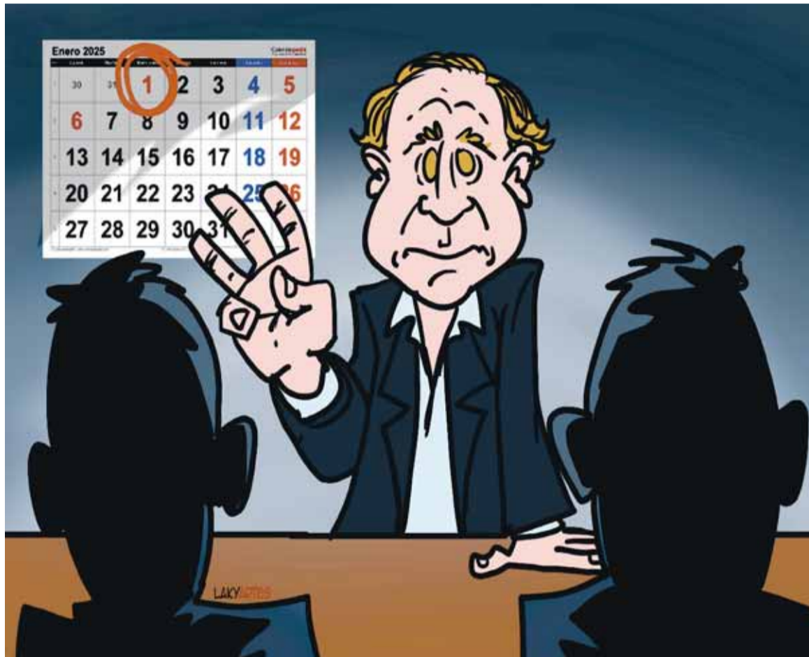
Guillermo De Rivas

El intendente pidió no sacar el pie del acelerador y seguir el trabajo en vacaciones: pidió que cada funcionario cumpla tres actividades por día. Mes preparatorio para la apertura de sesiones del 1° de febrero: menos números, más política.