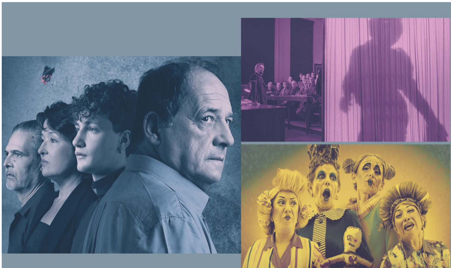
"Lo sagrado" en el Real, "El hombre elefante" en el Cineclub y "Mujeres que aman demasiado" en La Brújula.

Del teatro para filosofar al registro grotesco, de un cine servido en canapés a las nuevas figuras de una música para subsuelos, o para el Cerro; hay espacios y tiempos en la ciudad, es viernes, es febrero, vamos por él.