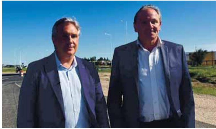
El Gobierno provincial invertirá $50 mil millones en la obra que será una de las estrellas de la campaña rumbo a las legislativas.

representan una inversión de 50 mil millones de pesos, incluirán duplicación de calzada, colectoras e intercambiadores, trabajando en conjunto con el municipio para llevar adelante esta infraestructura de alto impacto. Los trabajos a ejecutar en estas nuevas etapas se concentrarán en dos áreas específicas de la ruta A005: duplicación de calzada, colectoras e intercambiador en el tramo comprendido entre calle Molina y la Rioja, con una inversión de $23.693 millones; y la construcción de intercambiador en ruta nacional 005 y ruta nacional 36, con una inversión de $25.428 millones.