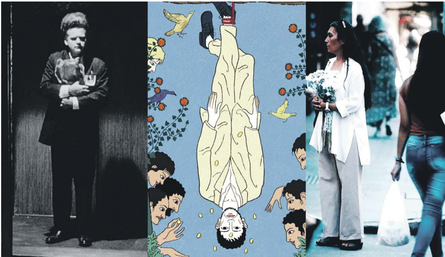
"Eraserhead" de Lynch, "La quimera" de Rohrwacher, "Las cosas indefinidas" de Maru Aparicio

La actividad oficial en materia de películas garantiza desde hoy el cauce de esta ciudad cinéfila en dos queridos espacios: el Cineclub Municipal y el Cine Arte Córdoba.