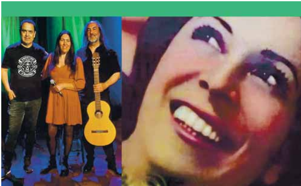
Nelly Omar, homenaje a una artista militante en el Talar de Mendiolaza.