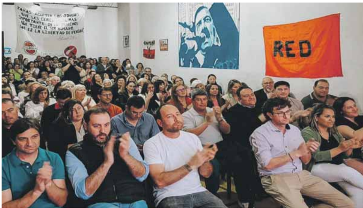
La dirigencia departamental de la UCR acelera para reunirse y definir posiciones de cara a la campaña que se viene.

Respecto a la posibilidad de que la máxima autoridad del partido en Córdoba este presente en la reunión, las expectativas son altas. Sin embargo, también hay algunos resquemores: el intendente rioterense estuvo hace dos viernes en la ciudad y se fotografió con el peronista Guillermo De Rivas, pero no tuvo tiempo de juntarse con sus correligionarios, cuestión que generó algo de molestia en determinados sectores. Como respuesta a esa desazón, Ferrer ya se habría comunicado con la dirigencia local para llevar