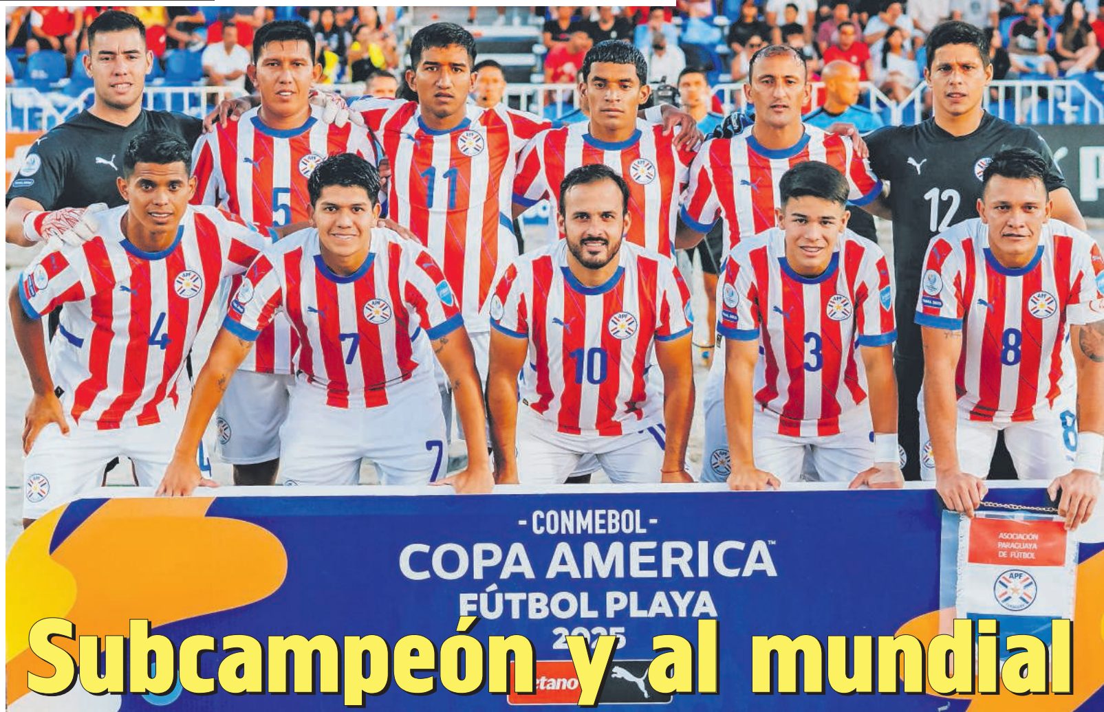
La selección paraguaya perdió contra Brasil 5-4 en la gran final de la Copa América "Iquique 2025", sin embargo, consiguió la clasificación para su sexto mundial.