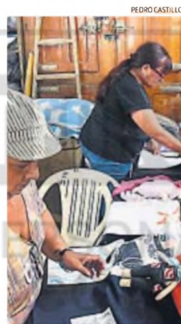
MÁS HORAS. El sobreempleo también caracteriza al mercado laboral femenino.

La abogada advirtió otro punto ligado a la situación de crisis, que acentúa las brechas: "En un contexto de reducción de personal, de despidos y donde priman situaciones de temor, se profundizan las situaciones de disciplinamiento y formas violentas de imponer condiciones de trabajo. La crisis de empleo también trae profundización de la violencia de género", agregó Terragno.