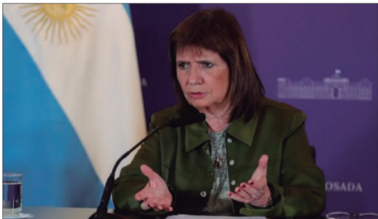
Vestida con campera militar, Bullrich presentó la "Ley Antibarras".