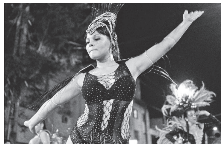
Más de 6.000 artistas bailaron y tocaron en los barrios de la ciudad.

Más de 70.000 vecinos se unieron a la fiesta de los Carnavales Barriales 2025, que durante un mes transformó la capital en un espectáculo de color y ritmo. El evento contó con la participación de aproximadamente 6.000 artistas de murgas, batucadas y comparsas en 23 escenarios. En los barrios Villa Azalais, Nuevo Rosedal, Guñazú, Cerveceros, Aurguello Lourdes, Yapeyú, Granadero Pringles, San Francisco, Talleres Este, Alta Córdoba y Alberdi las festividades estuvieron acompañadas de ferias de emprendedores. La edición 2025 comenzó en los tradicionales barrios de San Vicente, con la presentación del carnaval "San Vicente es un carnaval" y el pasado domingo llegó el turno de la 20° edición "Carnaval Popular Zona Sur" en Villa el Libertador. La tradicional Quema de Momo se realizó en Villa El Libertador, Arguello Lourdes, Granadero Pringles, Yapeyú, Villa Urquiza, Alta Córdoba, Alberdi y Nuevo Rosedal. Este año la propuesta carnalera de la ciudad creció con la Primera edición del "Carnaval del Suquia", donde se disfrutó de una tarde de arte y cultura popular, con artistas en los espacios del Parque las Heras Elisa y el Paseo Suquia. La programación general surgió de una convocatoria pública. Cada fecha fue organizada por diferentes agrupaciones con vasto recorrido en esta celebración popular y trabajo sostenido de las familias.