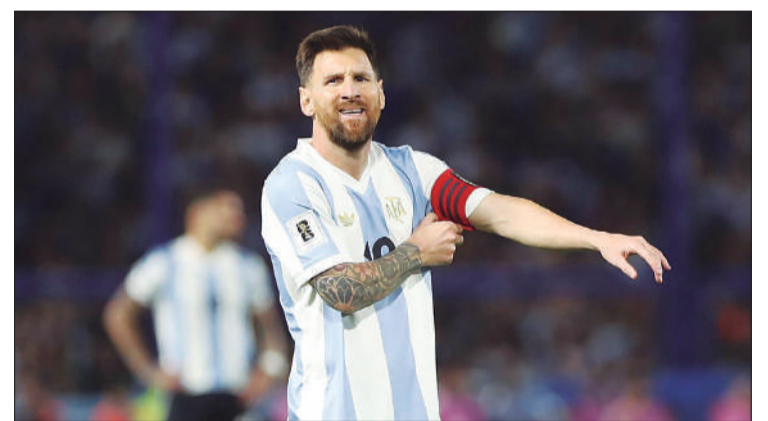
El astro argentino sería reemplazado por Nicolás González.

Se lesionó en EE. UU y no jugará ante Uruguay y Brasil / PÁGINA 10