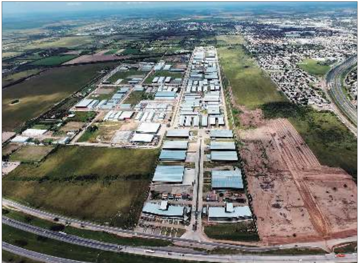
FINANCIACIÓN. La empresa firmó acuerdo para que empresas puedan obtener créditos con Bancor.

Finalmente, junto a Capital Motors, se desarrollará un tercer zócalo comercial sobre un lote de dos hectáreas, con ocho locales de 1.000 metros cuadrados, orientado a grandes empresas, concesionarias y firmas vinculadas al rubro automotriz.