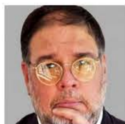
Benjamin Morales Solá Author

El jefe de Gabinete respaldó la decisión de la Comisión Nacional de Defensa de la Competencia de rechazar la operación y subrayó que el proceso seguirá su curso a través de los medios legales pertinentes.