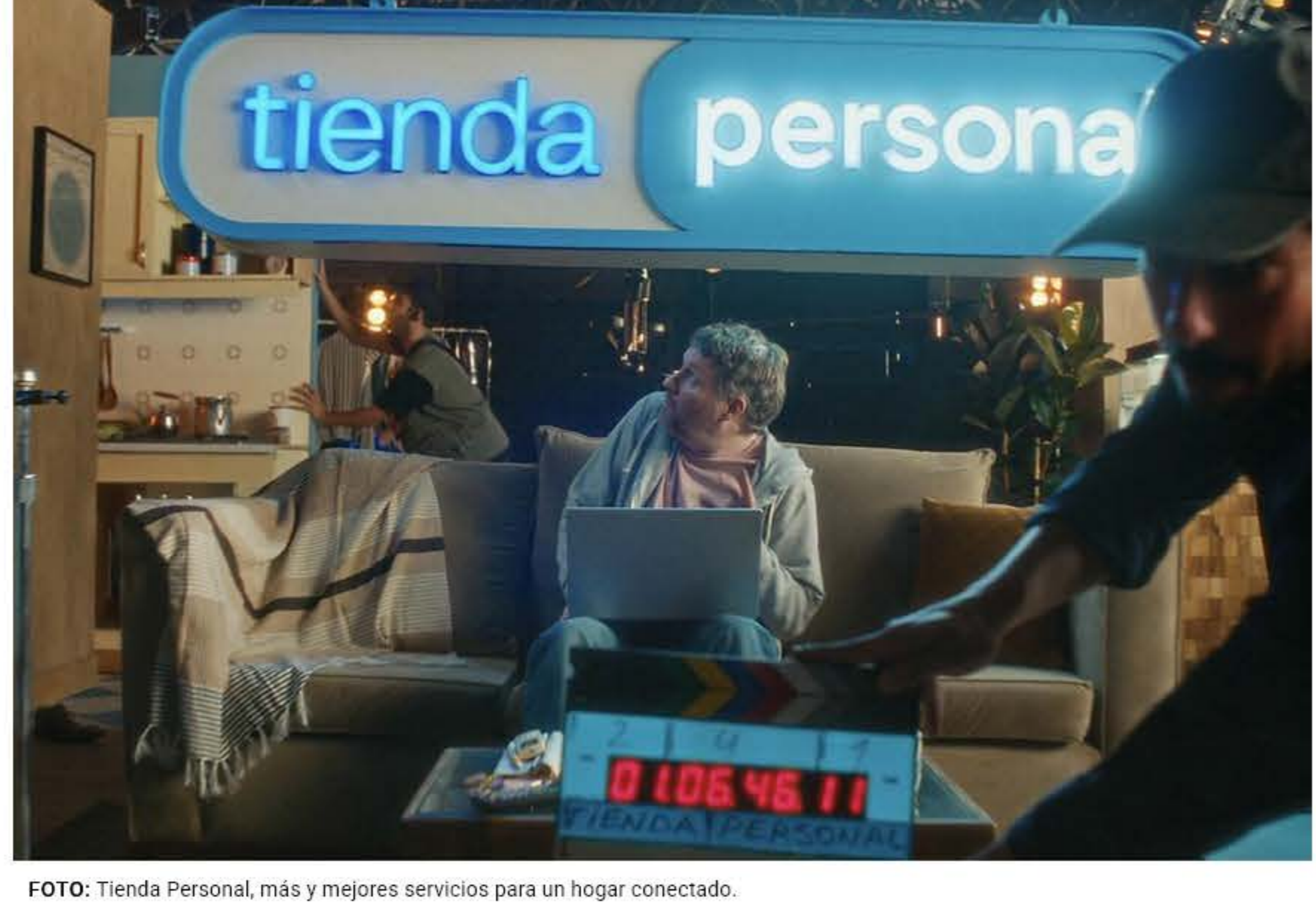
FOTO: Tienda Personal, más y mejores servicios para un hogar conectado.