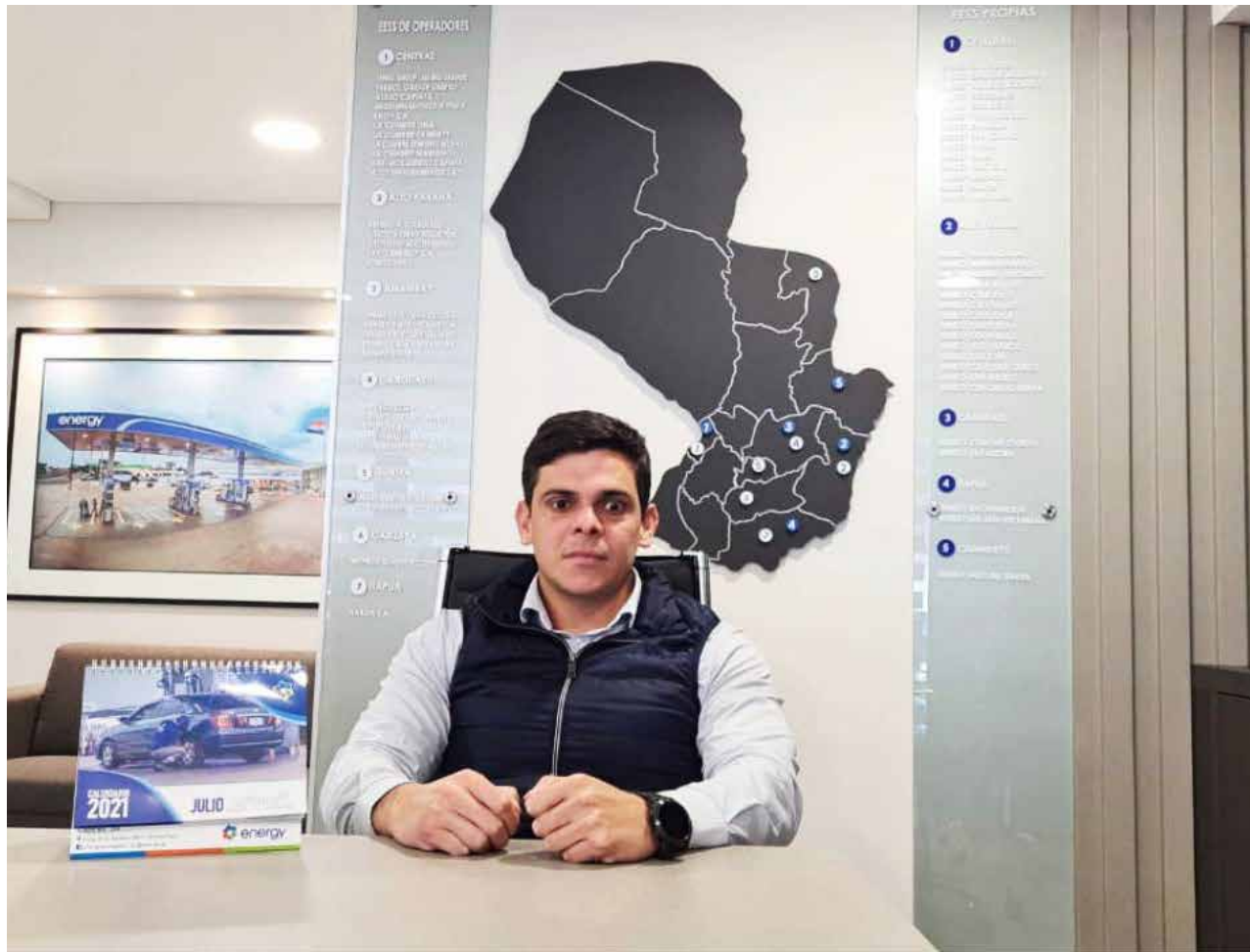
Energy ofrece calidad y excelencia a los clientes

Realmente, siempre estamos creciendo, pero actualmente estamos limitados a un decreto del Mades,