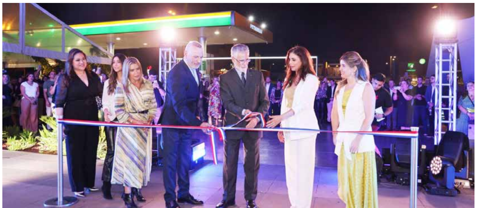
La inauguración contó con la presidencia de los directivos, clientes e invitados

La empresa tiene planes de crecimiento y de proyección muy importantes para este 2025 y la inauguración de esta sede oficial forma parte del compromiso y las proyecciones de este año.