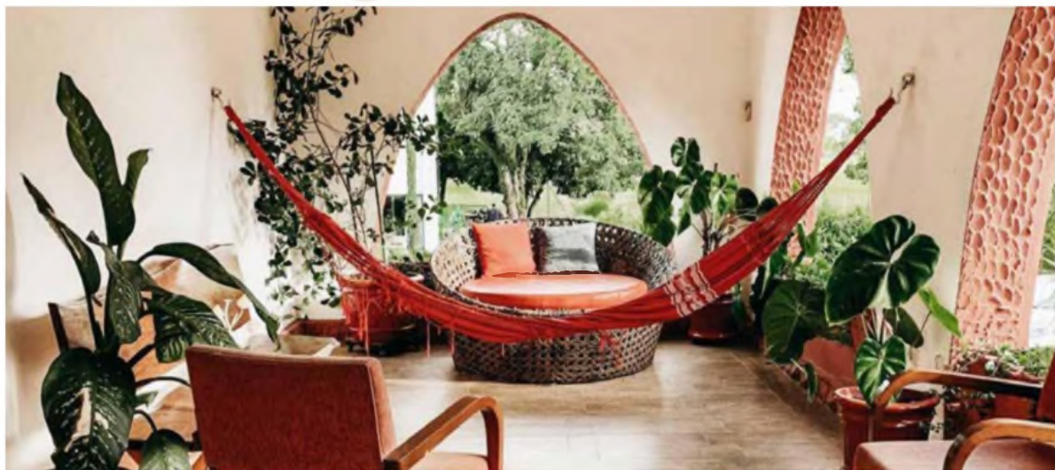
La tendencia es crear espacios visualmente atractivos que promuevan el bienestar mental y emocional.

3. Texturas agradables: Materiales como terciopelo, seda, lino o algodón refuerzan la sensación de seguridad y tranquilidad. "Estudios demuestran que el contacto con ciertos tejidos mejora el bienestar en un 60%", comentó.