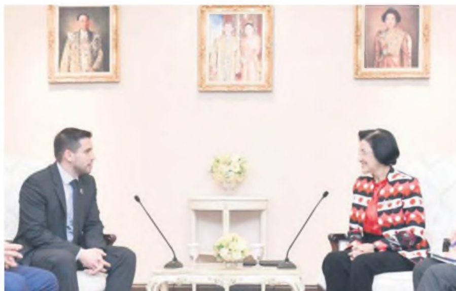
Consideran a Paraguay un socio estratégico por su posición geográfica.

Desde Paraguay, se reafirmó la voluntad de generar condiciones favorables para la atracción de inversiones extranjeras, con incentivos que permitan a las empresas tailandesas establecer operaciones en el país y fortalecer el comercio bilateral.