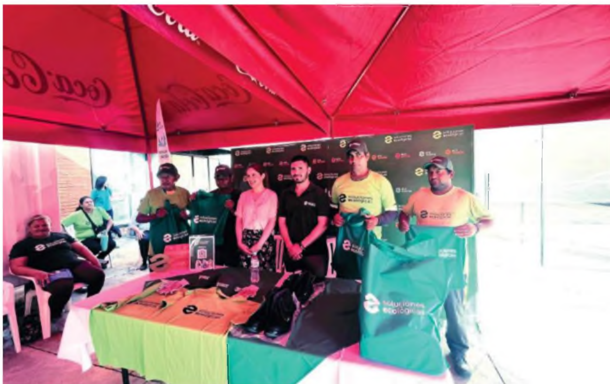
Empresas honran el trabajo de los recicladores de base.

En este sentido, reiteraron su apoyo continuo en esta tarea, brindando espacios para el diálogo y la visibilización de estos trabajos que han alcanzado importantes hitos durante 2024. A través del programa EcoPuntos®, 67 recicladores han sido beneficiados con oportunidades de trabajo digno, de los cuales 44 accedieron