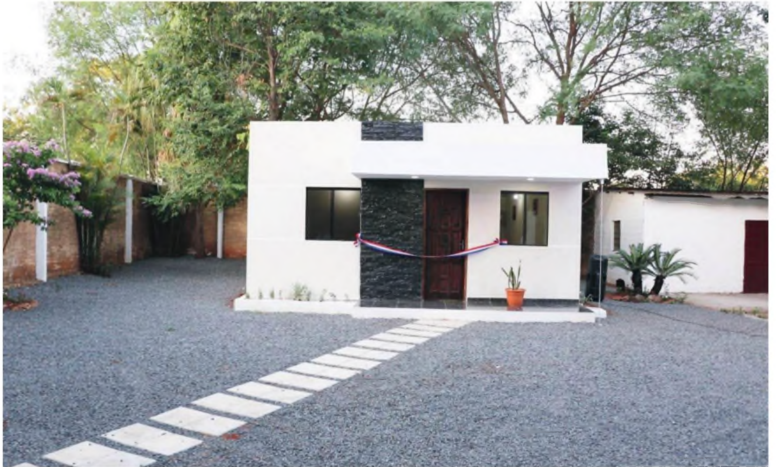
Los interesados pueden acceder a la casa propia con cuotas bajas.

“No hay límites para construir las casas, queremos construirles casas a todas esas personas que tienen un terreno o están pagando un terreno y que les han cerrado las puertas para obtener su casa anhelada. La garantía para nosotros, son los terrenos, por lo tanto, si alguien está cancelando un terreno y le quedan, por ejemplo, 24 cuotas por