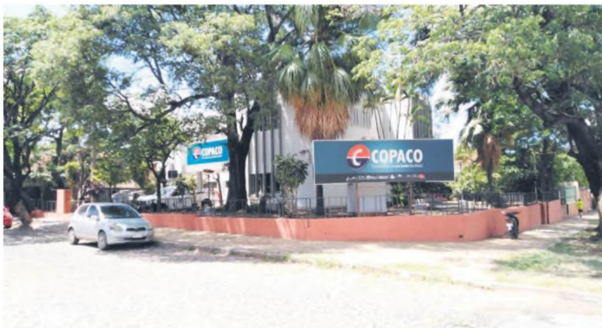
Fachada de la telefónica estatal, con problemas hasta para pagar sueldos.

"Entonces, para ordenar ese proceso lo que nosotros hicimos fue un procedimiento de iniciativa privada que se inició en abril del año pasado, a través del cual todas las empresas que tienen interés llenan un formulario, dicen cuál es su propuesta y firman un memorándum de entendimiento para que ellos nos pasen los datos que nosotros les pedimos y nosotros les pasemos los datos que ellos necesitan para hacer una propuesta más concreta", redondeó.