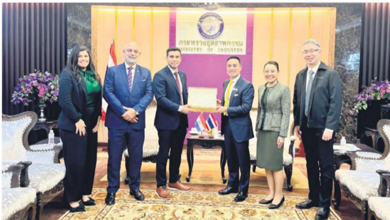
Representantes de los dos países conversaron en Tailandia.

En materia industrial, se discutió el potencial de inversión en el sector automotriz. Tailandia, como