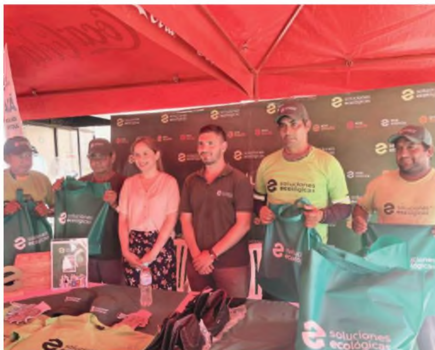
En conferencia de prensa reiteraron su apoyo continuo en esta tarea.

MILLONES DE PERSONAS VIVEN DEL RECICLAJE SEGUN BM.