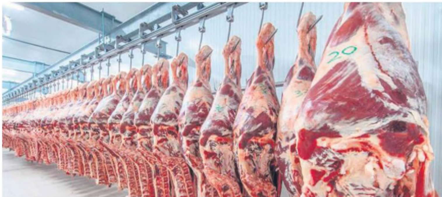
Los envíos hasta el segundo mes del año totalizan 60.650 toneladas y US$ 339 millones de dólares.

Un hito del crecimiento del mercado de los Estados Unidos para la carne bovina paraguaya, en este segundo mes del año, fue la realiza-