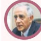
RODRIGO BOTERO Exministro HACIENDA COLOMBIA