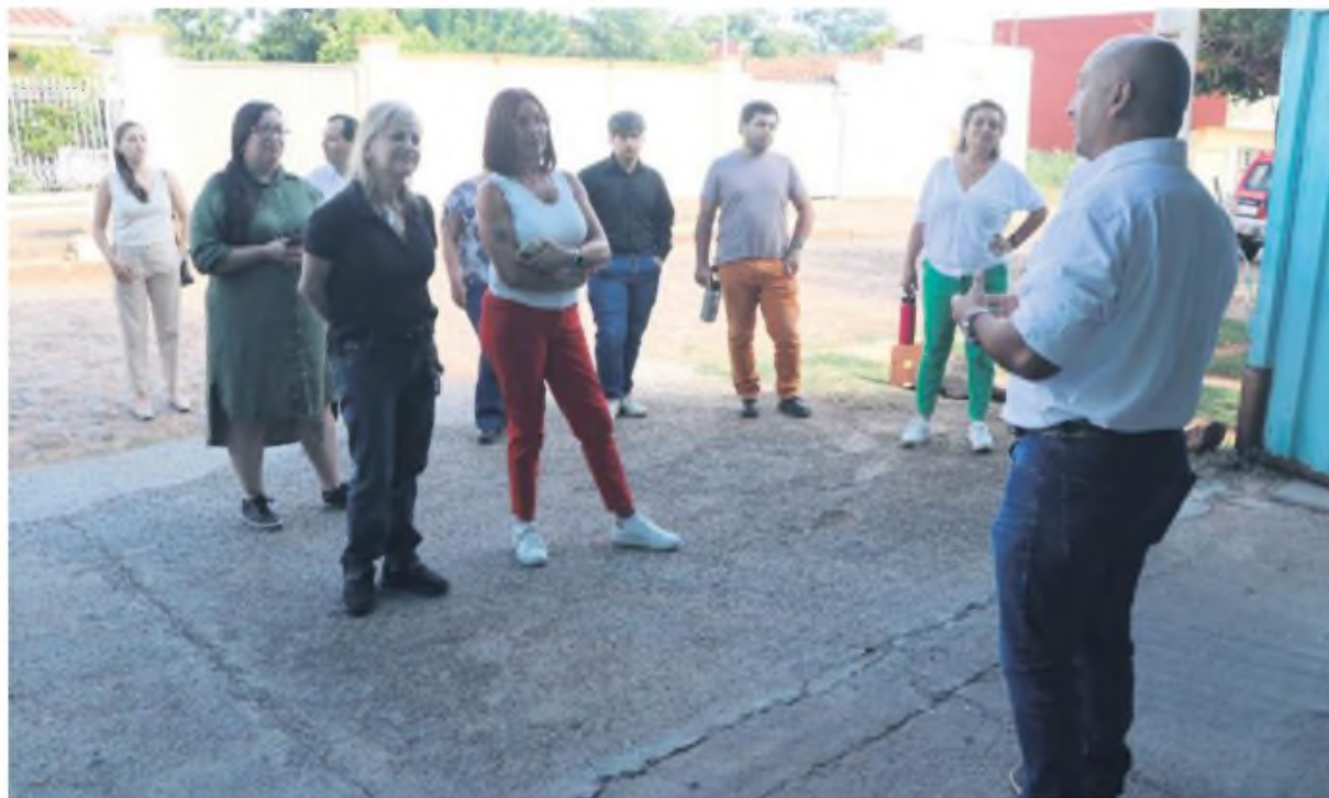
Propietarios de Mipymes que participaron del Tour Industrial del Club Mipymes.

"Estoy muy agradecida con la UIP por esta oportunidad. Es impresionante el nivel de organización y el trabajo en equipo que hay en la empresa. Más que una marca, es una gran familia con valores que se reflejan en cada producto. Me llevo muchas ideas para aplicar en mi negocio, especialmente sobre la importancia de la nume-