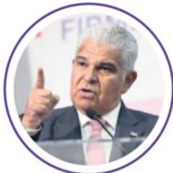
JOSÉ RAÚL MULINO PRESIDENTE DE PANAMÁ

La Frase El Canal de Panamá no está en proceso de recuperación. Rechazo a nombre de Panamá y de todos los panameños esta nueva afrenta a la verdad".